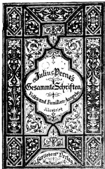
Erscheint in 100 Illust. Lieferungen à 25 Kr. 6. W. = 30 Pf.

Sobald erschien „DER WEINREGULATOR“, der treueste und verlässlichste Rathgeber über das sicherste und beste Weinverbesserungs-, Vereblungs- und Vermehrungs-Verfahren, wodurch, wenn der reinste Naturwein schon in Fässern ist, wenigstens noch zweimal so viel Wein von bedeutend besserer Güte erlangt wird. Practische Anleitung zur Vereblung und Vermehrung schon abgelagerter, noch junger Weine, und Verbesserung geringerer, schlechter, matgewordener, alter Weine. Besonders geeignet für schlechte Weinabgänge hinsichtlich der Qualität. Für sicheren und guten Erfolg wird garantiert. Hunderte von Zeugnissen liegen vor, welche es alle bekräftigen, daß bloß dieses Verfahren das einzig beste, practische und einfachste ist und haben sehr viele unserer Abnehmer diesem Buche ihren jetzigen Wohlstand und Reichthum zu verdanken. Obiges Werk ist in sehr leicht verständlichem Style gehalten und muß daher von jedem Laien, ja sogar von jedem Kinde, sehr genau verstanden werden, übrigens sind wir gerne bereit, noch nähere Aufschlüsse über etwas Unklares den geehrten Abnehmern gratis zu ertheilen. Preis 3 fl. Bestellungen erbitet man entweder per Nachnahme oder vorherige Geldeinsendung unter Adresse: Expedition des „WEINREGULATOR“, Wien, Taborstraße, Hotel „Zum schwarzen Adler“.