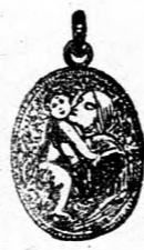
Rafael Madonna amulett