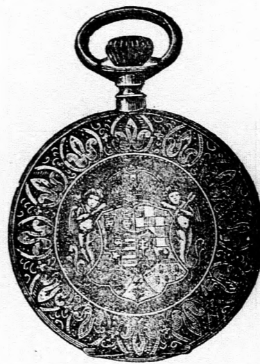
Kitűnő járatu tula horgonyremontoir óra, aranyozott szegélyvel és Magyarország domborművű ezimérel 9 frt.