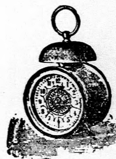
Kakas ébresztő óra, díszített számlappal, kiváló járatuvel, 18 cm. magas 2 frt 20 kr.

Minden tárgy a kir. főpénzverdehivatal által megvizsgálva és bélyegezve.