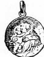
Szent Antal amulett, színes tűzománeu aranyozott ezüstből 2 frt. Ugyanaz aranyból 3 frt 50 kr.