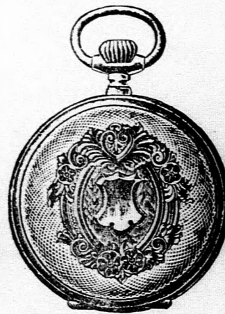
Valódi kettős fedelű ezüst remontoir óra, igen jó járatu szerkezettel, pompásan vésett és aranyozott keretű tokban, ára 16 korona. Hasonló aranyozott keret nélküli 12 korona.