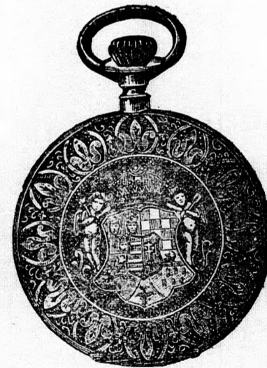
Kitűnő járásu tula horgonyremontíró óra, aranyozott szegélyllyel és Magyarországi domborművi ezimerevél 9 frt.