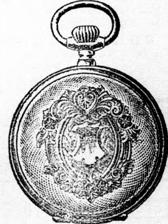
Valódi kettős fedelű ezüst remontíró óra, igen jó járásu szerkezetű, pompásan vésett 4. aranyozott keretű tokban, ára 16 korona. Hasonló aranyozott keret nélküli 12 korona.