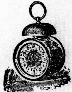
Kakas ébresztő óra, diazített számlappal, kiváló jó művel, 18 cm. magas 2 frt 20 kr.

Minden tárgy a kir. főpénzverdehivatal által megvizsgálva és bélyegezve. Kitűntetve állami és aranyérmekkel. Több ezer ismerő levél birtokomban van. Nagy képes árjegyzék ingyen és bérmentve küldetik.