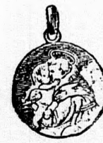
Szent Antal amulett, színes tűzomanézos aranyozott ezüsből 2 frt. Ugyanaz aranyból 3 frt 50 kr.