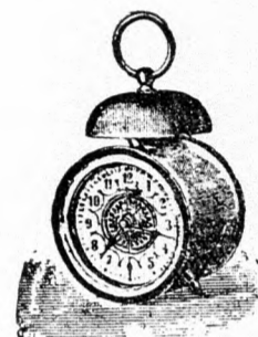
Kakas-ébészítő óra, diszített számlappal, kiváló jó művel, 18 cm. magas 2 frt 20 kr.

Minden tárgy a kir. főpénzverdehivatal által megvizsgálva és bélyegezve.