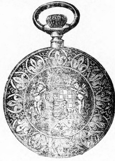
Kitűnő járású tula horgonyremontoir óra, aranyozott szegélylappal és Magyarország domborművű ezimerevvel 9 frt.