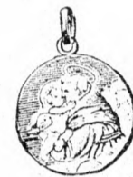
Szent Antal amulett, színes tűzománcos aranyozott ezüstdől 2 frt. Ugyanaz aranyból 3 frt 50 kr.