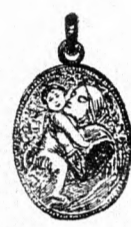
Rafael Madonna amulett színes, tűzománcos aranyozott ezüstdől 1 frt 50 kr. Ugyanaz aranyból 3 frt.