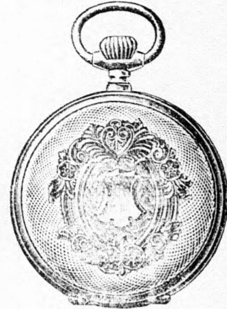
Valódi kettős fedélű ezüst remontoir óra, igen jó járású szerkezetű, pompásan vésett és aranyozott keretű tokban, ára 16 korona. Hasonló aranyozott keret nélkül 12 korona.