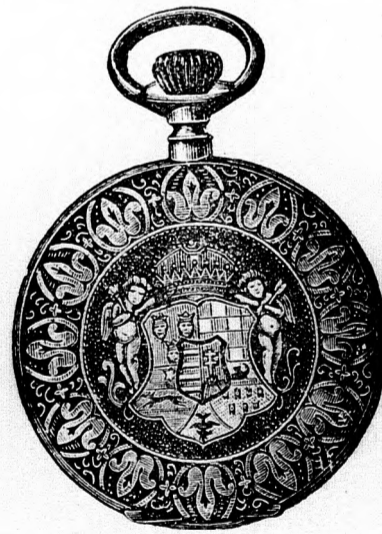
Kitűnő járásu tula horgonyremontoir óra, aranyozott szezálylyel és Magyarország domborművü ezimerevel 9 frt.