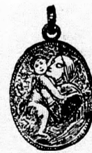
Rafael Madonna amulett színes, tűzomanózos aranyozott ezüstből 1 frt 50 kr. Ugyanaz aranyból 3 frt.