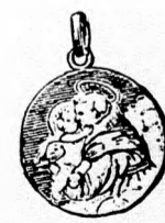
Szent Antal amulett, színes tűzomanózos aranyozott ezüstből 2 frt. Ugyanaz aranyból 3 frt 50 kr.