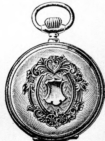
Valódi kettős fedelű ezüst remontoir óra, igen jó járásu szerkezettel, pompásan vésett és aranyozott keretű tokban, ára 16 korona. Hasonló aranyozott keret nélkül 12 korona.