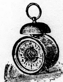
Kakas ébresztő óra, diszített számlappal, kiváló jó művel, 18 cm. magas 2 frt 20 kr.

Minden tárgy a kir. főpénzverdehivatal által megvizsgálva és bélyegezve.