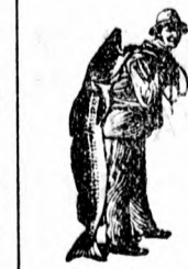
Az Emulsió vásárlásánál a SCOTT-féle módszer védjegyét — a halászt — kérjük figyelmebe venni.