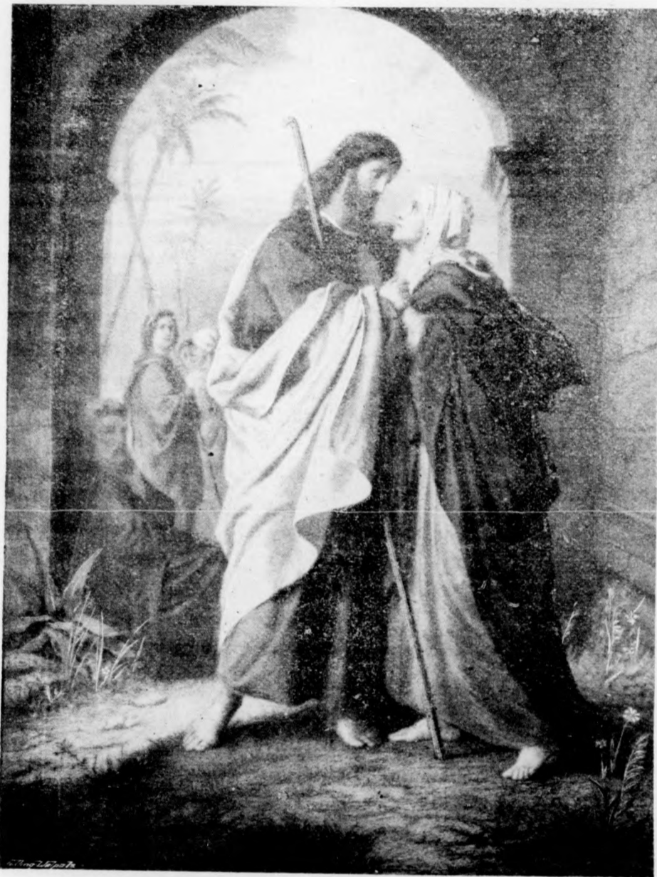
Jézus bucsuzik anyjától. Máté 4, 3.