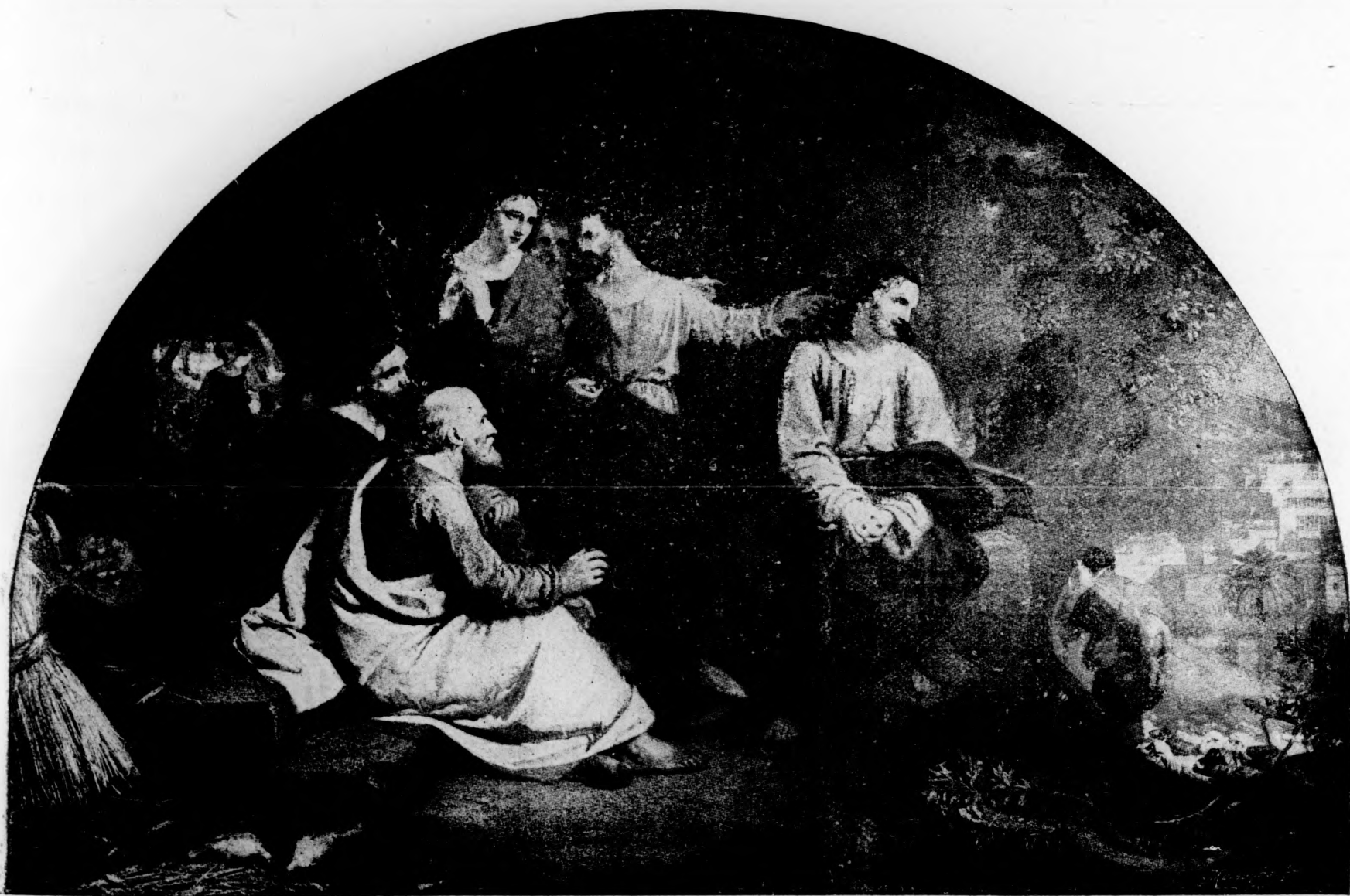
Jézus megijósolja Jeruzsálem pu-ztulását. (Máté 23.)