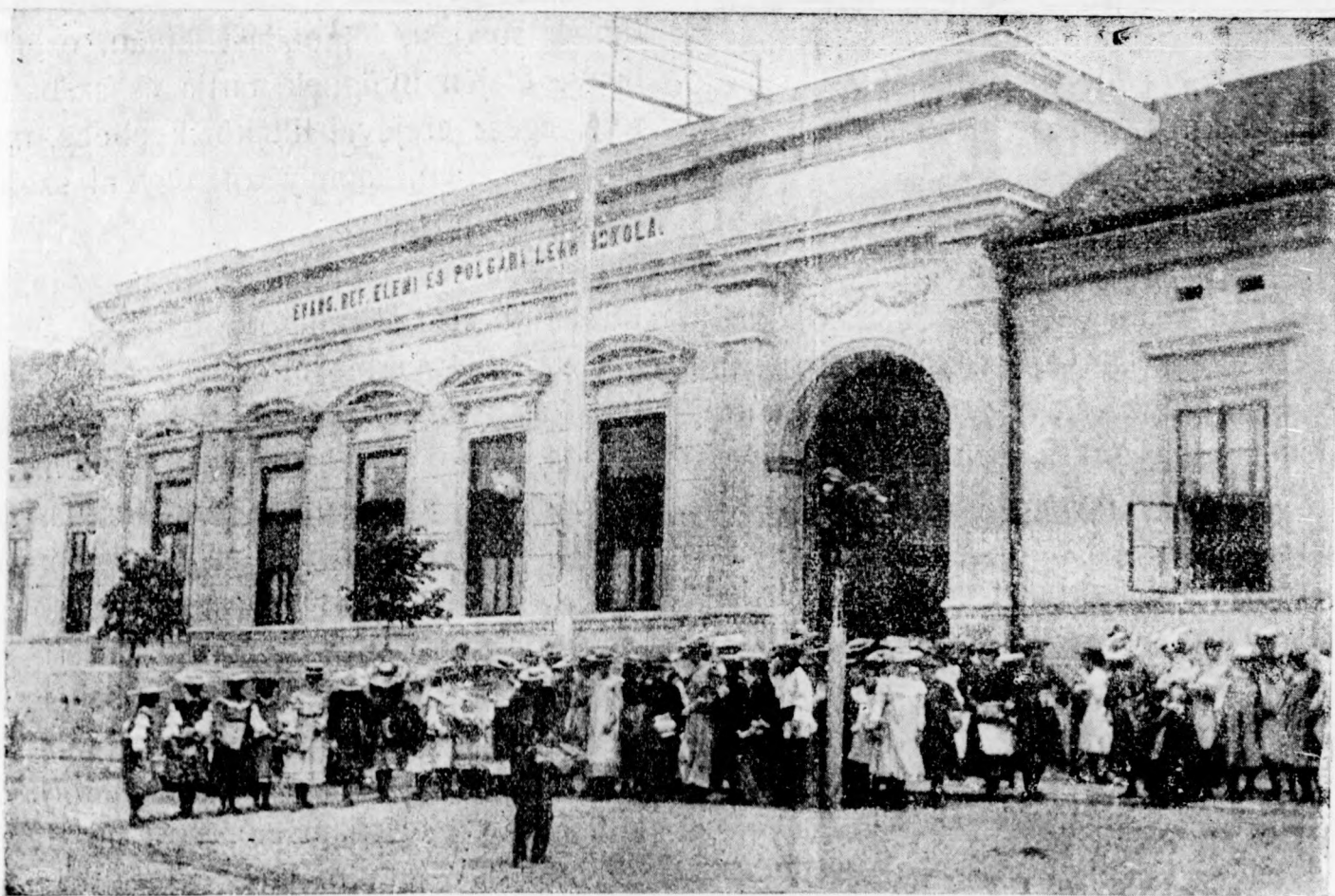
A marosvásárhelyi református polgári leányiskola.

Egy évre 4 kor. Negyedévre 1 kor Fél évre 2 kor. Egy szám ára 10 fill