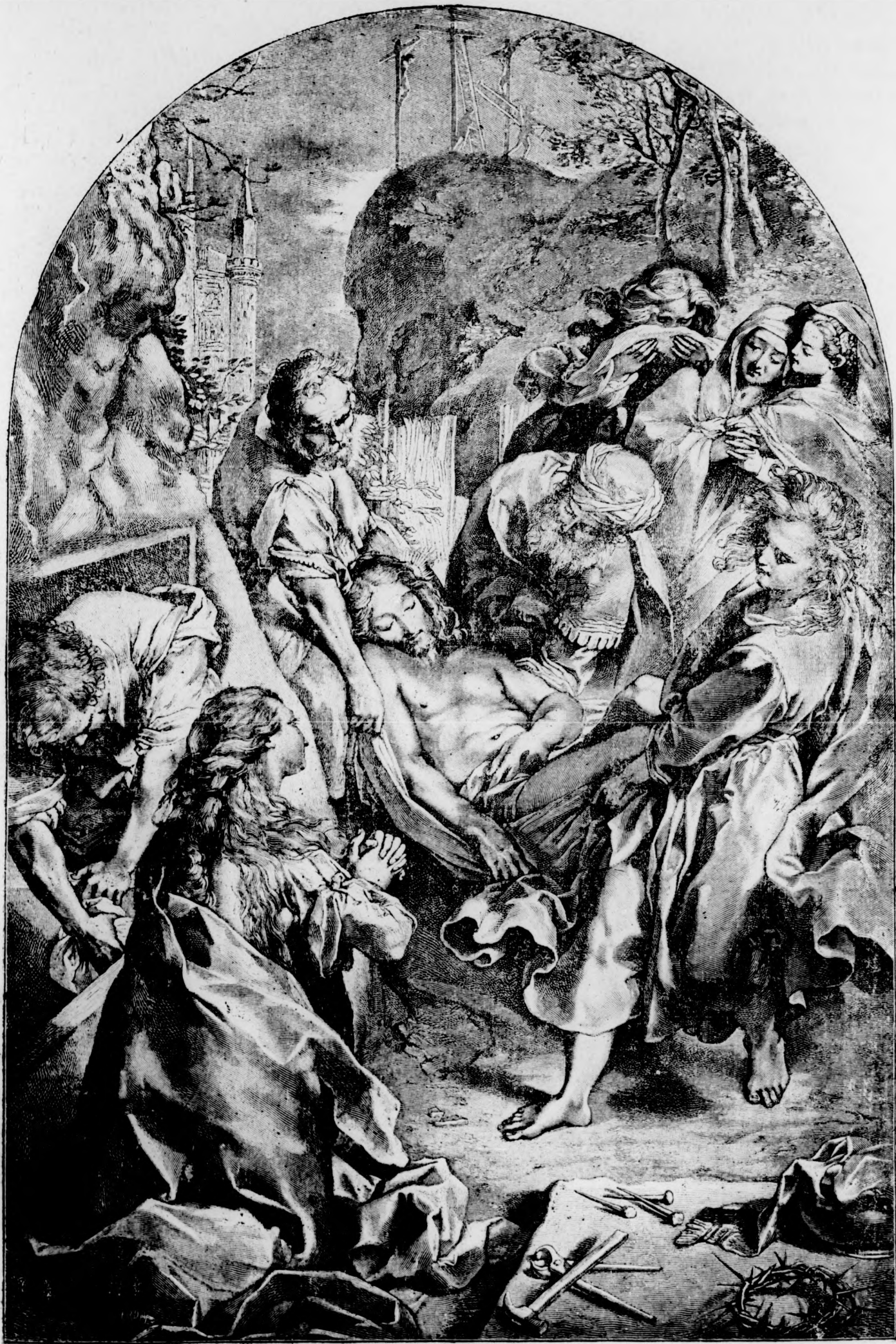
Jézus Krisztus levétele a keresztfáról.