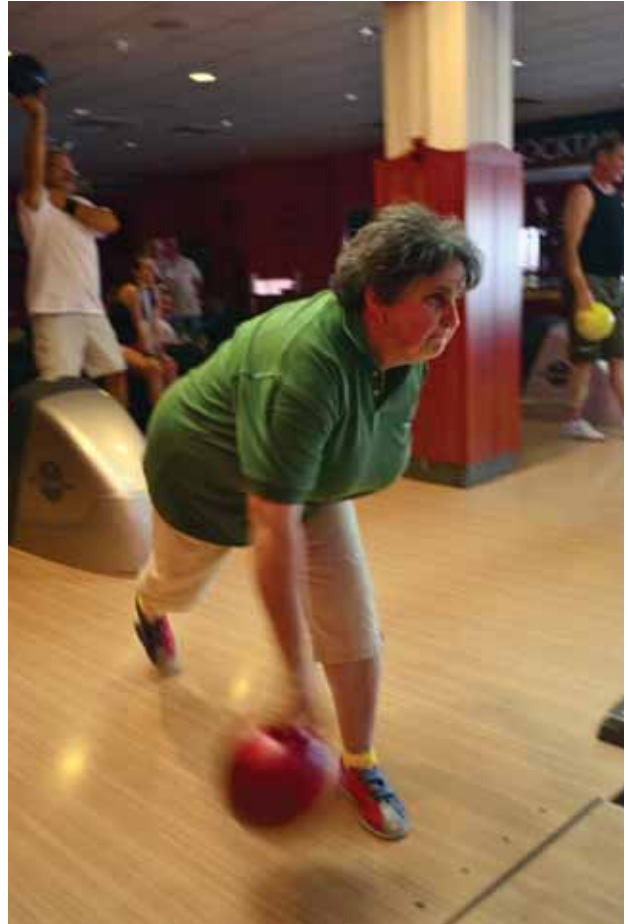
Sárkányhajó, bowling, Tiszavirág-híd – tudósításunk a szolnoki Sportnapokról a 12-15. oldalon olvasható.