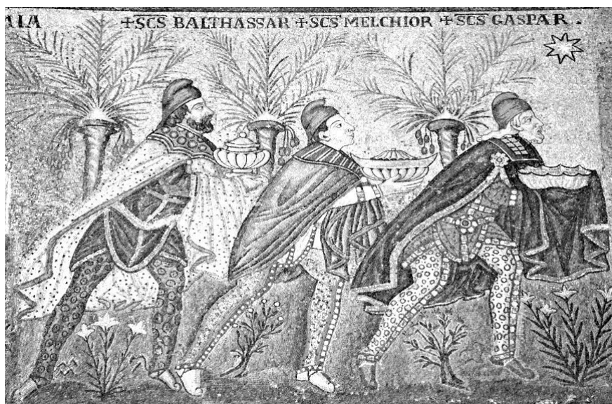
A három bölcse és a betlehemi csillag a ravennai San Apollinare Nuovo bazilika mozaikján (565 körül)

A betlehemi csillagot már ekkor azonosították Bálámnak a Jákób csillagáról jövendölt történettel. A két történet párhuzamba állítása már korán