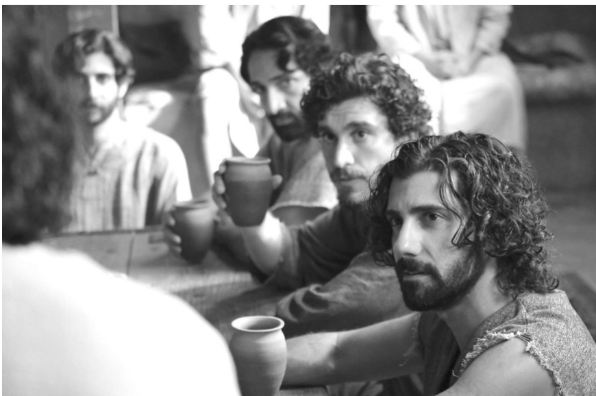
Fotó: Jézus tanítványai a Kiválasztottak c. sorozatból

Isten Lélek, láthatatlan szellemi valóság, ilyen értelemben jogos az állítás, hogy Istent senki nem láthatja. Mégis azzal, hogy egyszerűen fiát, Jézus Krisztust elküldte közénk, ezáltal „arcot”, karaktert kapott, rajta keresztül nagyon sok mindent engedett megismerni önmagából. Legfőképpen azt a hatalmas szeretetet, ami belőle árad az egész teremtett világ felé. Érdemes úgy olvasni az evangéliumokat, hogy gondolatban mi is beállunk Krisztus követői közé, Máriával együtt letelepszünk a lábához, a tanítványokkal együtt feltesszük kérdéseinket, betegekkel és bajban lévőkkel együtt kérjük az ő irgalmát, gyógyítását. Isten szeretete Jézus Krisztuson keresztül ránk is kiárad. Jézus meghív bennünket az ő követésére, hogy kapcsolódjunk be a mai tanítványi körbe, a gyülekezetbe.