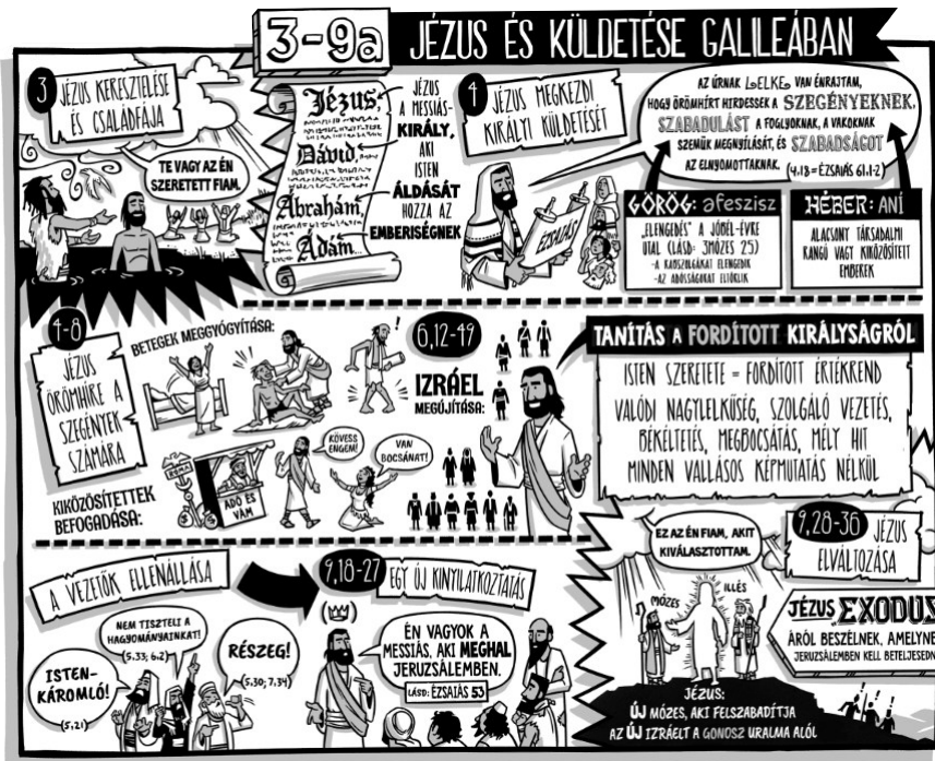
A Biblia Projekt poszterei közül a Lukács evangéliuma részlete

2024. január 9-től, heti rendszerességgel várjuk a résztvevőket. Minden Alpha-est finom falatokkal indul, majd a gyülekezőt követően egy-egy előadás, amit kisebb körben csoportokban beszélgetés követ. Ez alkalmat ad az ismerkedésre, a témához kapcsolódó vélemények, tapasztalatok, kérdések összevetésére.