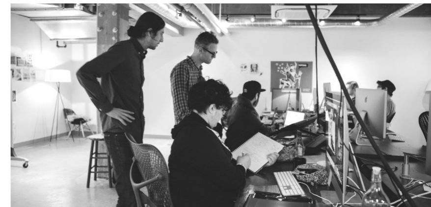
Mindennapi munka egy keresztyén animációs filmstúdióban

Kettejük összefogásában a Bible Project ingyenesen elérhető videofilmeket kezdett alkotni, amelyek akár a YouTube-on is elérhetőek. Kétféle filmjük van: Bevezetések az egyes Bibliai könyvek megértéséhez, ahol animációs eszközökkel, gondolatérképesebb, képregény-szerű stílusban ismertetnek meg