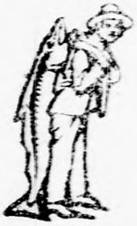
Az Emulsió vasárnapján a SCOTT-féle módosított vésztáplálékot a halászat - kerjük ügyelembe venni.

Orvosok és babák az egész föld kerekén állandóan ajánlják a