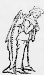
Az Emulsió aszias-ánál a SCOTT-féle módszer védjegyet — a halaszt — kérjük figyelmebe venni.