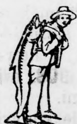
Az Emulsió vérszegénységet a SCOTT-féle módszerrel készítették — a halászt — kérjük figyelembe venni.