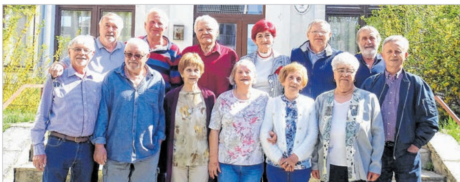
Hatvan éves osztálytalálkozót tartottak a műzsi iskolában az 1966-ban végzett 8.B osztály tanulói április 18-án. Megemlékeztek egykori tanáraikról és azokról az osztálytársakról, akik már nem lehettek közöttük. Felelevenítettek régi történeteket, rosszalkodásokat, csintalanságokat. Úgy döntöttek, hogy ezután gyakrabban találkoznak.

Most negyedszer osztályfőnök a gimnáziumban. – Az a célom, hogy önállóságot adjak a gyerekeknek. Inkább csak irányítok, és csak szükség esetén avatkozom a dolgokba. Tanuljanak döntéseket hozni, ha hibáznak, ezeket az iskolában nem fogják annyira megérezni, mint a felnőtt életükben. Próbálok konfliktuskerülő ember lenni, de az igazamért mindig kiállok. DUGA