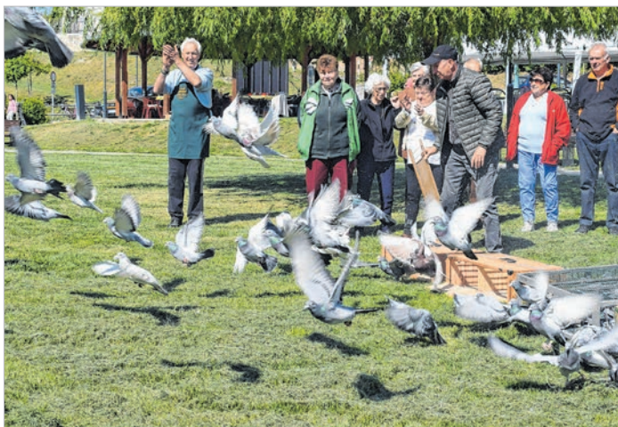
Száz galambot indítottak útnak egyszerre a Duna-parti majálison

Az év során még számos programot szerveznek a tolnai szépkorúak, főleg fürdőlátogatásokat. Mindemellett készülnek a hagyományos lecsófesztiválra, és a mohácsi csata-vesztés ötszázadik évfordulója kapcsán a lovas hagyományörzők megvendéglésére. –Wy-