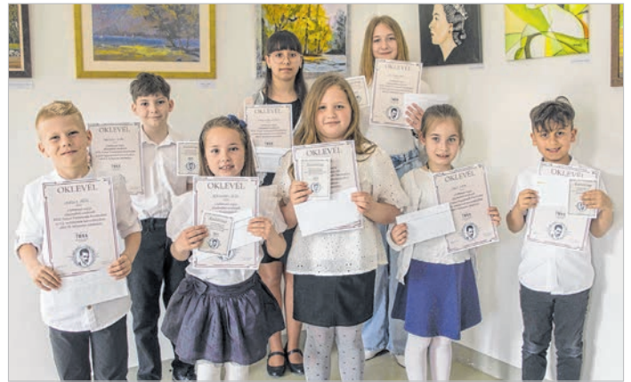
Az 1-2. osztályos és felső tagozatos díjazottak