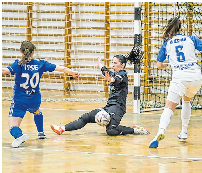
Egy győztes hazai meccs a TFSE ellen, még a bajnokság alapszakaszában, február 22-én

A Tolna-Mözs 3. helyen végzett a bajnokság alapszakaszában. A bajnoki döntőbe kerülésért a TFSE volt az ellenfél. Az első meccset idegenben, magabiztosan hozták Wiesner Dalmáék, a másik, tolnai találkozón viszont az egyetemisták nyertek. A harmadik, ismét Budapesten rendezett összecsapáson egészen a végjátékig vezető Tolna-Mözs nem tudta feltenni az i-re a pontot, a TFSE nyert. Reveland Zoltán gárdája a 3. helyért a Csepellel vív párharcot. Az első mér-