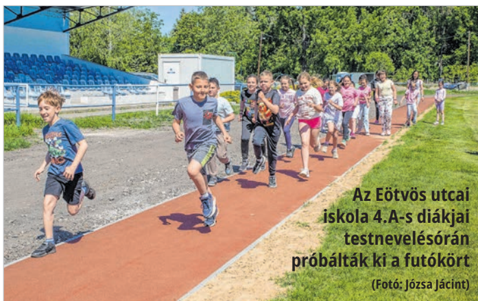
Az Eötvös utcai iskola 4.A-s diákjai testnevelésórán próbálták ki a futókört

Már birtokba vették a rekortán futópályát