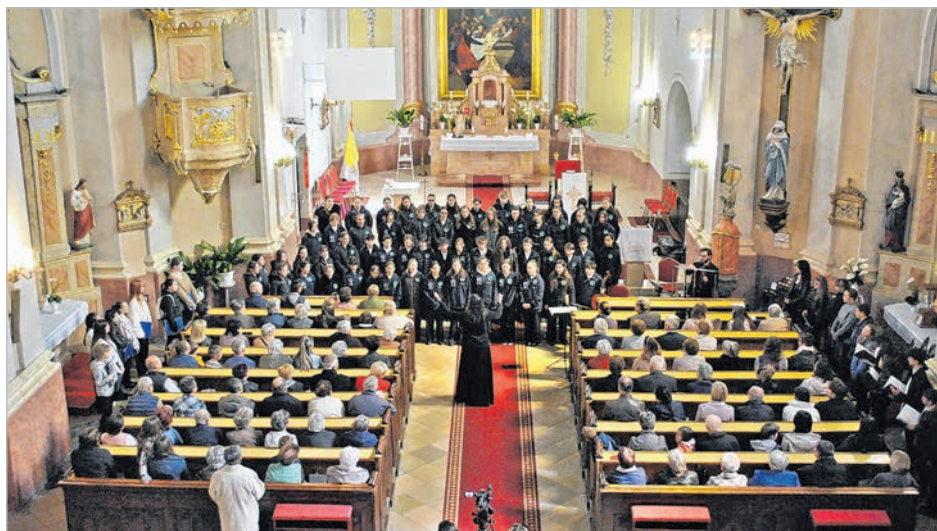
Nem mindennapi élmény volt a gyermekkórus tolnai koncertje

A műsor gazdag volt és nívós. A XIII. századi Cantona Codex gregoriánjától a zeneirodalom nagy korszakain át, a reneszánsz és barokk zenét is érintve jutottak el Bartók Béla, Kodály Zoltán, Kocsár Miklós és Szőnyi Erzsébet zenei világához. Hogy a több száz évvel ezelőtti kórusmuzsika még ma is élvezhető? Erre volt bizonyíték a Mountepellier Codex itt megszólalt anyaga, ami az örökéletű Palestrinán át vezetett a mába.