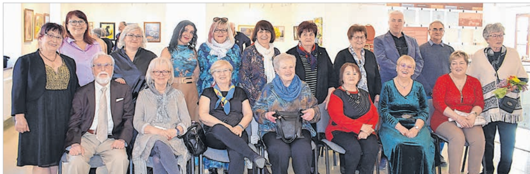
A Bárka Művészeti Szalon tolnai tárlatán kiállító alkotók a megnyitón