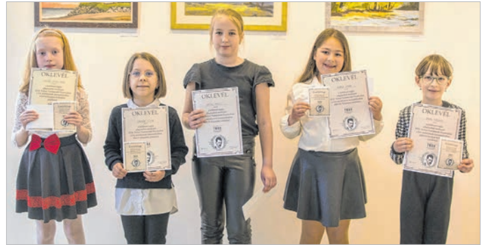
A 3-4. osztályos kategória díjazottjai