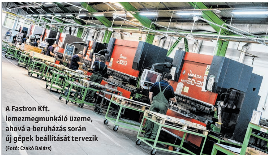
A Fastron Kft. lemezmegmunkáló üze- me, ahová a beruházás során új gépek beállítását tervezik

A beruházás nyomán 30 új munkahellyel bővül a cég jelenleg 345 fős dolgozói létszáma.