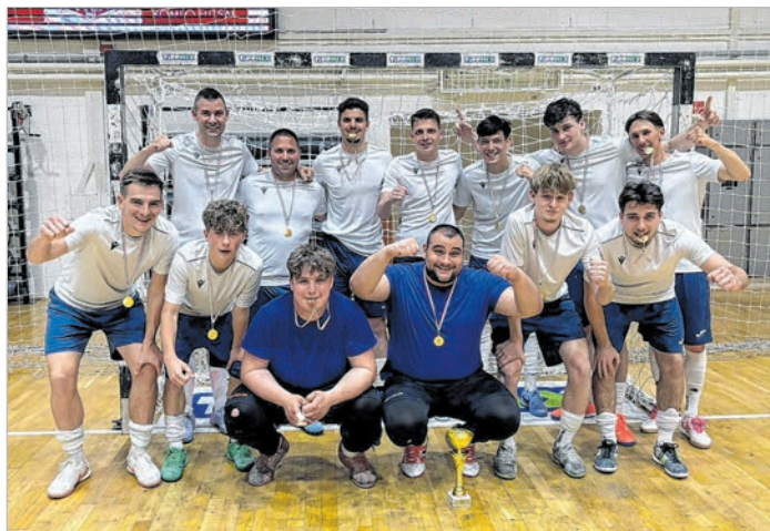
Főlényesen nyerte a bajnokságot a Tolna

FÉRFI FUTSAL NB III. Hibátlan tavaszi mérleggel magabiztosan szerezte meg a bajnoki címet a Tolna csapata az NB III-as férfi futsal bajnokság közép csoportjában.