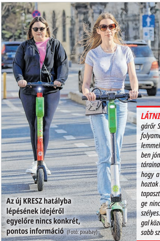
Az új KRESZ hatályba lépésének idejéről egyelőre nincs konkrét, pontos információ