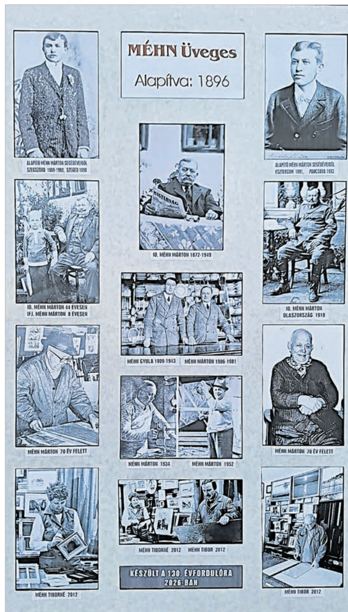
A fotókkal illusztrált családfa

miatt. A gyerekei továbbtanulását is akadályozták. (Négyen voltak testvérek.) Amikor hatvanéves lett, nem fogadta el a nyugdíjat. Azt mondta: ezektől a mocskoktól neki semmi se kell! Dolgozott tovább, 75 évesen halt meg.