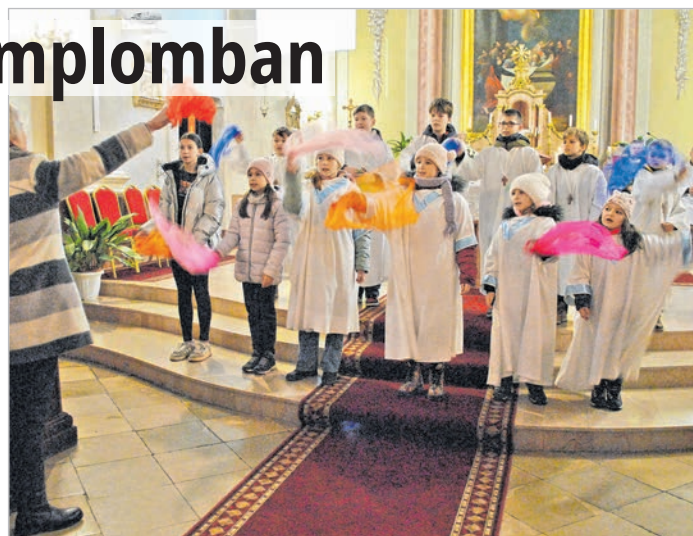
A gyerekek produkciója az oltár előtt

A kíséretől a kántor, Boglári Ágota gondoskodott, zenésztársaisal. -wy-