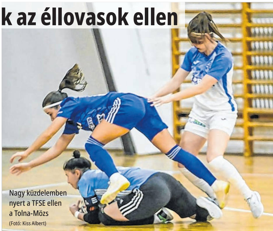
Nagy küzdelemben nyert a TFSE ellen a Tolna-Mözs