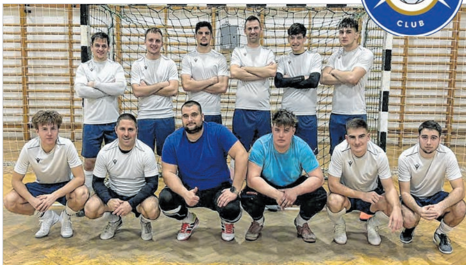
Nyolc meccsen 65 gólt lőtt a csapat

Gól: Ágics (4), Marosi (3), Keszthelyi, Dudoma, Paksi, Frankovszky, Sós.