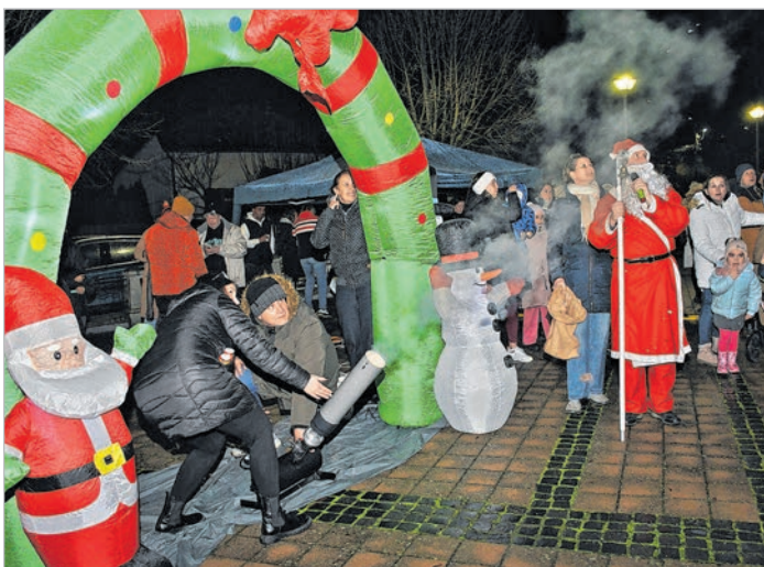
A Családsegítő Központ szaloncukor-ágyúzása is nagy siker volt