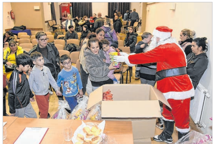
Százhetven csomaggal érkezett a Téli Pótló