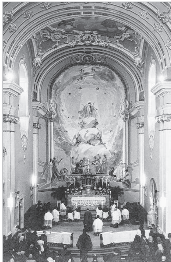
A tolnai templombelsőről készült archív fotó az 1940-es évekből

Advent harmadik hetében szerdán, pénteken és szombaton voltak az ún. kántorböjtök. Érdekesség, hogy a név nem a kántor szóból ered, hanem a latin quattuor