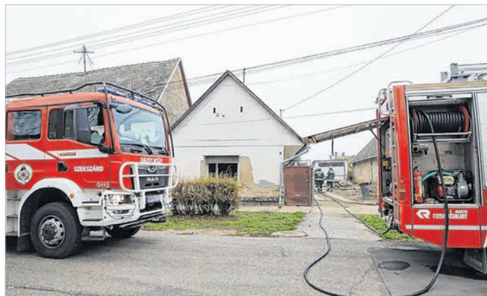
Az Iskola utcai ház hátsó felében keletkezett a tűz

hordták át. A család számára az önkormányzat Tolnán, a Lehel utcai szükséglakásban biztosított átmeneti elhelyezést.