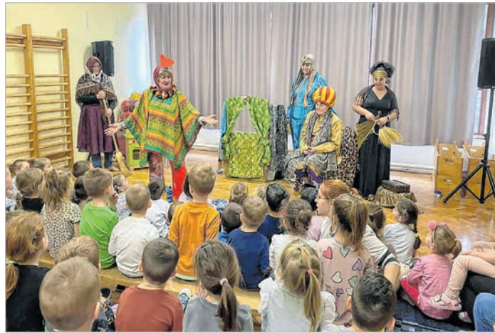
A Kiskakas gyémánt félkrajcárja című mesét adták elő az óvónők

A programok az otthoni szemléletformálást is célozzák, és a remények szerint arra ösztönzik a szülőket, hogy otthon is tudatosabban szelektáljanak és a hulladékokat a megfelelő gyűjtőbe juttassák el, gyermekeik bevonásával. A szülők mindenesetre aktívan működtek közre a programokban, amire az óvoda a jövőben is számít és hálásan köszön.