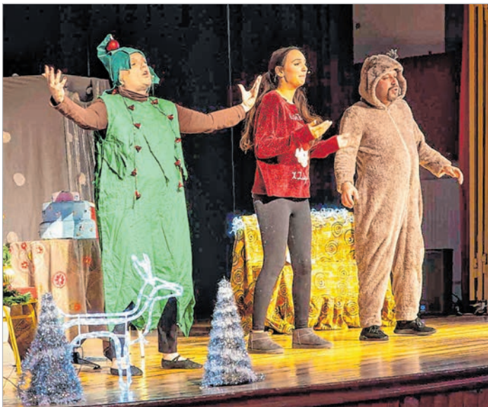
„Lizi karácsonya” a Lovarda színpadán

nyomában” elnevezésű városismereti „rejtvényének” díjátadása, amelyen 64 gyermek kapott ajándékot. Ezután a Családsegítő Központ még szaloncukor-ágyúzást is végrehajtott a téren. J.J.