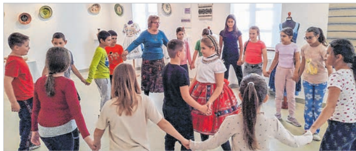
Volt, aki a sárközi viseletet is felpróbálhatta a többiek körtánca közepette

követett, hiszen kézműves foglalkozáson az óvodások színezték, gyöngyöt fűztek, az iskolások