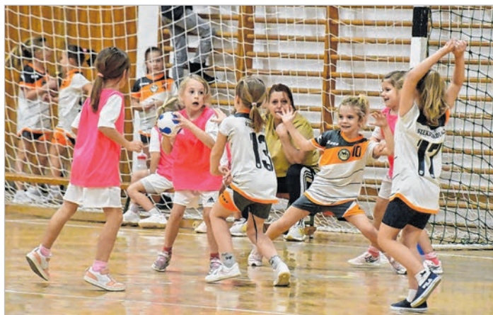
Az eredményt nem számolták, csak a játék számított

Az I. és a II. korcsoportban több csapattal vesznek részt a