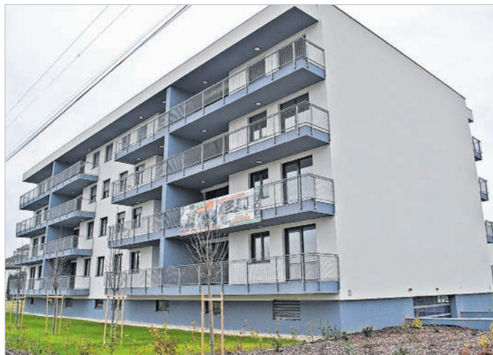
Az újonnan épült tolnai lakások iránt is érezhetően nőtt a kereslet

Sebestyén Szabolcs tapasztalatai alapján jellemzően a fiatalok élnek a kedvezményes hitel lehetőséggel. Az Ingatlanközvetítő adásvételei közül kb. 65% az első ingatlanát kereső ügyfél. A fennmaradó 35%-ból kb. 10% a készpénzes vevő. Őket nem érinti ez a támogatás. 5 százalé-