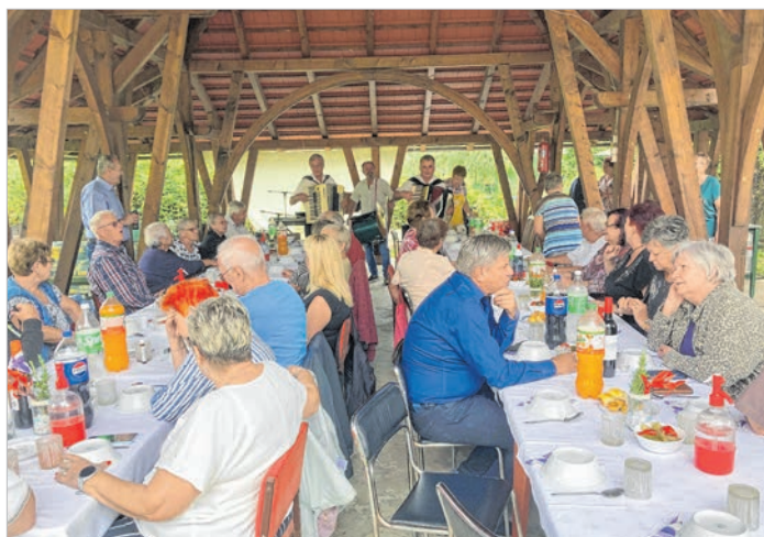
Vendégek és házigazdák egyaránt jól érezték magukat