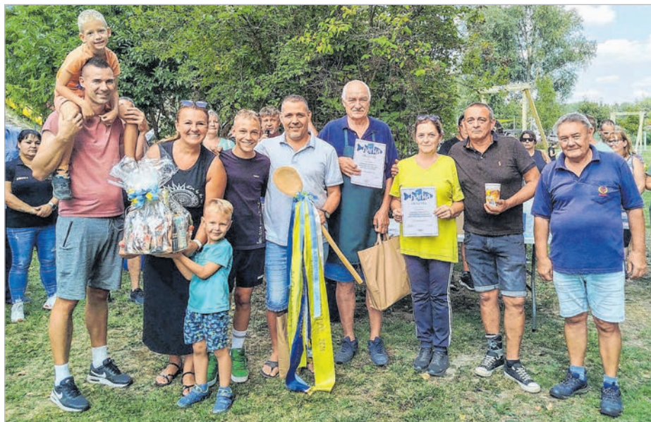
Ezúttal ők főzték a legjobb halászlévet a Bárkán

Idén is érdemes volt ellátogatni a „Bárkára”, ami ezúttal is kellemesen elringatta a közönséget. A szeptember 12-13-án rendezett Bárka Fesztiválon minden adott volt ehhez: a Duna-parti természetközeli helyszín, a tökéletes időjárás, a vidám baráti