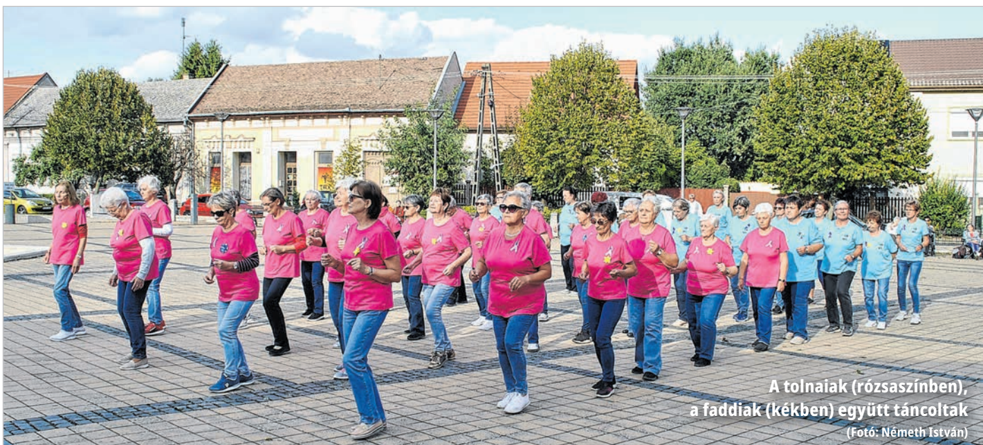
A tolnaiak (rózsaszínben), a faddiak (kékben) együtt táncoltak