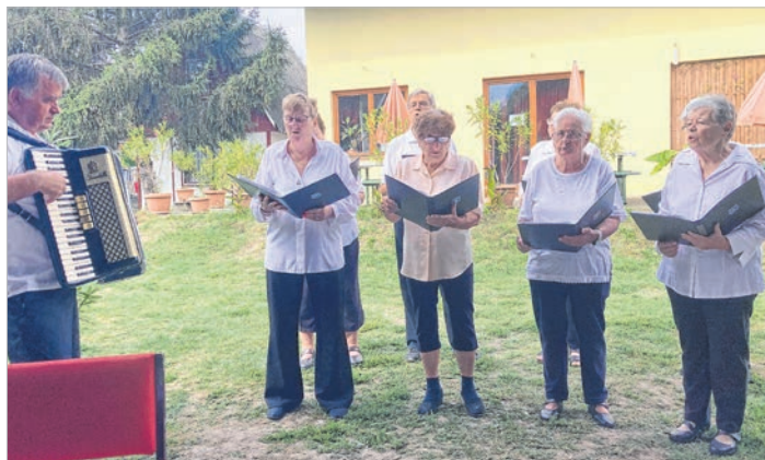
A német baráti kör kórusa is műsort adott

tása előtt és után is. A kicsit már őszi hajló időjárás talán illet az alkalomhoz, a német baráti kör és vendégeik azonban nem siratták a legmelegebb évszakot, csak elköszöntek tőle, bizonyítva, hogy nyarat búcsúztatni igen vidám hangulatban is lehet.