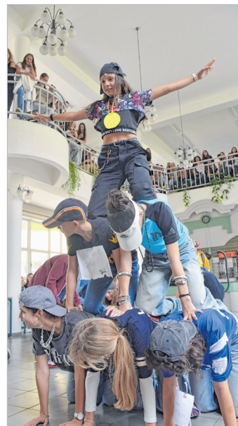
Egy látványos tánc-elem