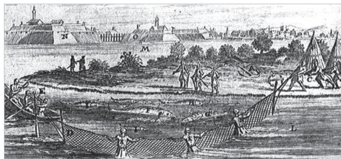
Vizahalászat a Dunán, de nem Tolnán, hanem Komáromnál, 1679-ben