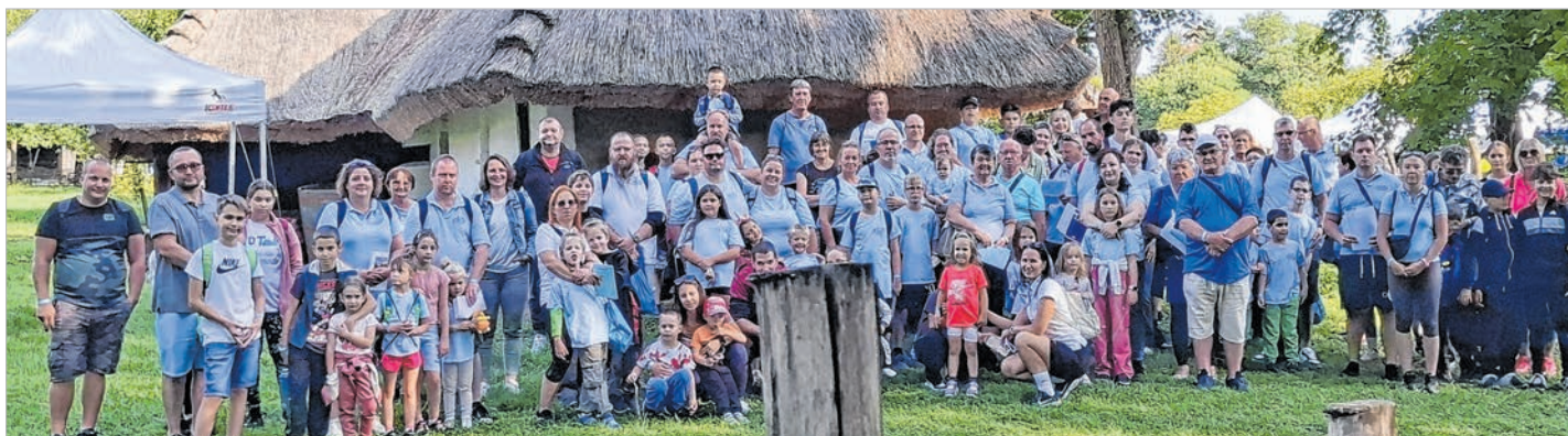
A népes tolnai nagycsaládos különítmény a Vasi Skanzenben (Beküldött fotók)

A kirándulást a Bethlen Gábor Alapkezelő Zrt. által meghirdetett Városi Civil Alap keretében a „Közösségi élmények fokozása a Nagycsaládosok Tolnai Egyesületének életében” címmel megnyert pályázat tette lehetővé. Wessely