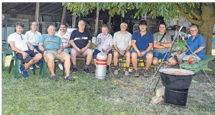
Az éremgyűjtők is szeretik a halászlét