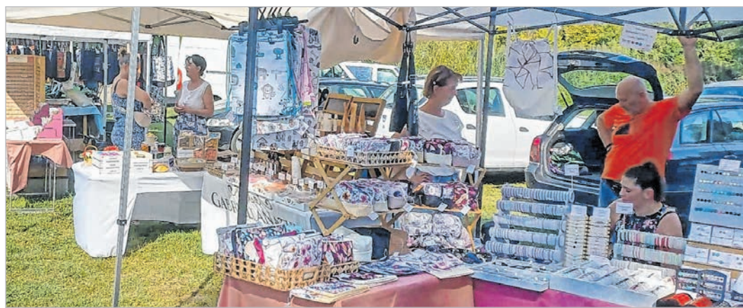
A második termelői piacra a korábbinál több árus települt ki