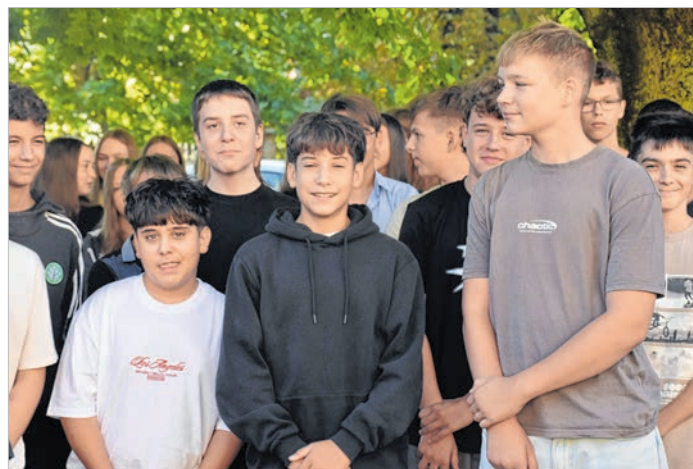
Nyolcadikos diákok a gimnázium évnitóján

A beszoktatás folyamatos. A beiratkozás után a Pitypang óvoda teljesen telítődött, a többi tagintézményben (városi szinten) összesen 29 hely maradt. A csoportlétszámok átlaga 23 fő. Szeptemberben azoknak kötelező megkezdeni az óvodát, akik augusztus 31-ig betöltötték a 3.