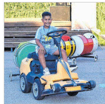
A gyerekek is jól szórakoztak