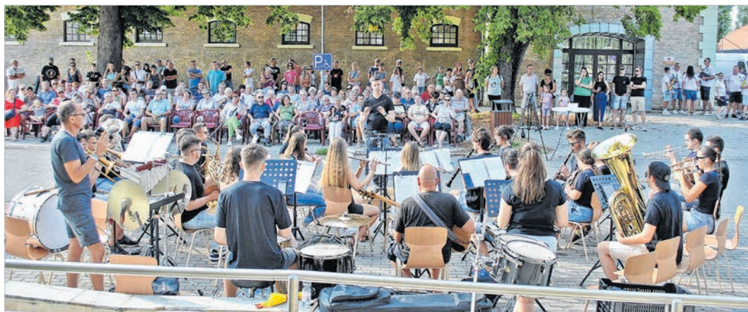
A fesztivál első fellépője a rendező Tolnai Ifjúsági Fúvószenekar volt

A korábbi években kétnapos rendezvény idén csak vasárnapra korlátozódott, de így is nívós zenei élményt nyújtott. Egyenletesen magas színvonalú produkciókkal rukkoltak elő a fellépő zenekarok a MAG-Ház melletti