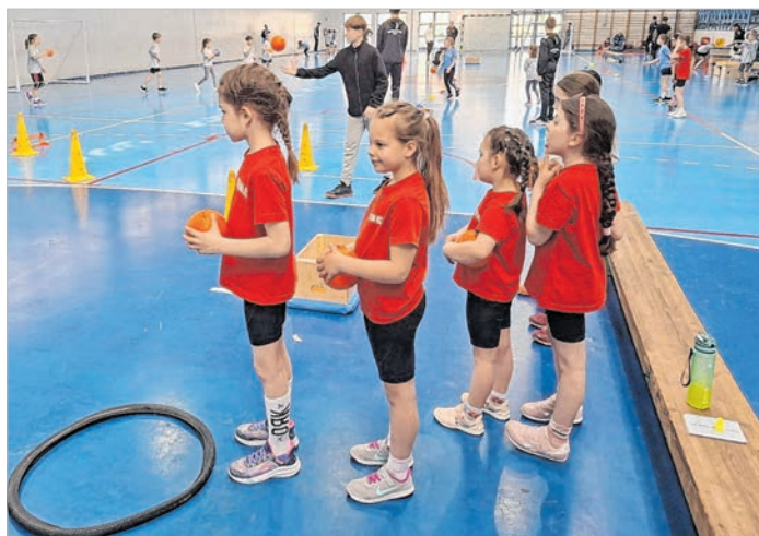
Pillanatkép a Kalocsán rendezett Sulikézi Fesztiválról

A változás a fiatalabb utánpótlás korosztályokat is érintette. Az elmúlt szezonban már nem U8, U9, U10-es csapatok szerepeltek, hanem I. és II. korosztályba sorolta a szövetség a kisiskolásokat. A versenyzetetés is változott, amit két részre bontottak. A fesztivál jellegű versenyeken akadálypályákon ügyességi feladatokat teljesítettek a gyerekek, és kisebb részben kézilabdáztak. A sportág népszerűsítő napokon pedig két kézilabda meccset játszott minden csapat. Ami nem változott, az az, hogy az eredményt egyik