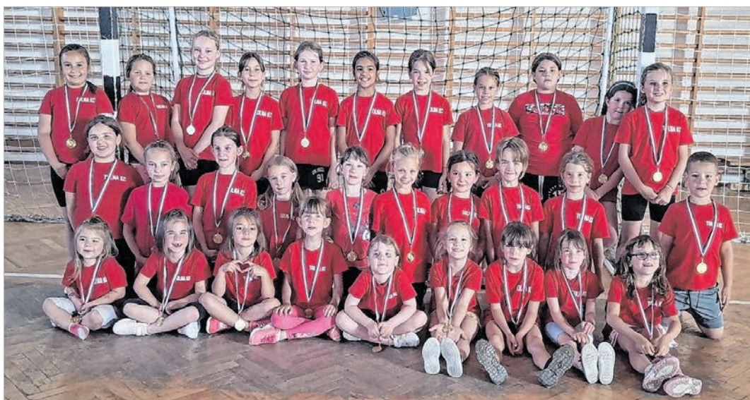
Az I. és II. korosztályos tolnai kézilabdás palánták (Beküldött fotók)

Több változás is történt a versenyzetetésben. Az U20-as csapat a korosztályában nem tudott szerepelni, mert a dél-dunántúli U20-as bajnokságban nem volt elegendő csapat. A Magyar Kézilabda Szövetség ezért felajánlotta, hogy az ifjúsági gárda indulhat valamilyen megyei felnőtt bajnokságban. Mivel Tolna vármegyében szintén nem volt elég csapat, így Bács-Kiskun megyében az I. osztályban szerepeltek az U20-as tolnai lányok. Felnőtt, tapasztalt csapatok ellen kellett játszaniuk, amit több-kevesebb sikerrel meg is oldottak. A Tolna KC felnőtt gárdája pedig a Bács-Kiskun vármegye II. osztályában szerepelt, ahol ezüstérmes lett.