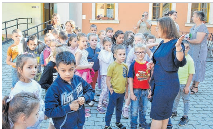
Kisdiákok első napja az Eötvös utcai iskolában