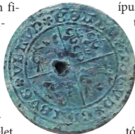
15-16. századi nürnbergi lilimos számolózseton a Malom utcai ásatásról (2024)