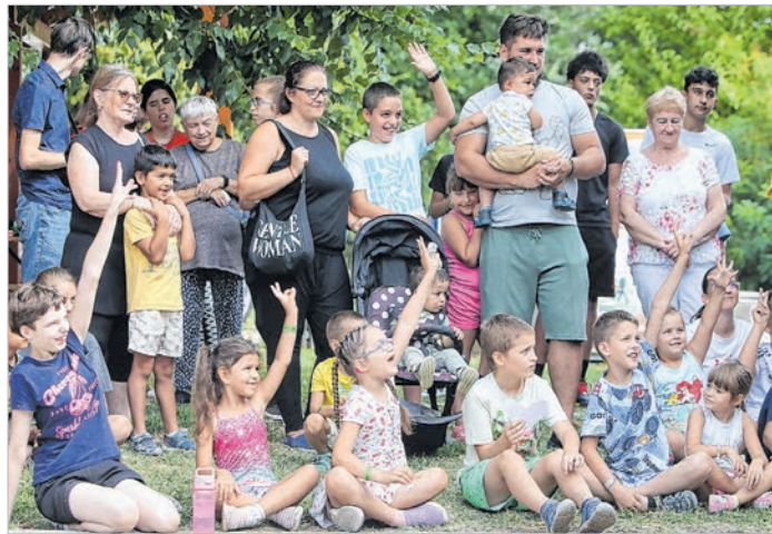
Nevelőszülők és gyerekek egyaránt jól érezték magukat a családi napon

A legjobb, ha a vér szerinti családjukból kiemelt gyerekeket másik, szerető családnál helyezik el. Sok gyereknek alakul így az élete: Tolna vármegyében jelenleg 278 gyermek él az ÁGOTA Közösség 93 nevelőszülőjénél. Őket várták augusztus 29-én Tolnára, az Alta Ripa Szabadidőparkba, hogy találkozzanak sorstársaikkal, átérezzék, hogy nincsenek egyedül ebben a világban és hogy felszabadultan,