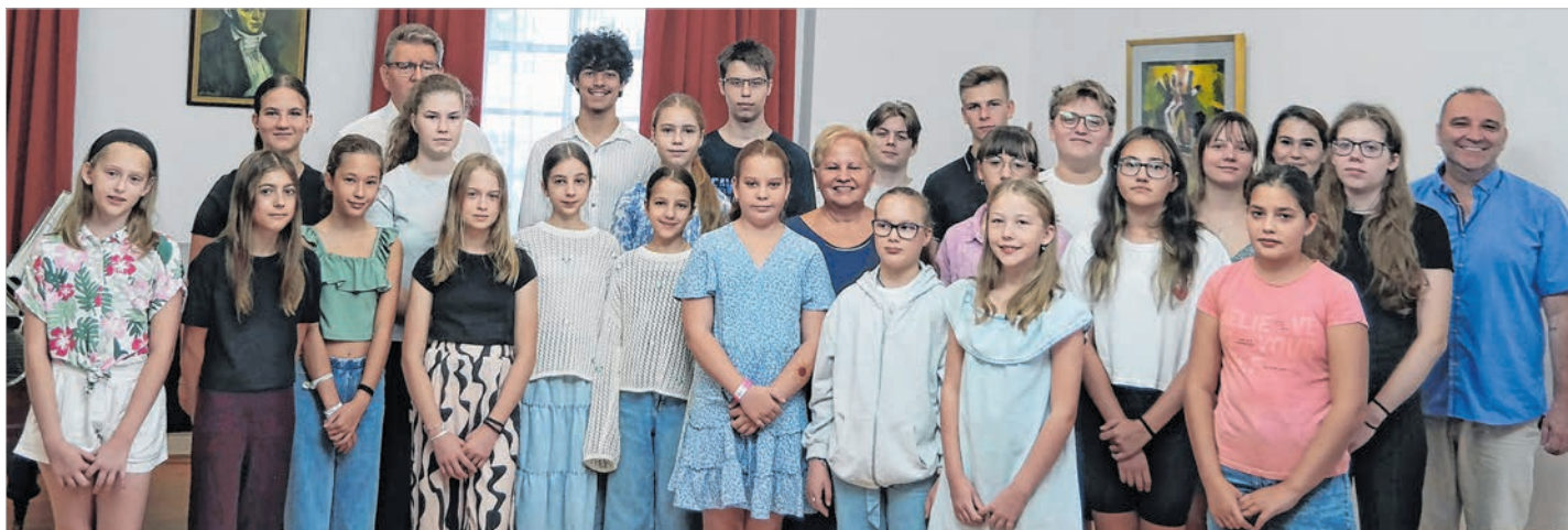
Mesterek és tanítványok a kurzus zárónapján a zeneiskola dísztermében