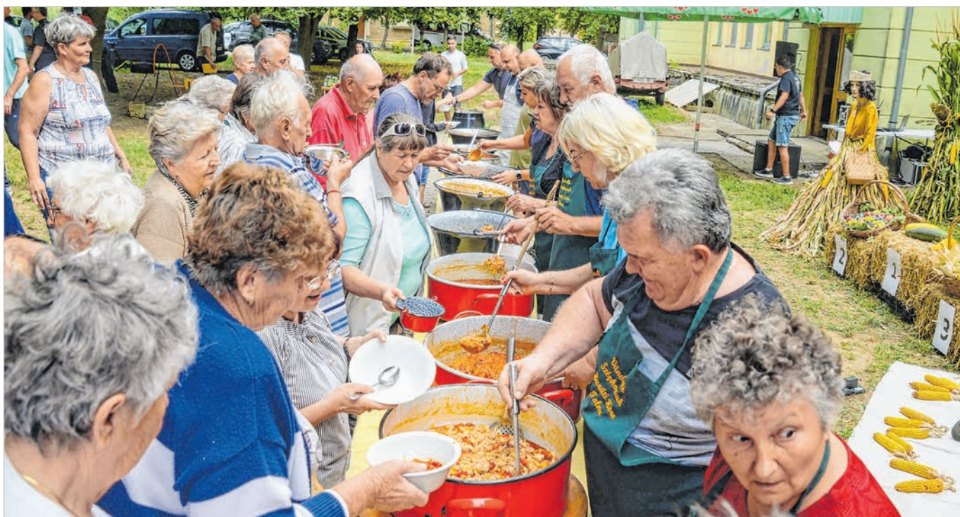
Az elfogadás jegyében bármelyik ételt meg lehetett kóstolni a fesztiválon

„Lecsó-főparancsnokot”. Aki ezután köszöntötte a megjelenteket, jelezve, hogy a megyében csak két településen van lecsőfesztivál-hagyomány: Tolnán és Dombóváron. De szerinte a tolnai lecsók a jobbak.