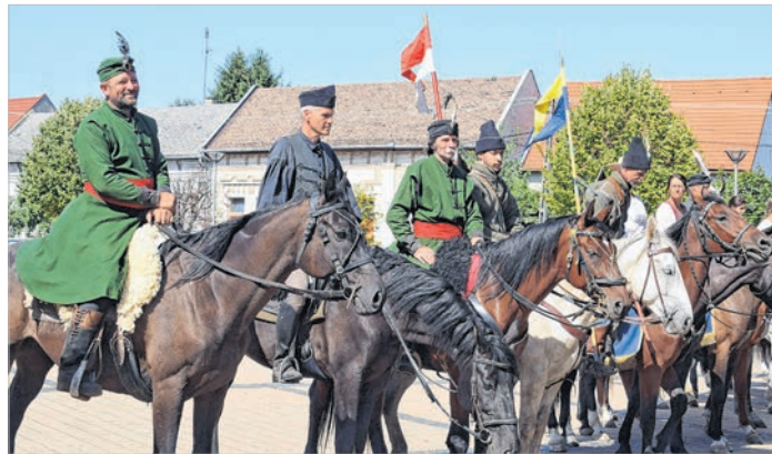
Hagyományőrző lovasok a tolnai főtéren

Megizzadnak a korabeli öltözékekben a lovasok, de vállalják az emléktúrát. Érden gyülekeznek – ahol annak idején a királyi sereg is várta a csatlakozókat –, és az útvonal mentén emléksza-