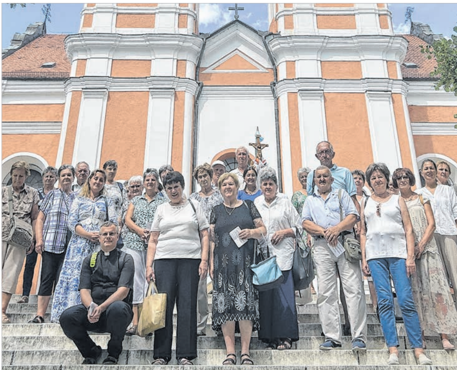
Tolnai zarándokok a máriagyűdi kegytemplom előtt

Az autóbusz 45 fővel reggel 7 órakor indult. A délelőttöt az ünnepi szentmise töltötte ki, amit Felföldi László megyéspüspök az egyházmegye itt megjelent papjával közösen mutatott be. A szentbeszédet Mäger Róbert, a pécsi Havas Boldogasszony templom plébánosa, püspöki irodagazgató mondta. Az idő szép volt, a nap