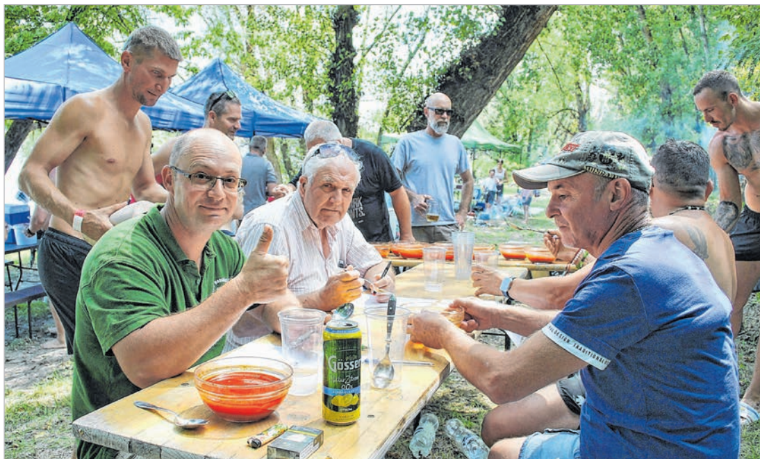
Harminc halászlé mintát kóstolt az öttagú zsűri idén az Alta Ripán

– Mindenből a legjobb minőséget hoztuk. A borunk, mert ez-