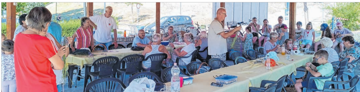
Készülnek a buzogányok a Duna-parti „gomba” árnyékában

A másik két főszereplő egy nagy bográcsban adta elő magát, méghozzá paprikás krumpli formájában. Amit jó étvágygyal fogyasztottak el a levendulabuzogány fonó vándorló szépkorúak.