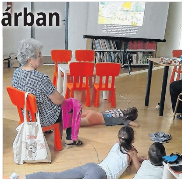
Fekve kényelmesebb a diafilmmzés is