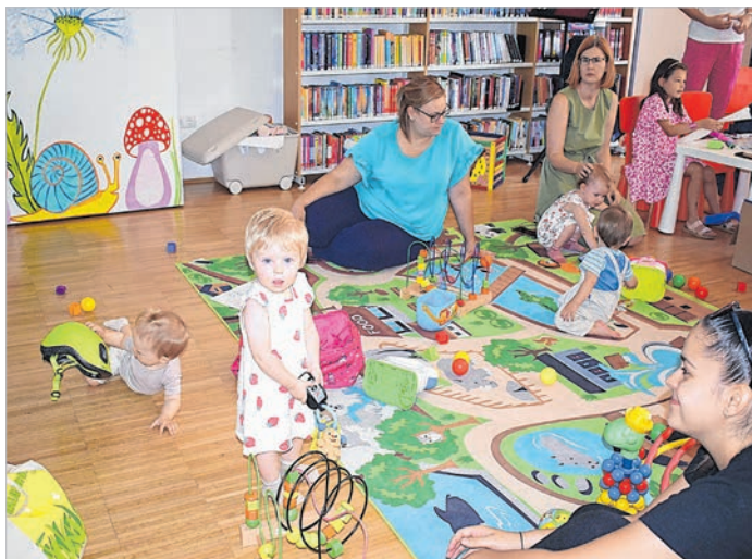
A picik játszottak, amíg a szülők előadásokat hallgattak