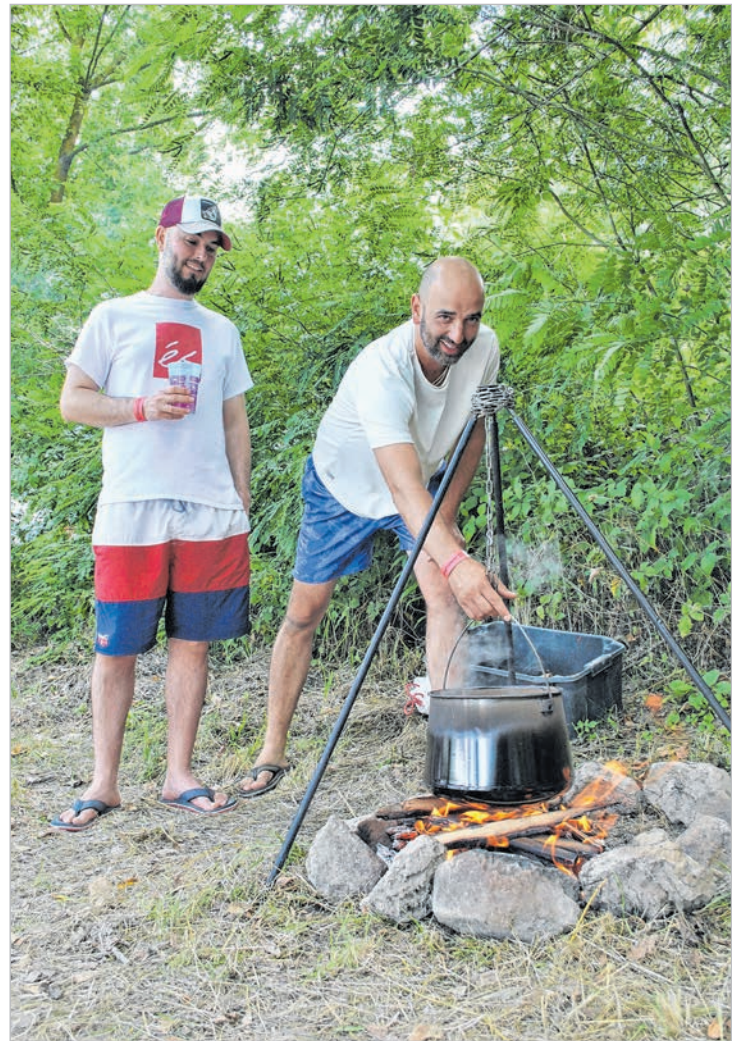
A szekszárdi páros a Remete-csurgó forrásból hozta a vizet

Pár lépéssel odébb rottyog e színes és vidám társaság másik bográcsa. Ez a kormányablakosoké. A bogrács mögött itt is a vezető,