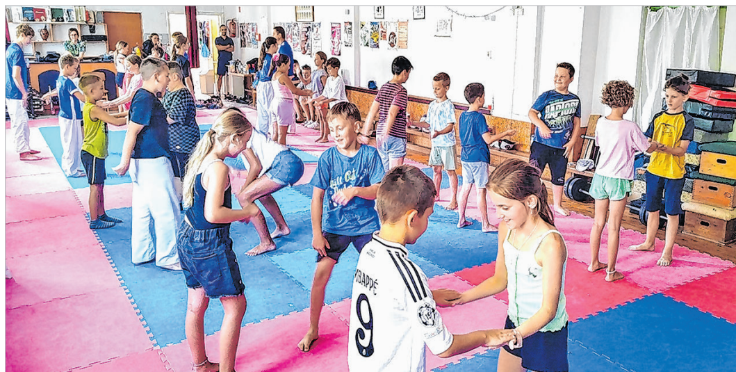
Karate foglalkozás is szerepelt a nyári táborok programkínálatban