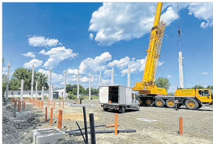
A leendő csarnok oszlopainak nagy része már áll

szág eddigi egyetlen futsal munkacsarnoka lesz.