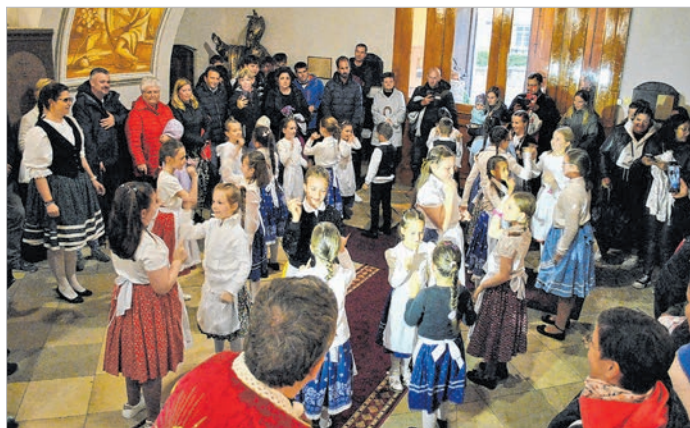
A diákok műsorát is a templomban tartották meg