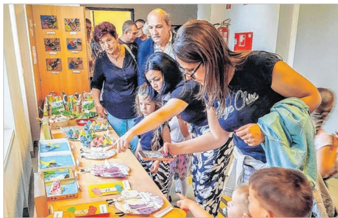
Ötven óvodás alkotásait láthatták az érdeklődők