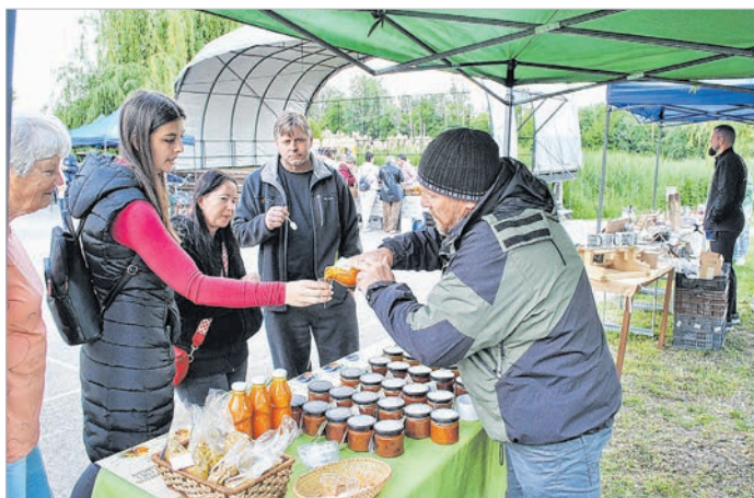
Sokféle áru közül válogathattak a piacra látogatók

A másik cél, hogy egészséges és garantáltan kiváló minőségű