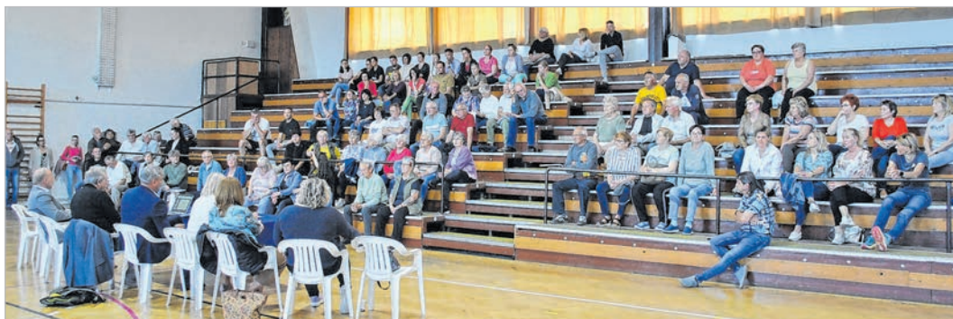
Mintegy nyolcvan tolnai és mözsi polgár vett részt a fórumon

A további hozzászólások mindegyike elismeréssel szólt a Tolnai Hírlapról és az azt készítőkről. Többen arról érdeklődtek, hogy tolnai lakosként milyen lehetőségeik vannak támogatásuk kifejezésére? A fórum egyik résztvevője felolvasott egy előre megfogalmazott