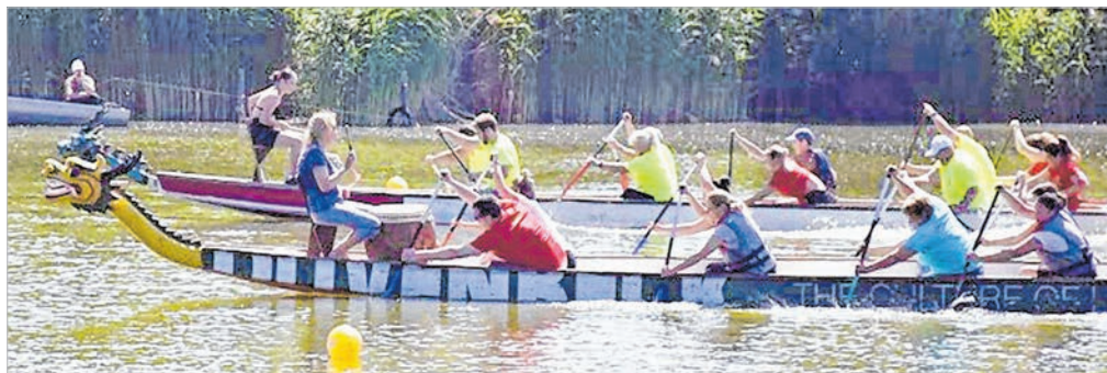
Tizenhét legénység mérte össze tudását a tolnai holtágon (Beküldött fotók)

Gimnázium, a 3-4. helyen az Ady iskola másik két csapata végzett. Az általános iskolásokból álló Minimálbesség csapatát külön értékelték.