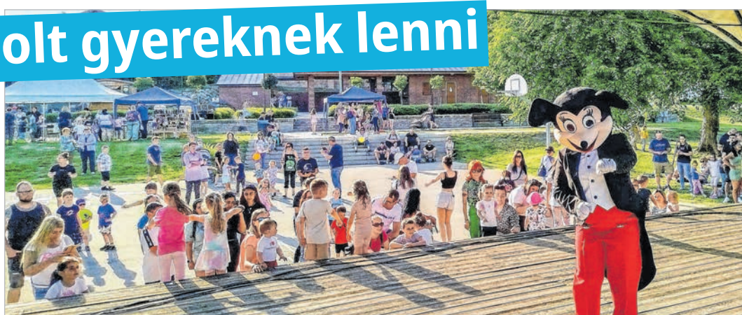
A legendás „egerek” is nagy sikert arattak a gyerekek körében

Kellemes kikapcsolódásban lehetett része azoknak a családoknak, akik május 31-én délután a tolnai Duna-part felé vették az irányt. A számos lehetőséget kínáló rendezvényen főleg a gyerekek kedvében igyekeztek járni a művelődési központ szervezői, de velük együtt a felnőttek sem unatkoztak. A Városi Gyereknapi lebonyolításában a helyi szervezetek közül