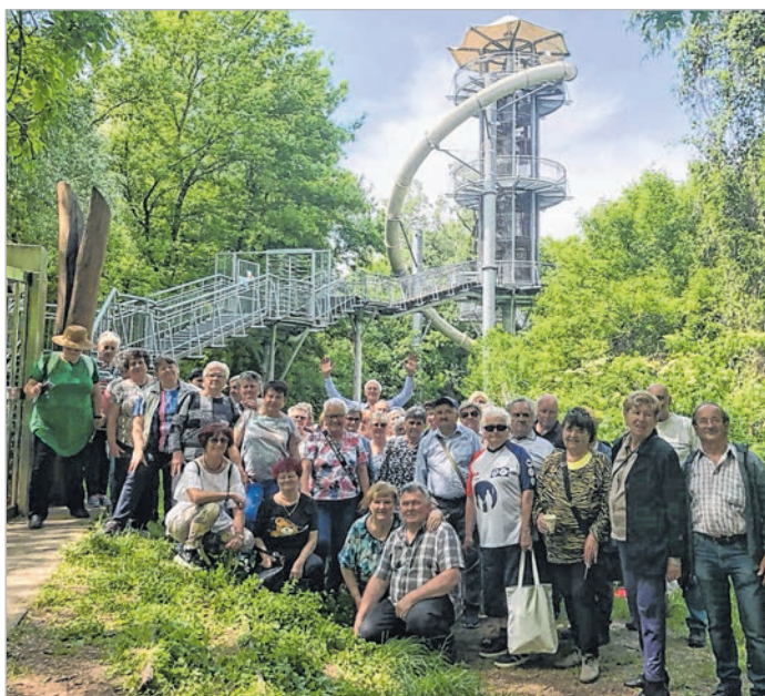
Vándorló szépkorúak a makói lombkorona-sétánynál

A Maros partján fekvő dél-alföldi város korábban elsősorban a környéken termelt igen jó minőségű hagymájáról volt (világ)híres, mára főként a neves organikus építész, Makovecz Imre által tervezett középületeiről és (gyógy)turizmusáról. Ennek megfelelően a tolnai vándorlók sem hagymakóstolás céljából indultak útnak, hanem többek között a Hagymatikumba, azaz a szintén Makovecz tervezte gyönyörű gyógyfürdő nyújtotta élményekbe kóstoltak bele.