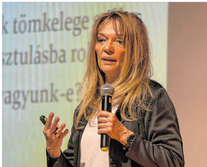
Vissza kell jönni az online téből a realitásba

A közösségi média 5 perc után oldja az önkontrollt. Az érzelmeket tárgyiasítjuk, a láttott arc mögött nem jut eszünkbe az ember. Narcisztikus működés jellemzi, ahol mindenki büszkélkedik valamivel. Legálisan megkapott kárörömcator-