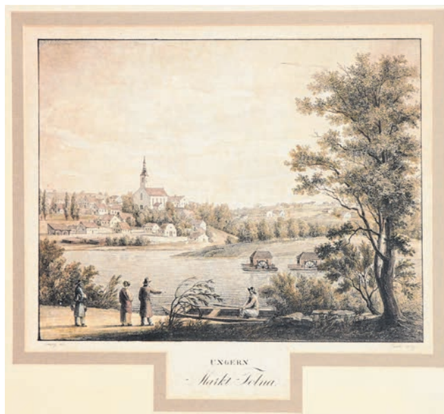
Tolna a reformkorban, dunai hajómalmokkal (Archív fotó)

az utazók vagy a hajón töltötték az éjszakát, vagy elmentek a település híres fogadójaiba, a „Fekete Sasba”. Ide fiatal fiúk kísérték a mit sem sejtő utast, aki hamarosan szembesült azzal, hogy a kikötő környékén egy csomó kutya támad az idegenekre. Erre való volt a fiatalok hada, akik az úton végig igyekeztek elkergetni az ebeket.