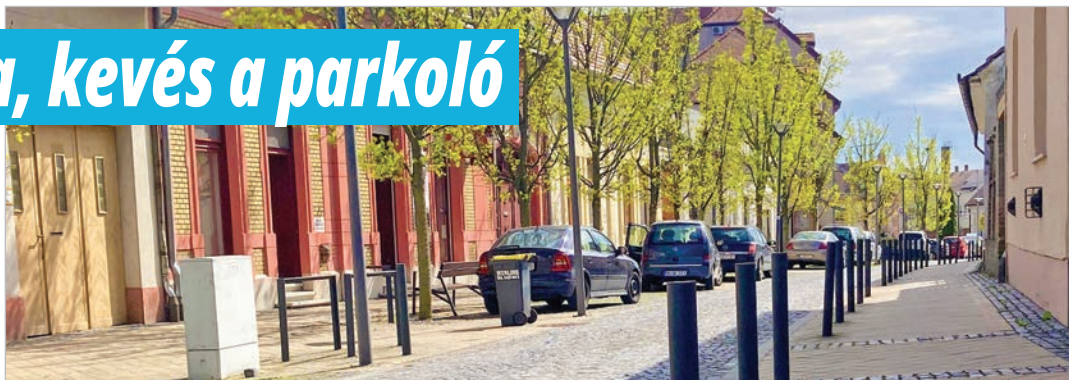
Tovább vizsgálják az Árpád utca fejlesztési lehetőségeit

A képviselő-testület korábbi határozata alapján szakértő véleményét kérték ki az Árpád utcai kandeláberek és forgalomterelő oszlopok (pollerek) esetleges áthelyezése, megszüntetése tárgyában. Annak érdekében, hogy a parkolóhelyek számát esetleg növelni lehessen. A szakértő megállapította, hogy a meglévőknél több szabályos, szabványos parkolóhely nem alakítha-