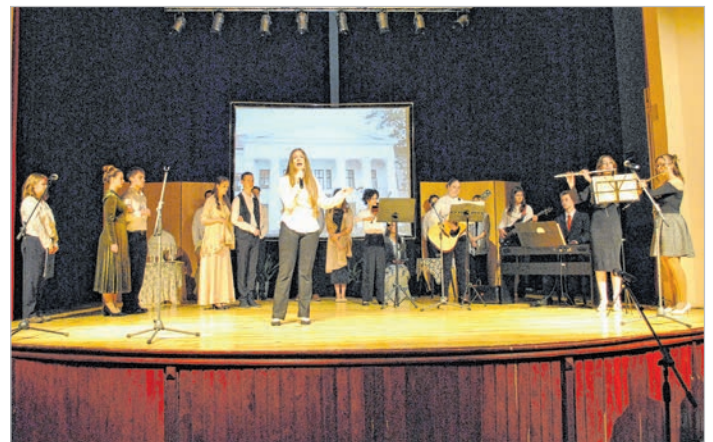
A gimnázium diákszínjászóinak produkciója a vármegye aranykorát idézte meg

Az ünnepség után a Szent István téren, a '48-as emlékműnél zajlott idén is a koszorúzás, ahol a települési önkormányzat, a német és a roma önkormányzat, a vármegyei kormány-