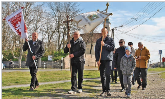
Emmausz-járás 2022 húsvéthétfőjén

halál. A sötétszolozsma Mözsön ünnepeljük, csütörtökön reggeli 7.30-as, pénteken és szombaton pedig 8.30-as kezdéssel. Az ezt követő délutáni szertartások Tolnán lesznek. Ezek sorjában: