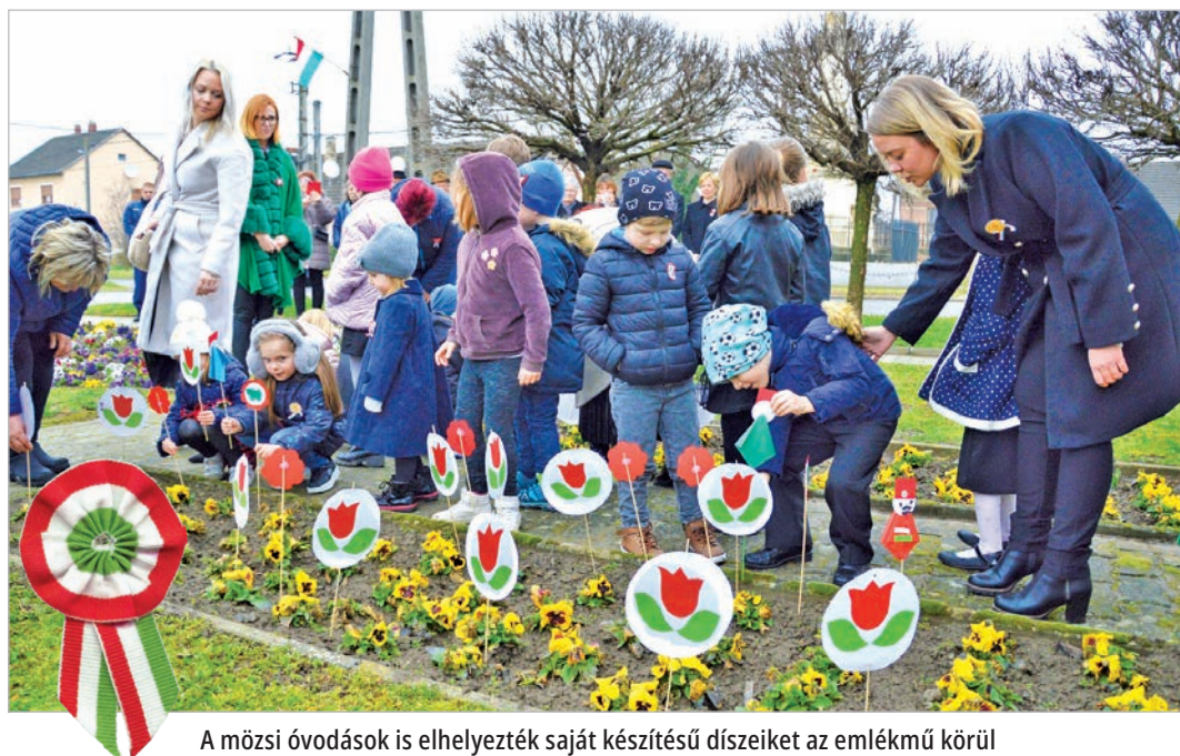
A mözsi óvodások is elhelyezték saját készítésű díseiket az emlékmű körül