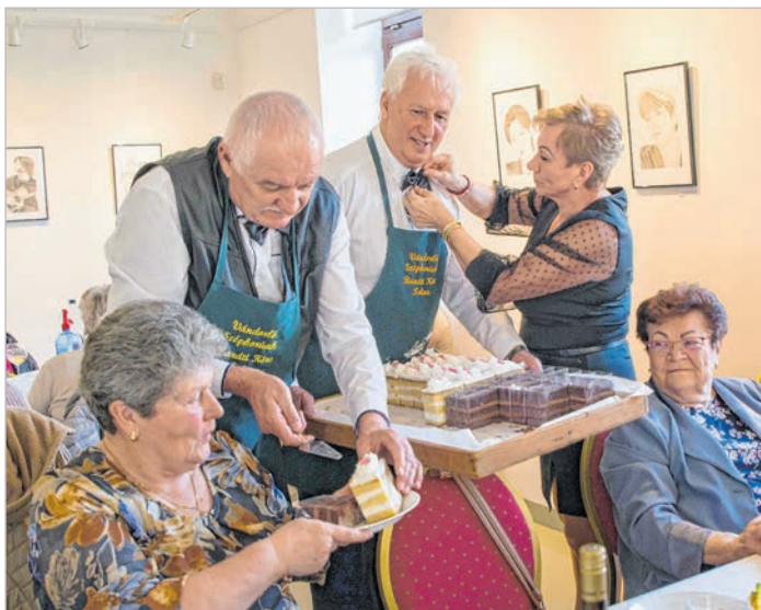
A nőkre minden helyzetben szükség van

A nőnap rendezvényen ugyanakkor a férfiakról is kiderült, hogy egy kicsit azért ők is nélkülözhetetlenek. Ugyanis ezen az alkalmon az erősebb nem képviselői lesték a hölgyek minden kívánságát, elegáns és figyelmes kiszolgálásában részesítették, finomságokkal, ajándékokkal halmozták el és táncolni is felkérték őket.