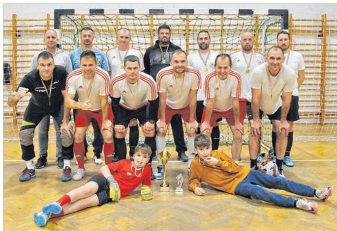
A bajnokcsapat, az Old Brothers együttese

Ebben a bajnoki szezonban 6 senior csapat lépett pályára. Ezúttal a dobogós helyekért a korábbi kiírásoknál jóval szorosabb küzdelem alakult ki. A végeredményt némileg befolyásolta, hogy – 35 év alatti játékos jogosulatlan szerepeltetése miatt – két óvás is történt, amelyek nyomán változott két mérkőzés pályán elért eredménye.