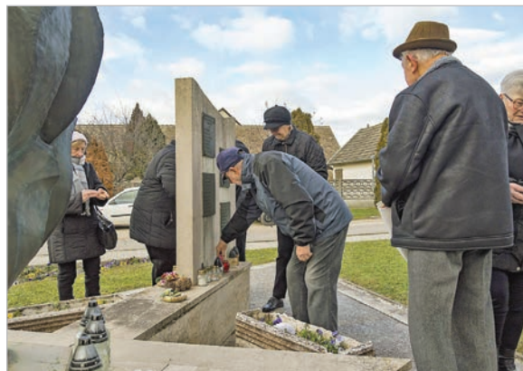
A megemlékezés végén mécses gyűjtottak a hősök tiszteletére