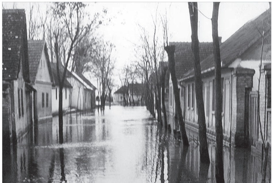
A tolnai Garay utca az 1956-os árvíz idején

Tudtad, hogy XIX. század közepéig a Duna menti Dombori út nem létezett? Nem is volt kijárat errefelé a városból, vagyis a Malom utcának nem létezett felső és alsó fele, az utca foghíj nélkül egyben volt. Aki Faddra, vagy Gerjenbe akart eljutni, annak vagy a sáros, part menti hajóvontató csapáson, vagy a tolnai Páskommon át, a későbbi lőtéri úton kellett mennie, hogy elérje a Faddi alvéget. Alatta vízjárta mocsár, nádas és ártéri erdő borította a Pálét, kisebb-nagyobb szárazulatokkal, amit