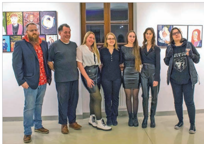
A kiállításon szereplő művek alkotói