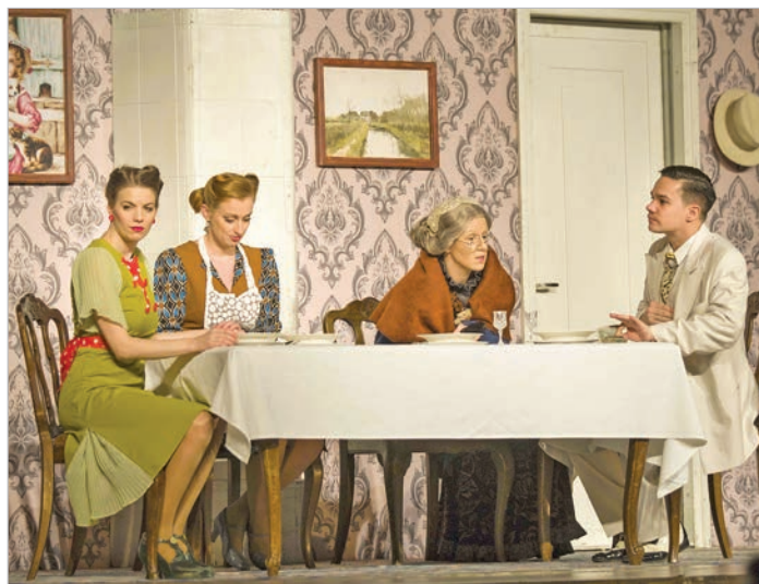
A történetben egy szerelmi szál is kibontakozik

A Hunyadi Sándor novellája alapján íródott vígjáték elsősorban a felhőtlen szórakoztatásra, vagyis a nézők megnevettetését szolgáló komikus szituációkra helyezte a hangsúlyt, azonban a humoros történet mögött olyan általános emberi értékek és magatartásformák is kirajzolód-