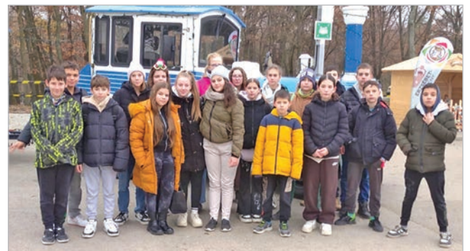
Nagy élmény volt a zánkai táborozás a széchenyis diákok számára (Beküldött fotó)

A zánkai kirándulás tartalmas, szórakoztató programnak bizonyult, ami mindössze ezer forintba került a szülőknek tanulónként.