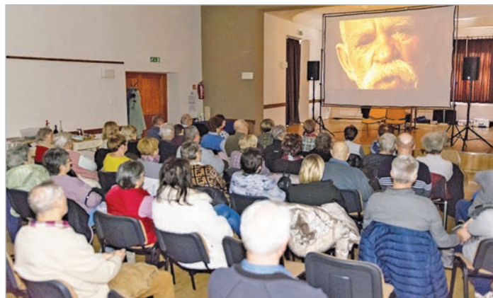
Megtelt a mőzsi kultúrház nagyterme a portréfilm bemutatójára

Számára a művészet szolgálat és igazságkeresés volt, a megszerzett ismeretek továbbadása pedig kötelesség.