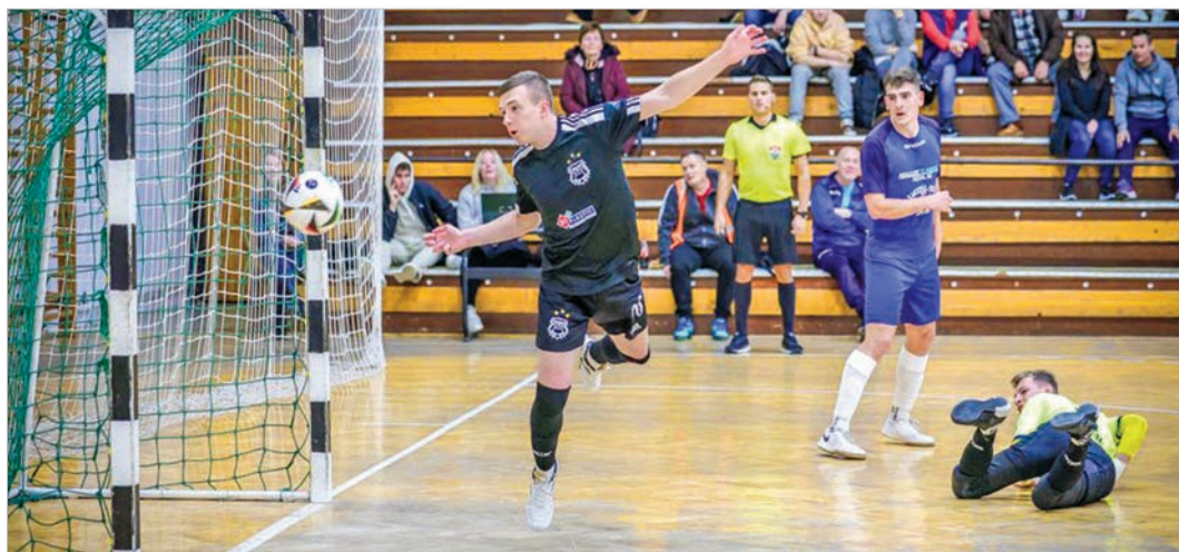
Egy gólba tartó TMFSE-labda a „Vesztett Kutyák” elleni meccsen

A TMFSE 15 forduló után a 6. helyen állt, a felsőház eléréséhez egy hellyel feljebb kellene lépnie.