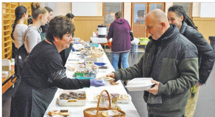
Süteményvásárlással is lehetett támogatni a családot