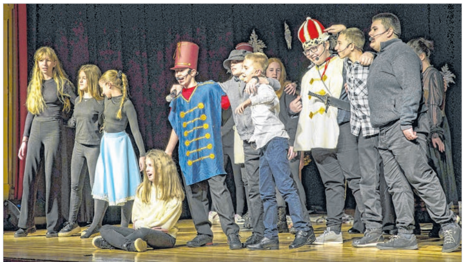
A program zárásaként a Diótörőt adták elő a diákok