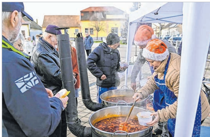
Két nagy üstben készült a bagulyás