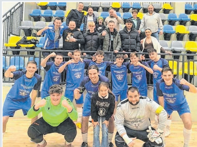
A Sárbogárd ellen nagyon ment a csapatnak

Tolna-Mözs: Merkl – Pál A., Paksi, Keszthelyi, Ágics. Cseré: Länger, Szabó G., Pál M., Gödör, Ulbert, Sásdi. Gól: Paksi (3), Pál M. (2), Ulbert, Pál A., Ágics.