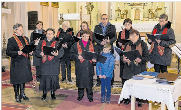
A mözsi német kórus az adventi koncerten