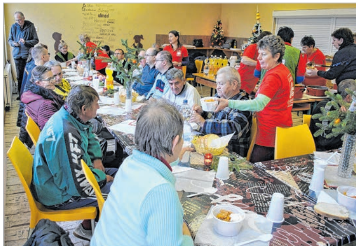
Ötven főre készítették az ebédet

meki hittel hinni, hogy ezen az estén minden jó gyerek ajándékot kap, és hogy ők is oda tartoznak. Még oda. Ahonnan nem is mindig saját akaratukból kerültek távol.