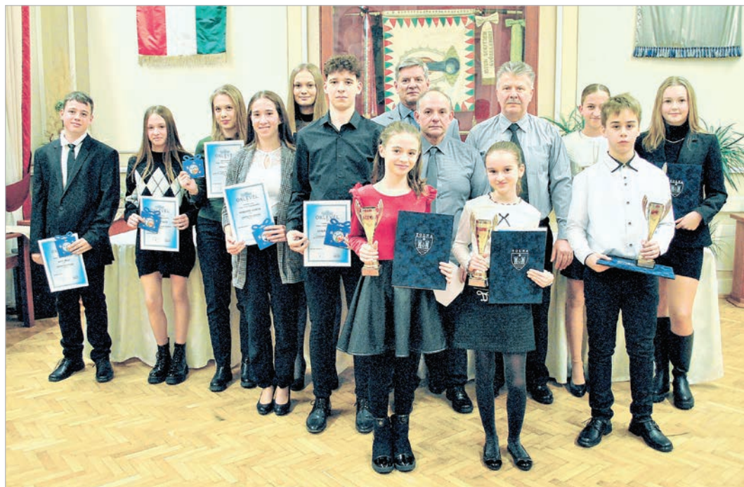
Az ünnepségen jelen levő kitüntetettek és a polgármester