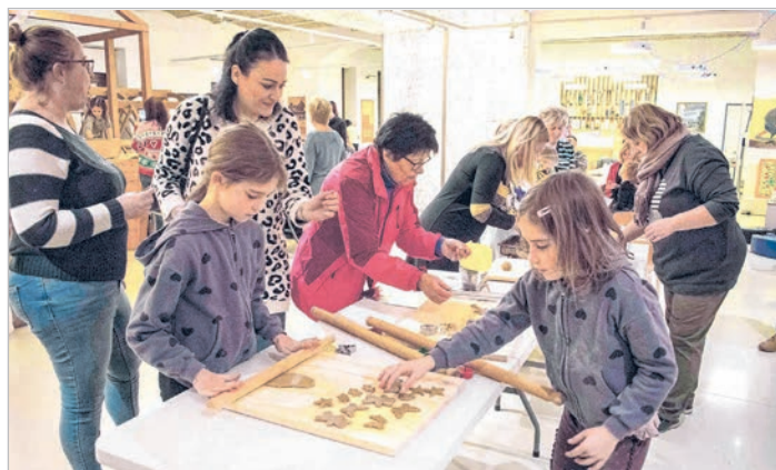
Közös mézeskalács készítés a Gabona Babonán