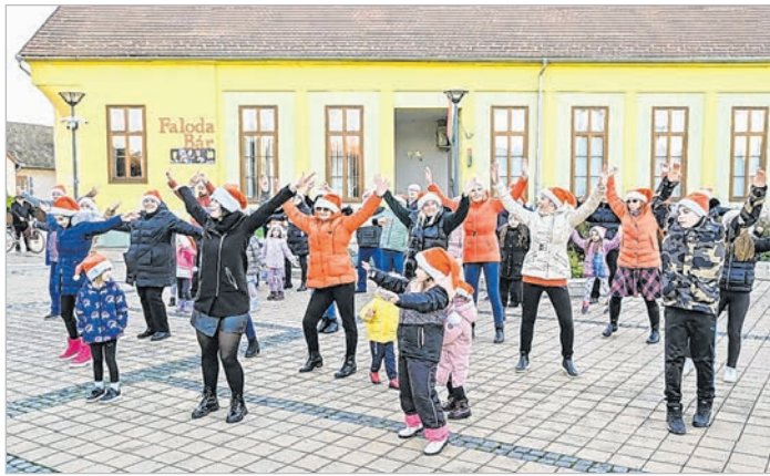
A nagycsaládok flashmobbal szórakoztatták a közönséget