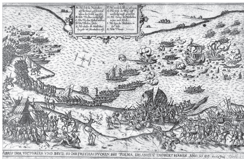
A szabad hajdúk rajtaütése Tolnánál 1599-ben

gráfiáját a dunai halászatról, amely könyvnek a 264. oldalán ez áll. „A halászlé neve és az elkészítés módja nagy vitákat szült. Nézzük előbb a nevet. Első, általunk ismert előfordulása 1800-ból van. Bredeczky Sámuel német nyelvű útleírásban elmond egy tolnai vizahalászatot, s, hogy utána a halászok meghívták ebédre. Az első fogás pontyból készült – írja –, amelyet borsos lében főztek, s amit az itt élők Halászlé-nek neveznek.” Ha tovább olvassuk a szöveget abból kiderül, hogy a borson ő akkor a tö-