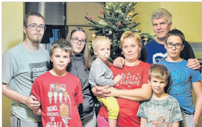
A szeretet ünnepe nem semmisült meg a lakástűzben

– A tűz december 23-án, déltájban keletkezhetett – kezdte –, aminek a kazánház lehetett a fészke, s amit a tűzoltók feltétele-