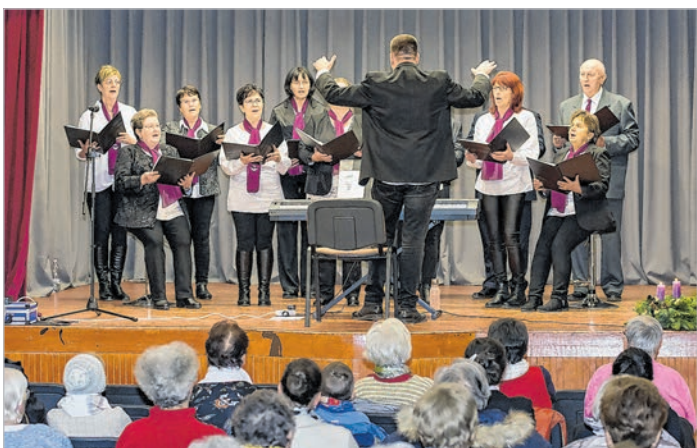
A Kajdacs Református Kórus a művelődési házban