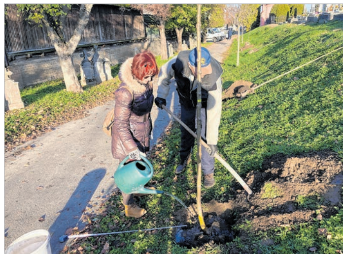
A tolnai temetőbe mintegy negyven facsemete került