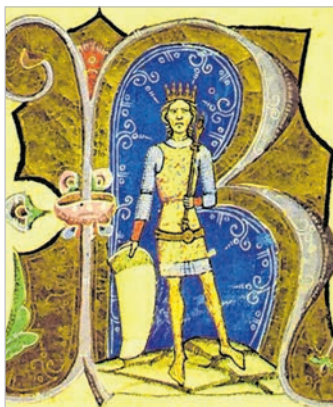
Az 1130-ban Tolnán született II. Géza ábrázolása a Képes Krónikában

Tudtad, hogy a Kárpát-medencén átfolyó Dunának a folyamszabályozásig Pakstól délre nem volt állandó medre? Hogy miért? Mert a Dunakanyarban felgyorsult folyó a síkságra érve itt lassult le annyira, hogy Tolna környékén több, kisebb-nagyobb ágra szakadt. Ez kiváló lehetőséget teremtett a folyón, mint gázlón való átkelésre. Ezt Európa-szerte tudták. Többek között itt zajlott le az alföldi marhacsordák Dél-, illetve Nyugat-Európa felé történő, folyón való áthajtása is. Innen már kézenfekvő a feltételezés, hogy már a népvándorlás népei is ismerhették és használták e helyet.