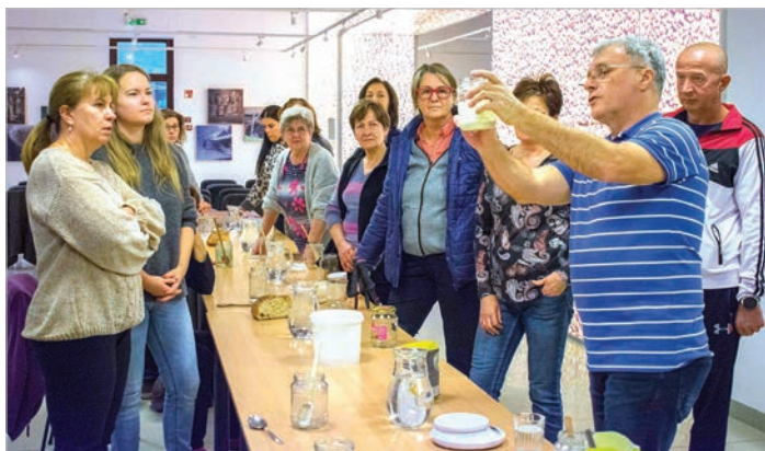
Így készül az eredeti „vadkovász”