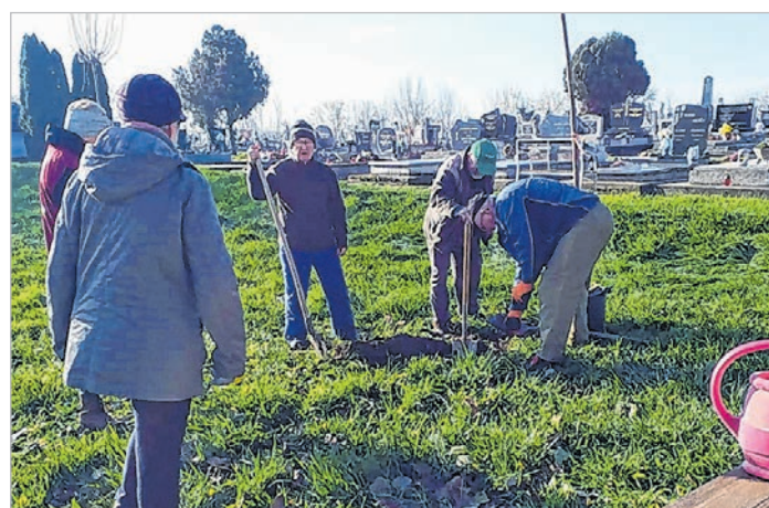
A mözsi sírkertben is ültettek fákat