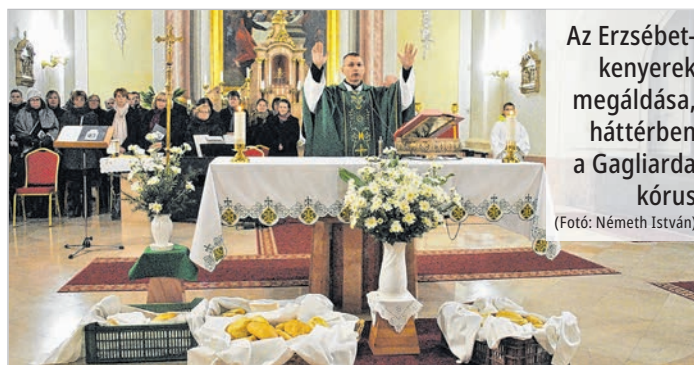
Az Erzsébetkenyerek megáldása, háttérben a Gagliarda kórus