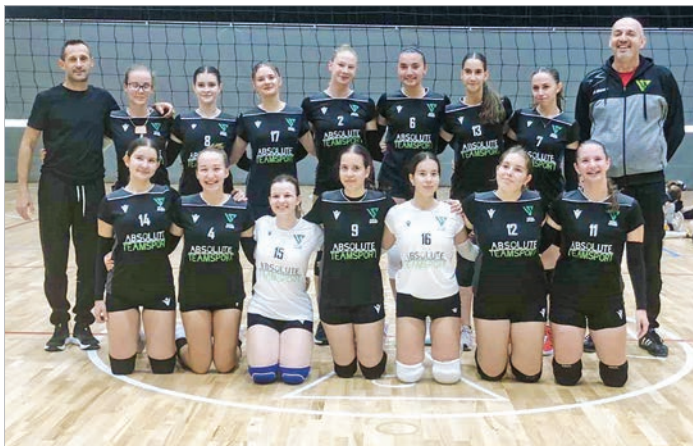
Az U17-es lány csapat és edzőik (Beküldött fotó)

A bajnokság során 15 forduló lesz, azaz minden csapat három körben játszik egymással. A meccseket péntek esténként a Városi Sportcsarnokban rendezik.