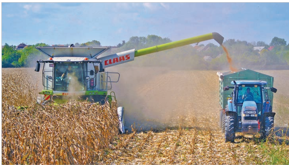
Kukoricát arató mözsi kombájn a tolnai határban

Kukoricánk kétharmadát nettó 6300 Ft/mázsa áron sikerült eladni, a többivel még várunk. A napraforgónk viszont – amiből országos túlkínálat van – csak 15 800 Ft/q ment el. Jó viszont, hogy az idén – és ilyen még nem volt – az egyik terményt sem kellett szárítani.