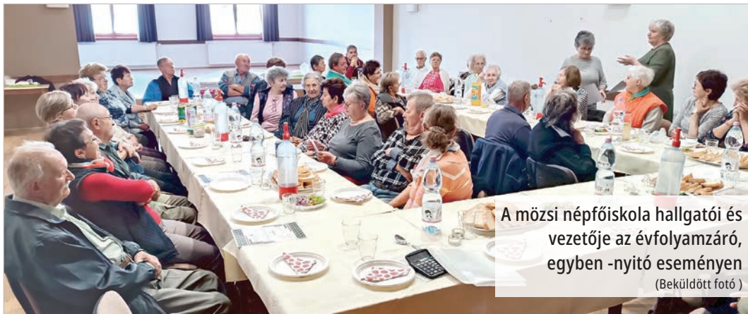
A mözsi népfőiskola hallgatói és vezetője az évfolyamzáró, egyben -nyitó eseményen (Beküldött fotó)

Ötvenhárom aktív tagja van a társaságnak