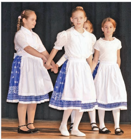
A tolnai Eötvös utcai iskola kisdíákjainak táncprodukciója

A sváb ének, tánc, gasztronómia, a német alapokra épülő művészet. Mindez megőrizendő érték. A hagyományápolást komolyan veszik e kisebbséghez tartozók,