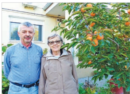
A Mecsek déli lejtőin több gazda is telepített olajfát, de már a tolnai kertekben is terem a datolyaszilva, a klímaváltozás egy újabb bizonyítékaként.

Ennél valamivel jobb a még kint lévő cukorrépánk, amit háromszor is megöntöztünk a nagy nyári aszályban, hogy egyáltalán életben tartsuk. Szerencsére ennek még használt a szeptemberre megérkezett eső és lehűlés, amivel itt még benne van egy jó közepes, 600-650 q/ha-os termés ígérete. Hogy ez mire lesz elég, az a cukor aktuális világpiacon áráról is függ.