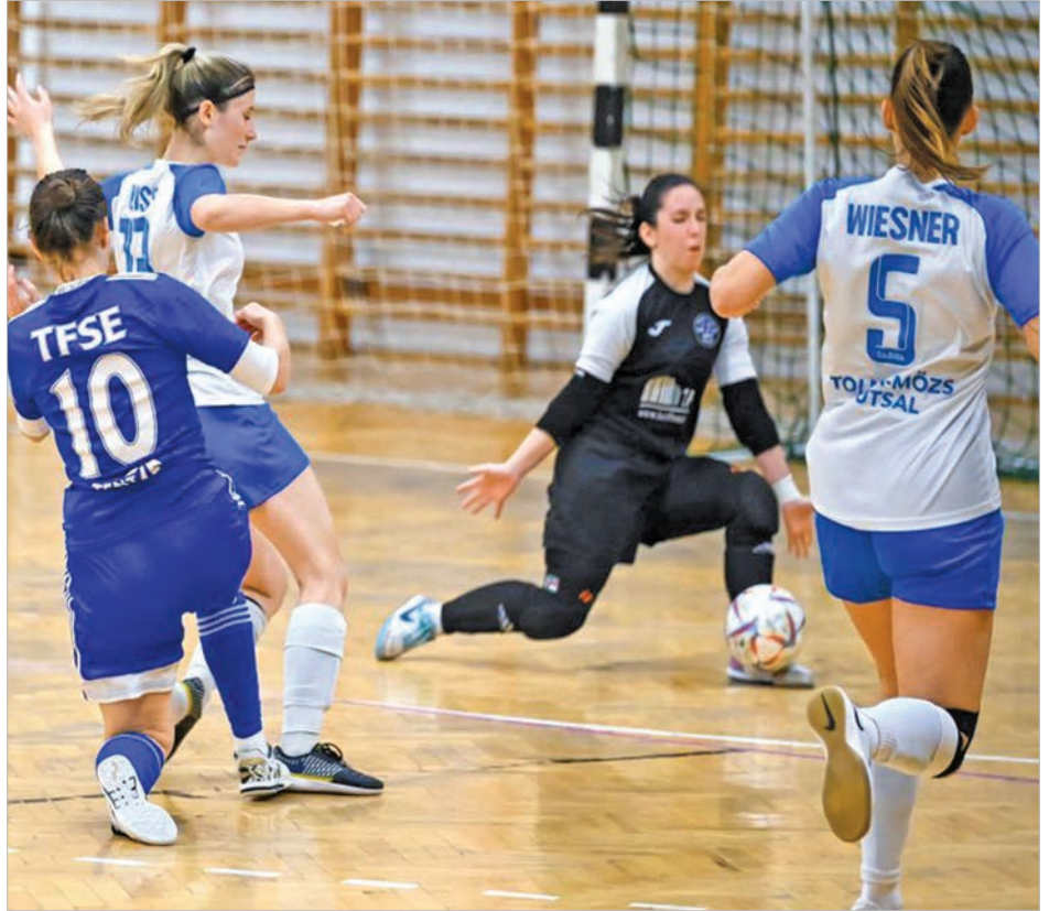
A TFSE ellen döntetlent játszott a Tolna-Mözs