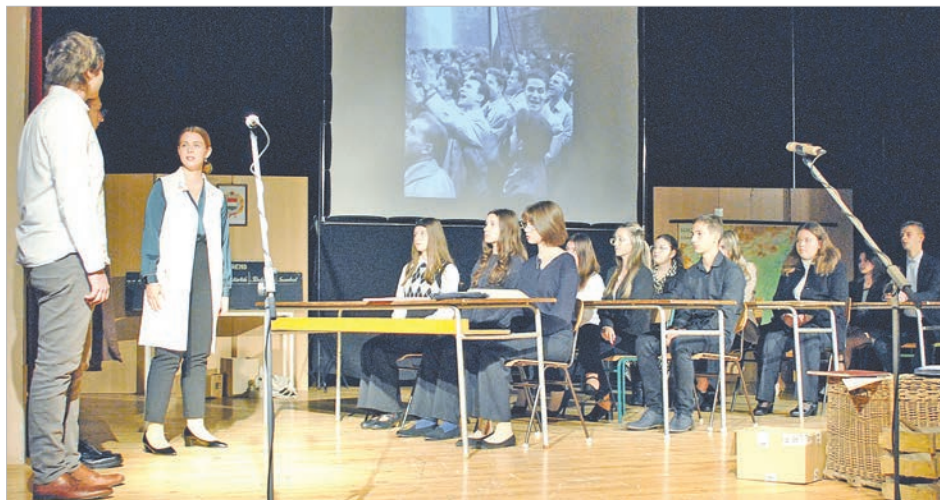
A diákok produkcióját vastappsal értékelte a közönség

Az ünnepség után a Hősök terén, az '56-os emlékműnél zajlott a koszorúzás. Az '56-os hősök előtt a települési önkormányzat, a német és a roma nemzetiségi önkormányzat, a járási hivatal, a tankerületi központ, a gimnázium, a Wosinsky Mór Óvoda, a Tolnai Rendőr-