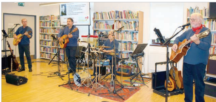
A Csobogó együttes megzenésített verseket adott elő