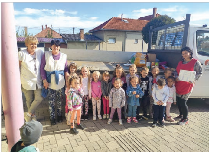
A Pitypang csoport is gyűjtött adományokat a gazdtalan ebek részére

Kutyamenhelyeknek is gyűjtöttek a Pitypang Óvodában