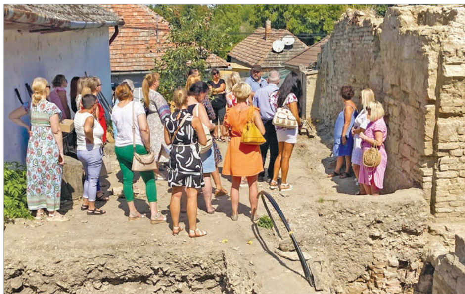
Szeptemberben a városháza dolgozói is megnézték a törökfürdő romjait

Statikus szakember is járt már a helyszínen, a romok vízelvezetésével és a fagymentesítéssel kapcsolatban. Az biztos, hogy a meglévő falakat téliesíteni kell, egyes feltárt részeket átmenetileg be kell temetni, amíg el nem dől a törökfürdő sorsa. Ha nem sikerül megoldást találni a hasznosításra, akkor teljesen vissza kell majd temetni a feltárt romokat, a megmaradt felmenő falak hosszú távú megőrzése érdekében.