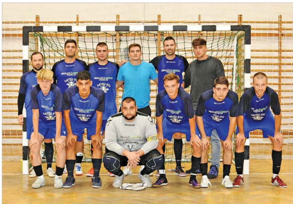
Első hazai meccsén megszerezte első pontját a TMFSE