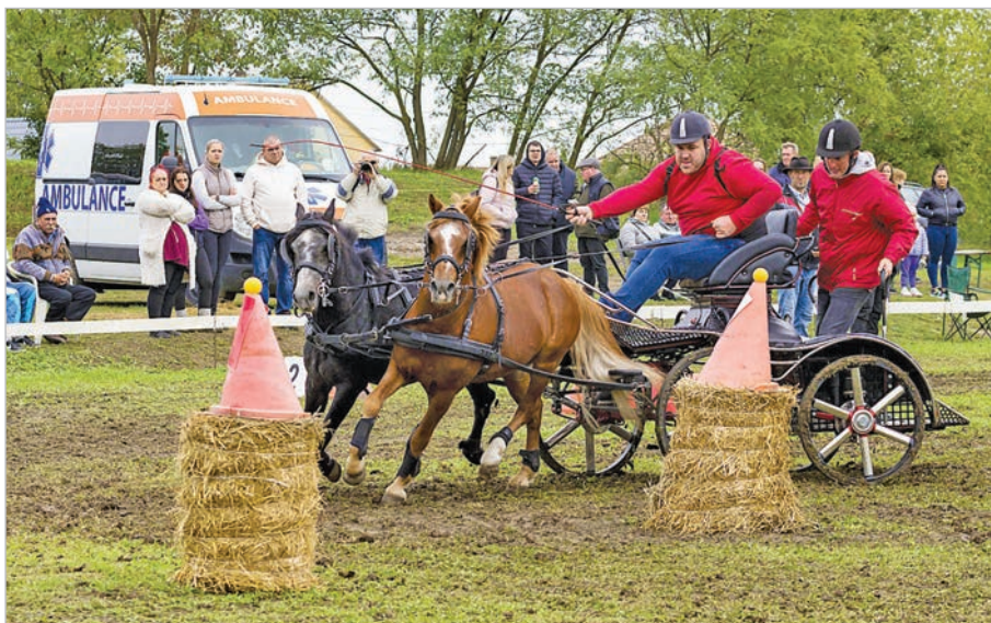
Remek versenyt rendezett a Tolna-Mőzsi Lovas Egyesület