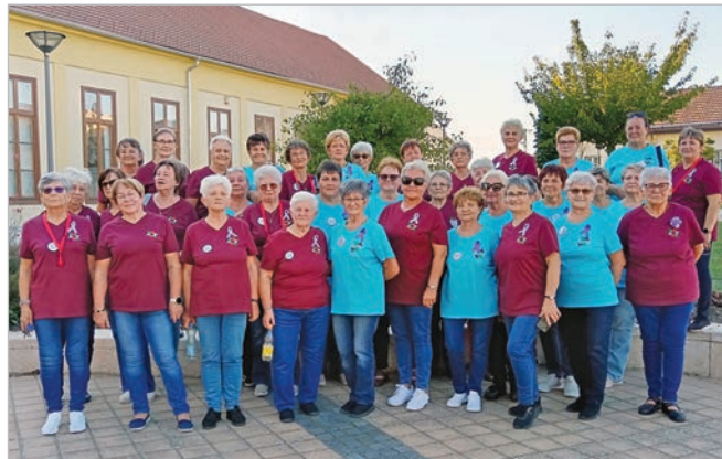
A tolnai és a faddi örömtáncosok a Hősök terén

Megemlékezés az Alzheimer világnap alkalmából