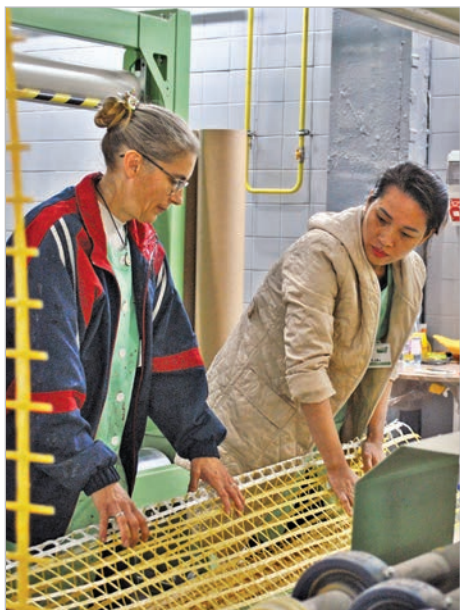
Vietnámi dolgozónak mutatja be a munkafolyamatot magyar kollégája a Tolnatext Bt. üzemében