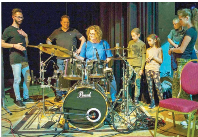
A koncert végén a közönség is megszólaltathatta a hangszereket

A rendezvény a Petőfi Kulturális Program a Kulturális és Innovációs Minisztérium támogatásával, a Nemzeti Művelődési Intézet és a Petőfi Kulturális Ügynökség szervezésében valósult meg. Józsa