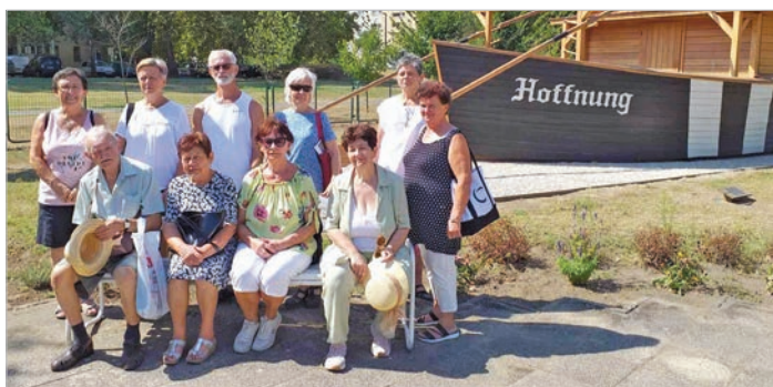
A mözsi csapat a bajai „ulmi dereglyénél” (Beküldött fotó)

Hét gyermeke közül Éber Anna (1905–2002) az országos Képzőművészeti Akadémián Rudnay Gyula kurzusait hallgatta, ösztöndíjjal Firenzében,