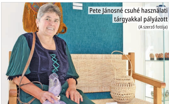
Pete Jánosné csuhé használati tárgyakkal pályázott

Nívós volt az anyag: a beküldött, mintegy 160 pályaműből a kilenc tagú szakmai zsűri több