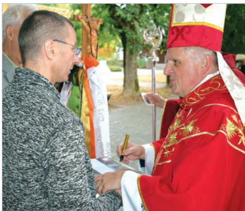
Aláírta a nuncius a tolnaiak emlékszalagját

A misét követően a hívek személyesen is találkozhattak a nunciussal. Sokan kértek tőle áldást és dedikációt. A Vándorló Szépkorúak Baráti