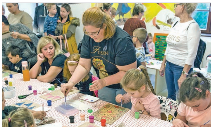
A kreatív műhely foglalkozása is a mesékhez kapcsolódott

érését mutatta be a népmesékre jellemző tanulságos módon. A kicsik nagy örömeire több zenei betét is kiegészítette az előadást,