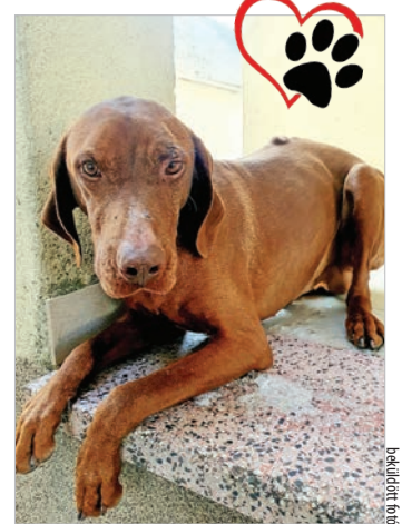
Füles kutya a szilveszteri tűzijátékoktól rémült halálra

És a fenti barátunk? Ő kitette a kutya elé az elakadásjelzőt, hogy hátulról, az ő kivilágított autójával biztosítsa a helyszínt. Majd megnyugtatva a már mindenre elszánt vicsorgó ebet, addig simogatta – ez negyedórát jelentett – míg az országút szélére vihette. Ezután ment be a felesége a nagyobb autójukért – ebbe ugyanis nem fért bele –, hogy még ezen az éjszakán eljussonak egy állatmentő angyal chip leolvasójához, majd ezáltal a gazdihoz, végül az állatorvoshoz. Fél éjszaka, úgy, hogy százak mentek el mellettük, anélkül, hogy megkérdezték volna, miért jó nekik itt ácsorogni az éjszakában. Miközben az óévet búcsúztatva, égen-földön folyt a tánc, hogy előtte, utána és közben emberek milliói ölelgessék egymást, békés, boldog, egész-