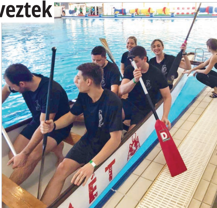
Kemény küzdelmek után, vidám hangulatban

Az egyesület több mint tíz éves pályafutása során az utánpótlás Európa- és világbajnok versenyzőik mellé folyamatosan igyekszik új tagokat bevonni. Mindenkit szívesen várnak, akik kipróbálnák a sárkányhajózást a Fadd-dombori holtágon, és örömmel vennének részt versenyeken is.