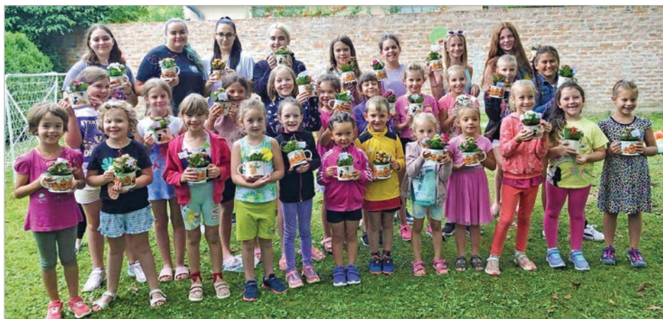
A nyári kézilabdás edzőtábor résztvevői

A tavaszi programok között szerepel még a húsvéti csarnok-piknik, újdonságként pedig a szezon végi egész napos sportágválasztó toborzó, amit június 8-án tartanak.