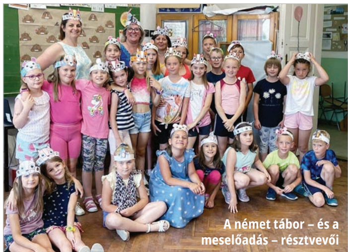
A német tábor – és a meselődés – résztvevői