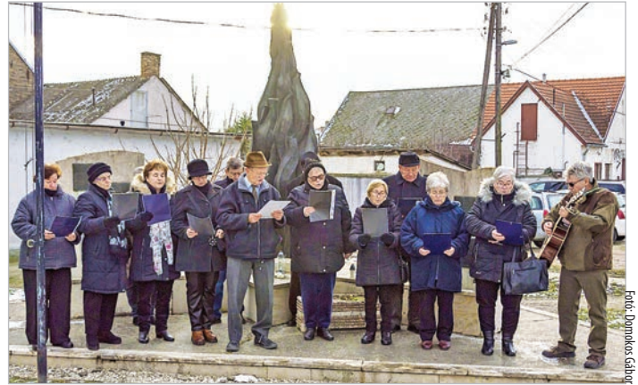
A Mőzsi Nyugdíjas Klub tagjai is közreműködtek a megemlékezésen

Az emlékezők, köztük az áldozatok leszármazottai, mécsset gyújtottak a világháborúban elesett mözsi katonák tiszteletére. Ezután elmondták a Miatyánkot, és néma főhajtással tisztelegtek a hősök előtt. K. E.