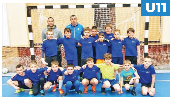
Az U11-es csoportból két csapat indult a futsal bajnokságban