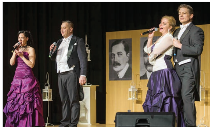
Színvonalas műsort adott elő az Operett Voices