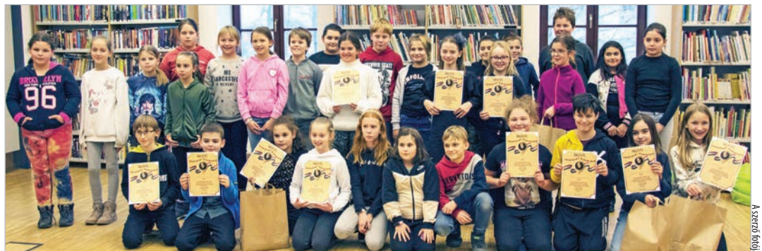
A vetélkedő résztvevői a gyermekkönyvtárban