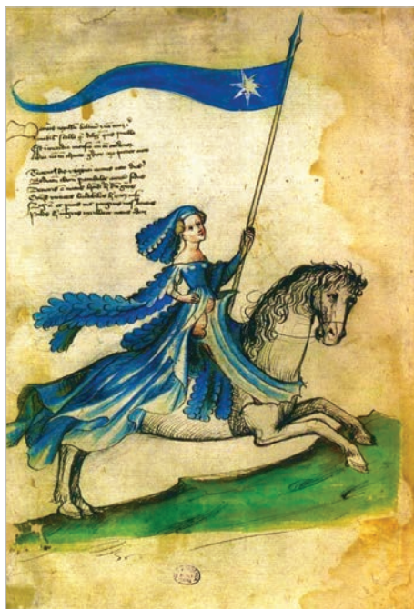
Cillei Borbála királyné sem tudta megfékezni a tolnaiakat