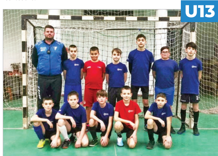
Az U13-as csapat a 3. helyről várja a bajnoki folytatást

Az U13-as gárda keretét 14 játékos alkotja, edzőjük Izsák Géza. A csapat számára szeptemberben kezdődött a bajnoki szezon, heti 2 edzéssel és egy bajnoki meccsel. A füves pályás bajnokságban a harmadik helyről várják a tavaszi folytatást. A futsal bajnokságban való részvételük kiváló lehetőség a technikai képességek fejlesztésére.