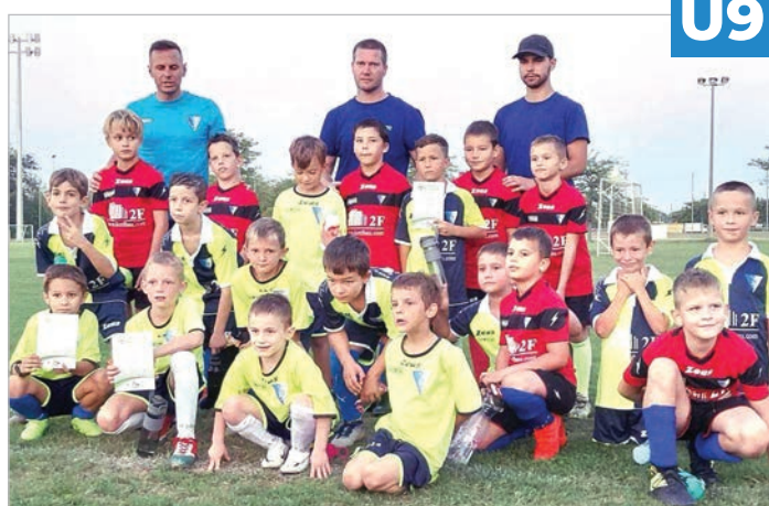
Az U9-es korosztály a legnépesebb csoport

Az U9-es és az U11-es gárda a Bozsik program meccsein kívül a korosztályos megyei futsalbajnokságban is játszik.