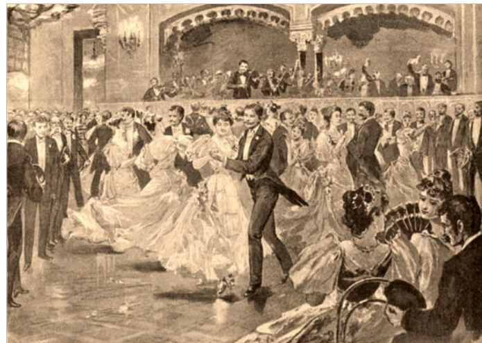
Tolnai báli illusztráció híján egy korabeli kép a pesti Vigadó 1896-os atléta báljáról