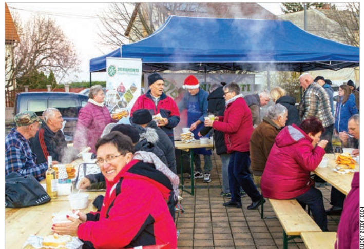
Az ételek és italok mellett a vidám baráti hangulat is melegítette a résztvevőket