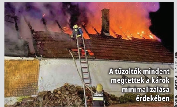
A tűzoltók mindent megtettek a károk minimalizálása érdekében

A ház földemje is beszakadt, az épület lakhatatlanná vált. Információnk szerint a két megmenekült lakó egy másik albérletbe költözött. Egyes sajtóhírekkel ellentétben a szomszédos panzió épületére nem terjedt át a tűz.