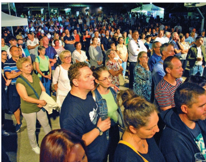
A Csík Zenekarra is rengetegen voltak kíváncsiak

Rengetegen voltak a Bárkán, de nem sülyedt el – egy mondatban így is összefoglalható az idei Bárka Fesztivál, amit ezúttal augusztus helyett későbbi időpontban, szeptember 8-9-én rendezett meg a Tolnai Kulturális Központ. Ám ez semmiféle problémát nem okozott, sőt. Az Alta Ripa Szabadidőpark megtelt élettel, és bár többször is rengeteg ember volt egyszerre jelen, a nagy forgalom ellenére nem alakult ki zavaró zsúfoltság. Közben pedig a kiegészítő programok és az éhes-szomjas közönség kiszolgálása is jól működött.