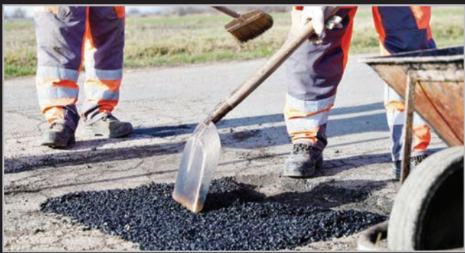
Ezeregyszáz négyzetméternyi úthibát javítanak ki