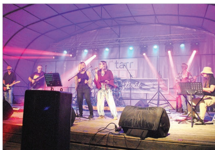
A Walking Mama koncertje zárta a fesztivált