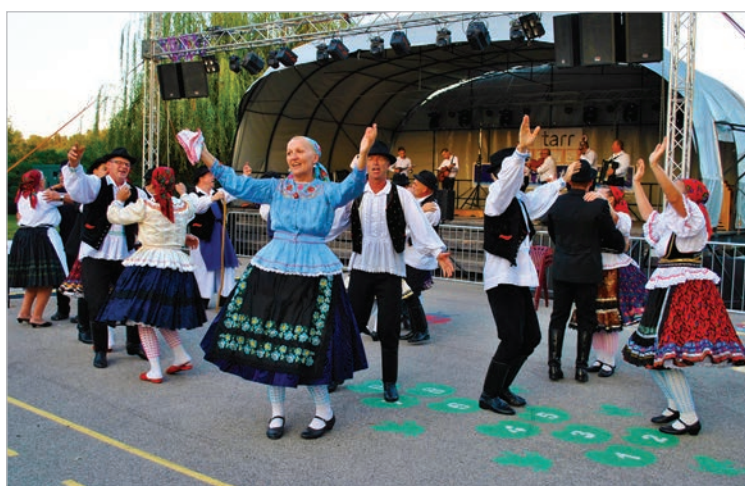
Bogyzslói táncosok és zenészek műsora nyitotta a Bárkát