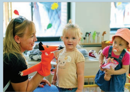
Jelenleg hét kisedek jár a csoportba, decemberben lesz teltház