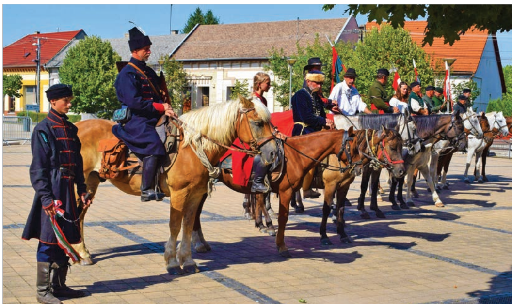
A lovas hagyományőrök Tolna főterére érkeztek

A 18 lovas többsége a Rády József Huszárbandérium és a Vértes Egyesület tagjai közül érkezett, de voltak egyénileg csatlakozók is. Körülbelül tízen végig teljesítették a 180 kilométeres távot, mások csak rövidebb szakaszokat tettek meg. Tolnáról Szekszárdra indultak, ahol az éjszakát töltötték. Mohácson, a csatavesztés napján augusztus 29-én tartott megemlékezésen vettek részt. A tervek szerint ezt az utat még háromszor, az ötszázadik évfordulóig (2026) járják végig a lovasok.