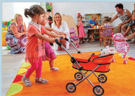
Az új bölcsőde nagyon jó körülményeket biztosít a kicsiknek