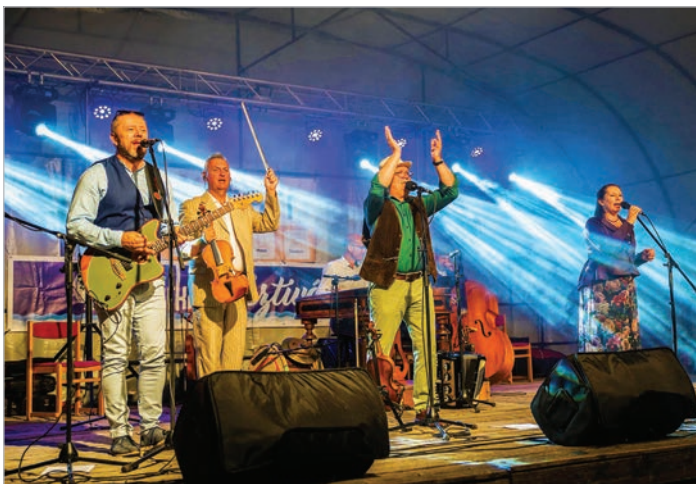
A Csík Zenekar nem okozott csalódást a közönségnek