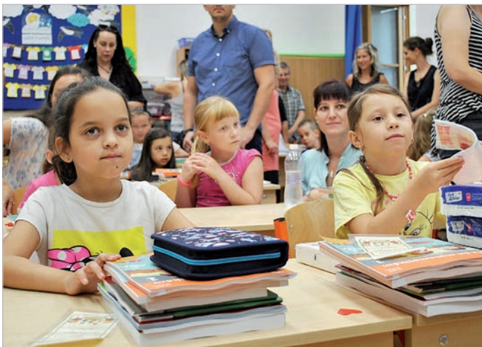
Az Eötvös utcai iskola két első osztályában összesen 61 kisdíák kezdett

A „státusztörvény” alapján a pedagógusoknak szeptemberben kell dönteniük arról, hogy a megszűnő közalkalmazotti státusz helyett elfogadják-e az új köznevelési foglalkoztatotti jogviszonyt, amely jövő év január elsején lép életbe. Szeptember 15-ig mindenki személyre szóló tájékoztatást kap a változásokról. Aki elfogadja, annak nincs teendője, ellenkező esetben szeptember 29-ig nyilatkoznia kell, és a munkáltató november 30-án felmenti a munkavégzés alól. Az még nem látható előre, hogy az új törvénynek mi lesz a hatása a tolnai intézményekben, de mindhárom vezető azt reméli, nem lesznek negatív változások.