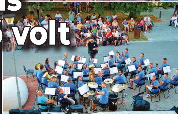
A Felsőtárkányi Fúvószenekar a Tolnai Hírlap fotósának integet

A zene most is számos műfajban szól: volt induló, operett-részlet, filmzene, diszkó, pop és jazz is, amelyekben a közös pontot a (zömmel) fúvós hangszerek jelentették.