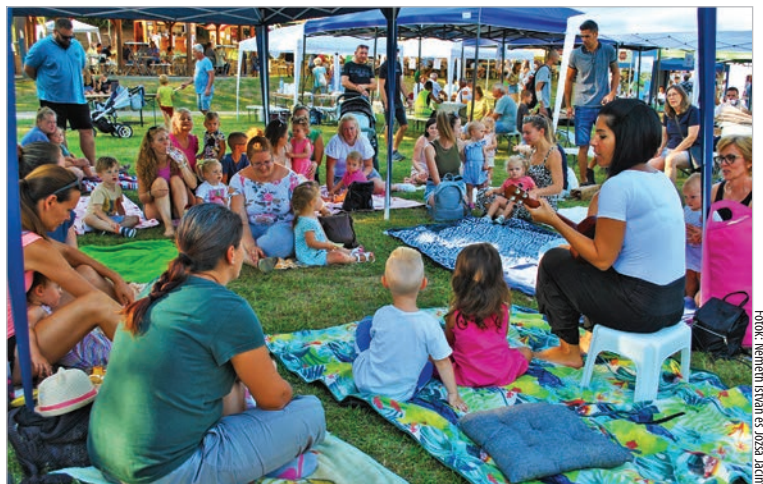
Szombat délutáni Csacska Macska babafoglalkozás