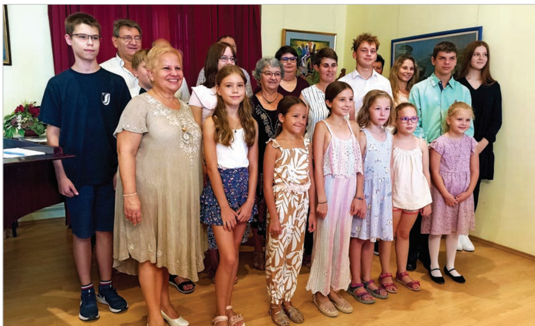
Az idei mesterkurzus résztvevői

A hétfőtől péntekig tartó mesterkurzus során valamennyi diák mindkét mestertől vehetett órákat, napi beosztás alapján. Pénteken zárókoncertet rendeztek, amelyen a hét során összeállt darabokat adhatták elő a növendékek.