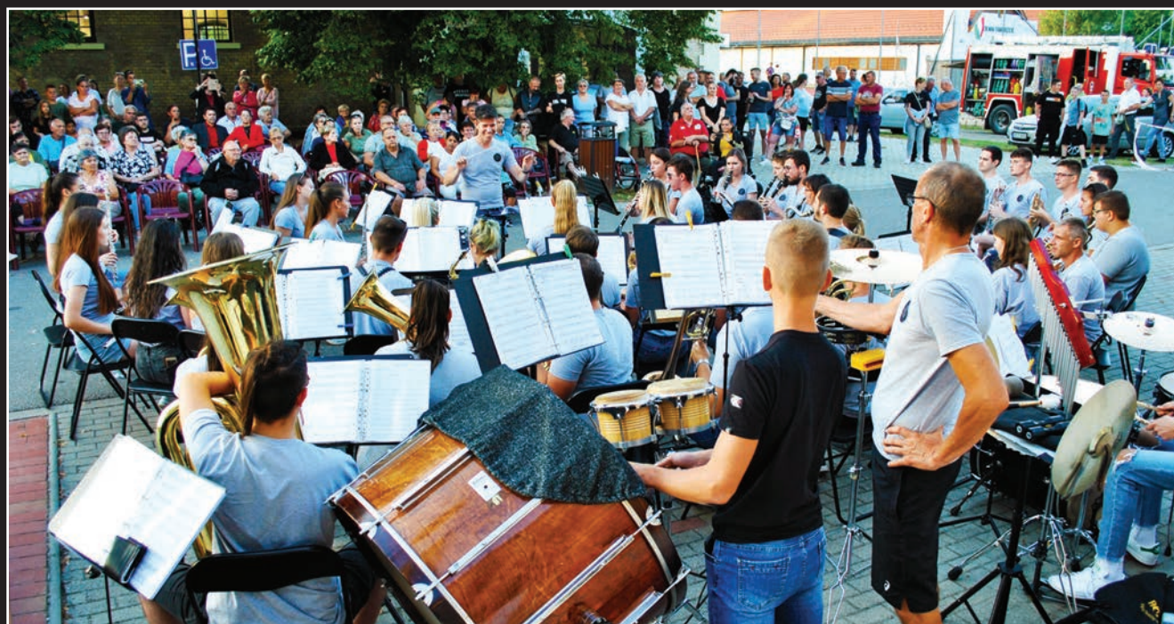
A házigazda Tolnai Ifjúsági Fúvószenekar is fellépett

Vasárnap a „helyi erők” léptek fel. (Mindhárom zenekarban voltak tolnai zenészek.) Ezen a délutánon-estén a Szekszárdi Junior Stars Big Band, a Tolnai Ifjúsági Fúvószenekar, végül a szekszárdi-tolnai HuMen csinálta a fesztivált, a valamennyi korosztályt képviselő, igen jókedvű, népes közönség legnagyobb örömére.