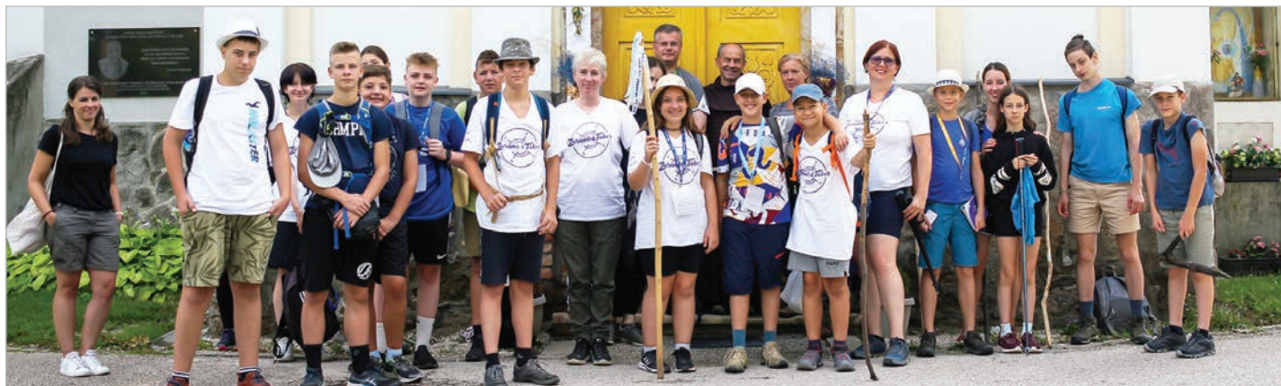
A zarándokok a pilisszentléleki templomnál