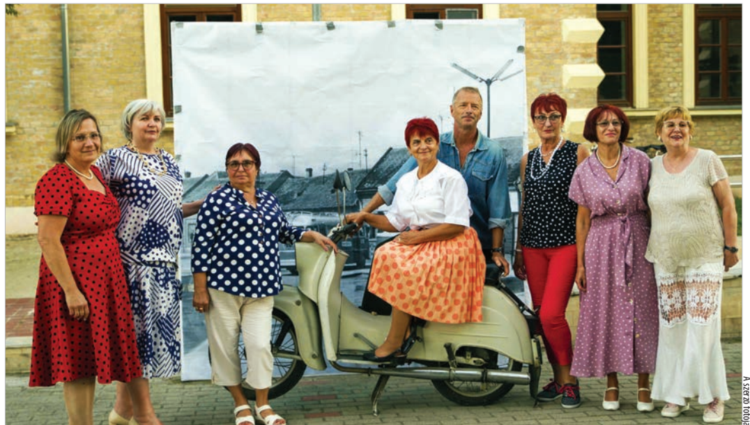
„Talpig retróban” a fotófal előtt