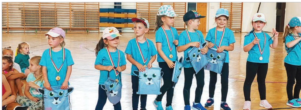
Külön óvodás csoportot is indított a klub