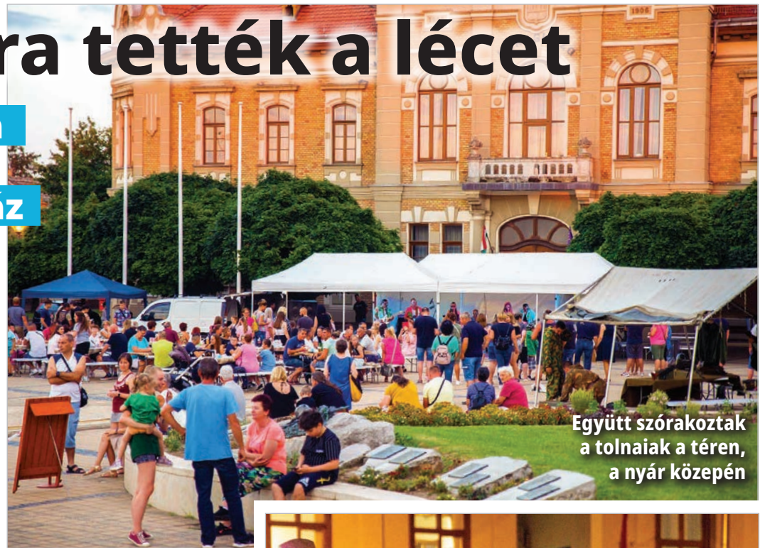
Együtt szórakoztak a tolnaiak a téren, a nyár közepén

Ugyancsak jelentős tömeg vette körül a hasonló célból érkező rendőrautót és a har-