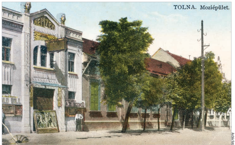
A Deák Ferenc utcai mozi, már Nemzetiként, 1927 után

A II. világháború után a szecessziós homlokzatú épület nem igazán esztétikus fémburkolatot kapott kívülről. A mozinak – már a szocialista időszakban – voltak a rendőrségnek és a tűzoltóságnek külön fenntartott helyei. Persze ekkor már állami tulajdon volt a film-