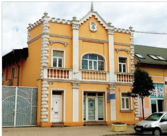
Az egykori mozi ma lakóépületként szolgál

nélkül játszott a filmek alatt. Később bejött a hangosfilm, ehhez pedig kicsit át kellett alakítani a berendezéseket. A mozi egyébként, bár kissé giccsesen nézett ki,