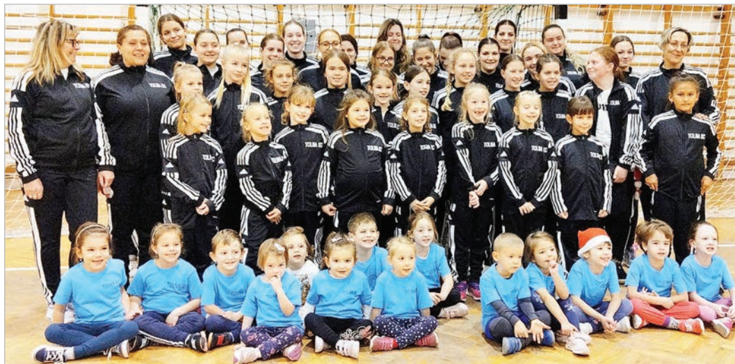
A Tolna KC edzői és sportolói majdnem teljes létszámban

lányok mellett már az 1-4. osztályos fiúkat is szeretettel várják. De nem csak őket, hanem minden sportolni, kézilabdázni vágyó felnőttet, gyereket is, aki szeretné kipróbálni magát és egy vidám, jó csapat tagja lenni.