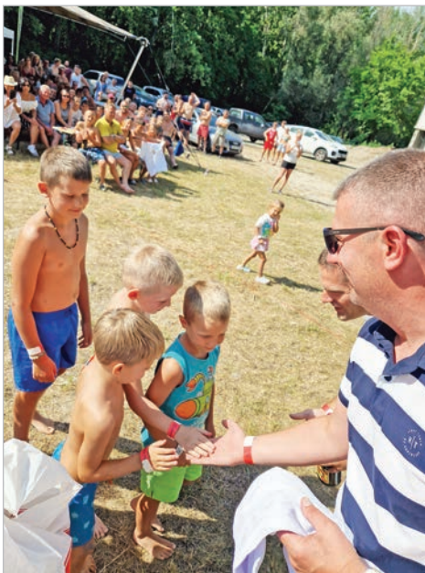
Utánpótlásból idén sem volt hiány

– Amíg Tolnán éltünk, akár a Kossuth, akár a Festetich utcát nézem, soha nem laktunk 200 méternél messzebb a Dunától. Az étletterem volt. Amibe nem csak az úzás, evezés, horgászás fért bele, de a halászlé szeretete is. Nálunk, mivel apukám nem tolnai származású, anyánk főzte a halat. Hogy én mikor álltam neki először, önállóan? Nos, amíg itthon voltunk, erre nem volt szükség. De amikor eljött az első karácsonyeste