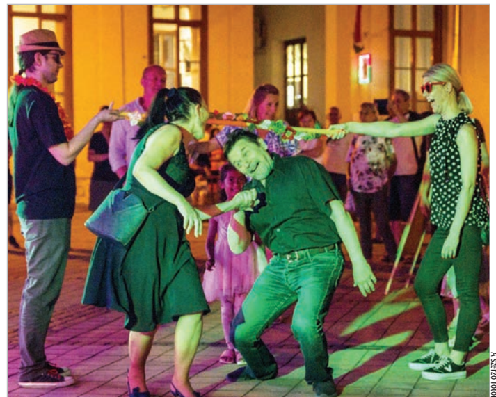
A limbóléc is előkerült a múltidézés csúcspontján

Az ismeretszerzés mellett a játékokból sem szenvedtek hiányt a kicsik, köszönhetően a Társasjáték Vár Egyesület standjának.