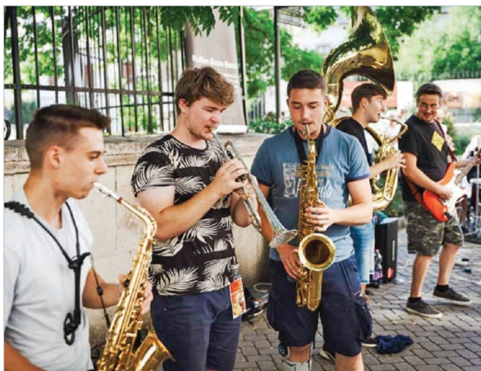
A zenekar néhány tagja Egerben, az Utcazenészek Versenyén