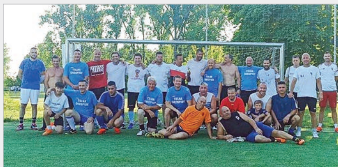
Az emlékecs résztvevői a tolnai focipályán

A mérkőzés után fehér asztal mellett elevenítették fel a régi szép időket az egykori játékosok és a szurkolók.