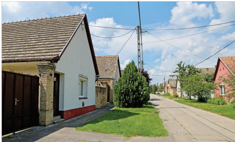
A Széchenyi utca is az egykori Viszlóvároshoz tartozik, több ház ma is őrzi eredeti építési jellegzetességeit

Ebből is látszik, hogy ezeket az utcákat gyorsan belakták az iparosok is, mivel itt is szükség volt pékre, asztalosra, kötélgyártó-