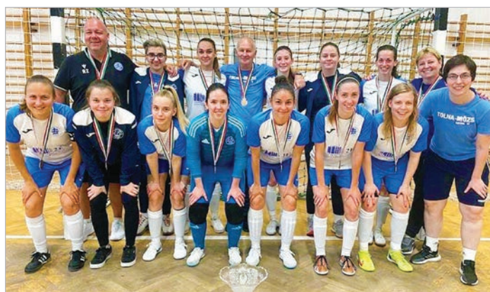
A 2F-Bau bajnoki bronzérmes nyert csapata

Nem sokon múlt, hogy a bajnokság rájátszásában az aranyéremért játszhasson a 2F-Bau Tolna-Mözs csapata. A Debrecen azonban valamivel jobbnak bizonyult az elődöntőben, így a Tolna-Mözs – akárcsak tavaly – a harmadik helyért játszhatott, mégpedig a Budaörrrel. Azzal a csapattal, amelyet a Magyar Kupa elődöntőjében sikerült legyőzniük.