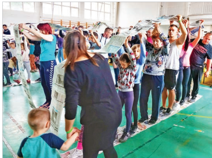
Egy játékos feladat a sok közül

Délutánra a Nap is előbújt, így önfelelt kacagás kísérhette a tolnai tűzoltók által biztosított habpartyt. Késő délután élményekkel telve indultak haza a családok. Természetesen szemetet összeszedve, padlót felsöpörve, elpakolva, ahogy azt illik, és ahogy azt a gyerekeknek is továbbadni szeretnénk.