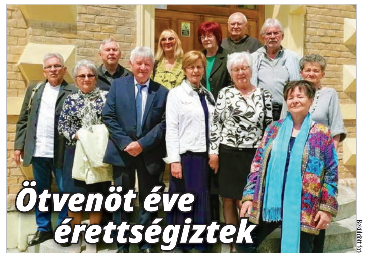
Ötvenöt éve érettségiztek