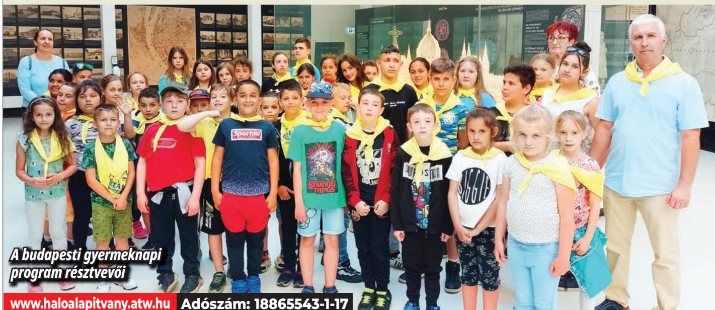
A budapesti gyermeknapi program résztvevői

A Tolnai Háló Közalapítvány és a Családsegítő Központ május 25-én 42 gyermekkel részt vett a Baptista Szeretetszolgálat által szervezett gyermeknapi rendezvényen. A gyerekek a Fővárosi Nagycirkuszban színvonalas előadást láthattak a Sztyeppe illata címmel, ahol az élményen túl ajándécsomagot és pizzát kaptak ajándékba. A nap második felét az Országházban töltöttük. A kiránduláshoz az autóbust az MVM Paksi Atomerőmű Zrt. biztosította térítésmentesen.