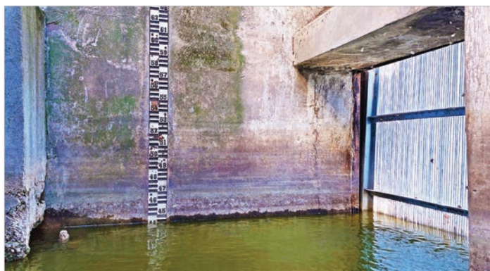
A Mádi-Kovács-zsilip vízmércéje

gének vezetője elmondta, hogy idén a korábbi éveknél kedvezőbb, a tavaly májusban mértnél mintegy 20 centivel magasabb volt a holtág kezdő vízszintje.