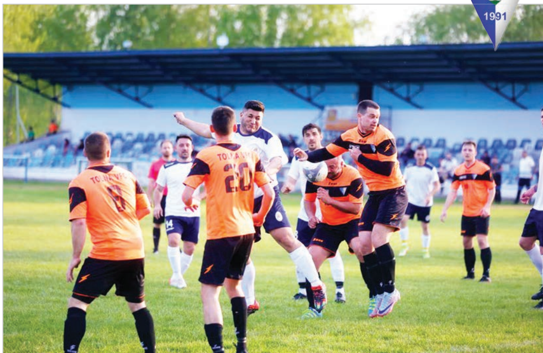
A Mórág elleni hazai győzelem után még megvolt az esély a dobogóra