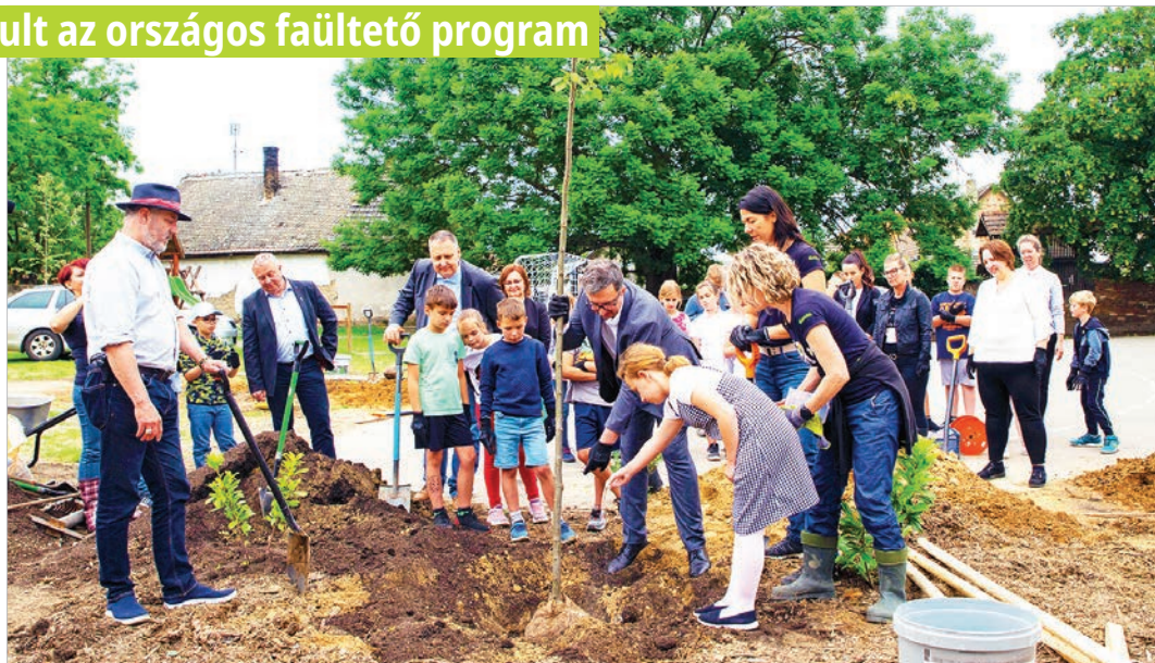
A gyerekek is közreműködtek a faültetésnél

A klímaváltozás elleni küzdelem egyik eszköze a faültetés. A fák, cserjék a levegő szén-dioxidjának megkötése és az oxigéntermelés mellett árnyékot nyújtanak, javítják a levegő minőségét, elvezetik a csapadékot, védik a talajt, megfogják a port és számos állatnak biztosítanak élőhelyet. Mindezen jótékony hatások