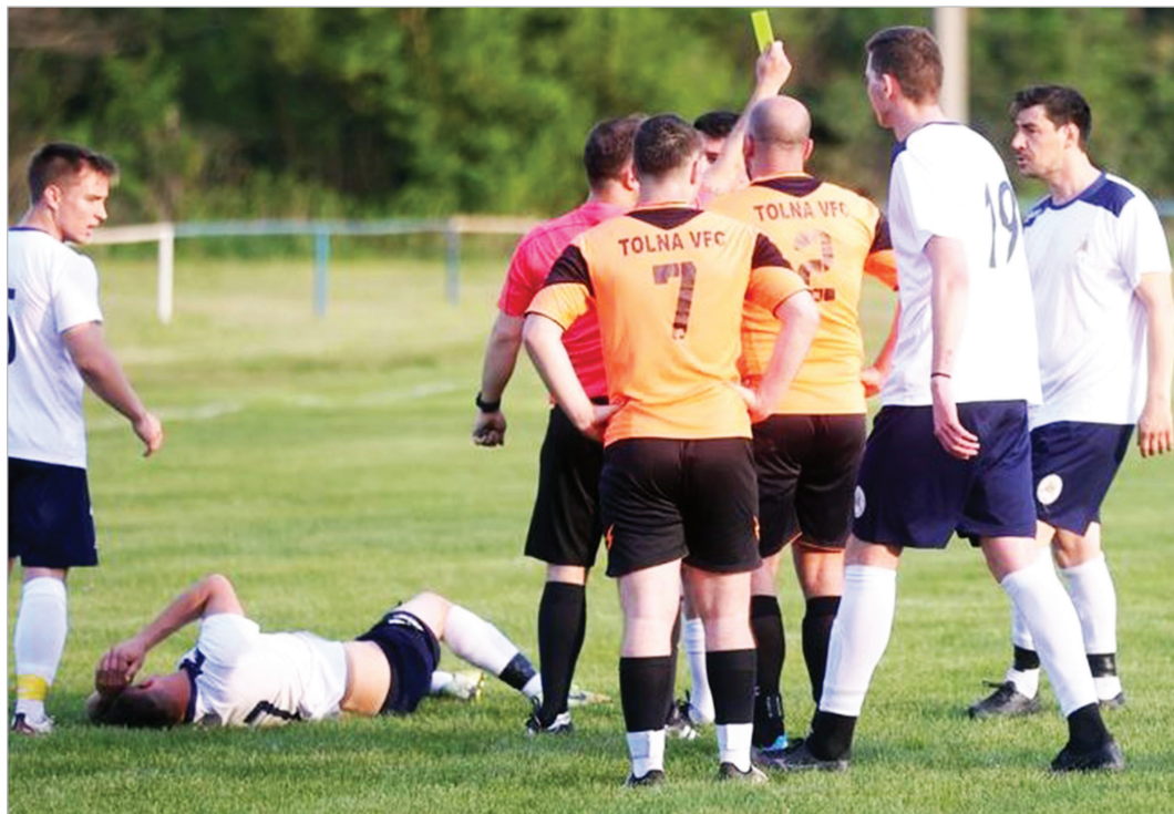
Egy sárga lap a nyolc közül a Tolna–Mórággyi meccsen