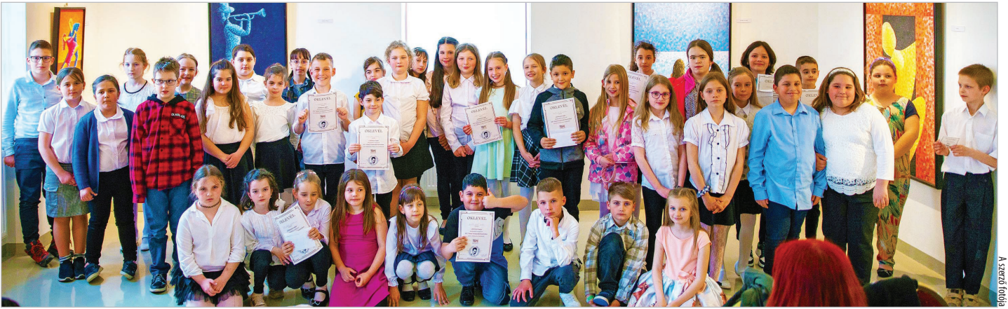
Közel ötven diák állt a zsűri és a közönség elé a tizennegyedik versmondó fesztiválon