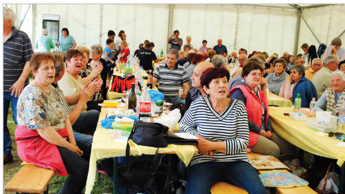
Remek volt a hangulat május elsején Murgán

Az esemény nagyszabású lángossütéssel indult. Délelőtt hat állomásos játékos akadályversenyen vettek részt a vállalkozó kedvű csapatok, de volt