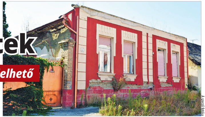
Egy jobb napokat is látott polgári ház a Rákóczi utcában, Tolnában

Fontos az empátia, de bontás is elrendelhető