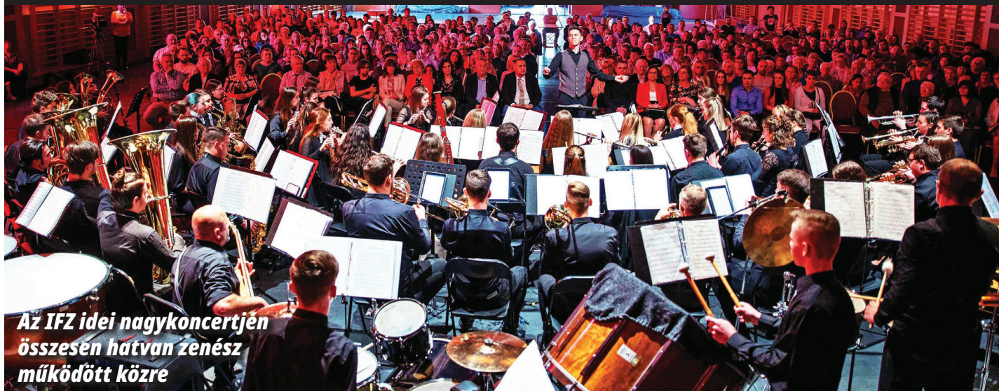
Az IFZ idei nagykoncertjén összesen hatvan zenész működött közre