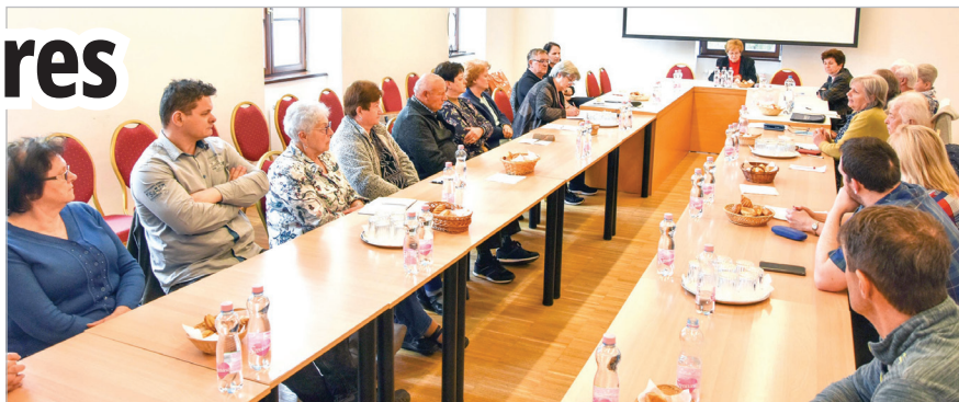
A rendezvényen tizenkilenc szervezet képviseltette magát

Idén is találkoztak a társadalmi szervezetek képviselői