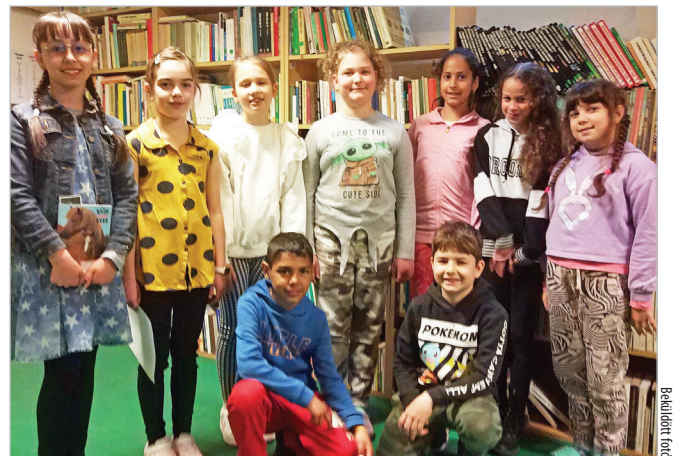
A Wosinsky iskola versmondói