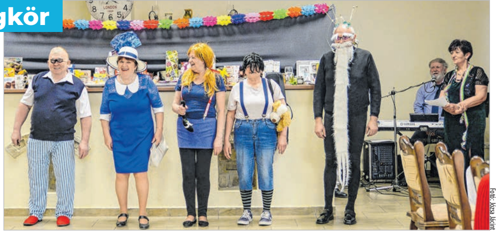
Mézza Gézáék is felvonultak a vándorlók buliján

A 72 jelenlévőből idén 27-en öltöttek álruhát és készültek egy-egy humoros zenés-táncos belépővel. Tiszteletét tette az egybegyűltek előtt többek között Popeye, a tengerész, a jamaicai trombitás, Máriaó a harmonikás,