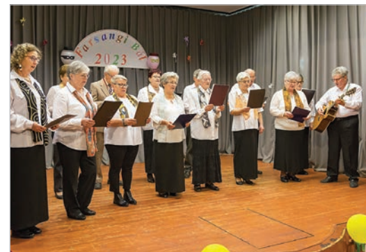
A produkció szereplőinek nyitó énekszám