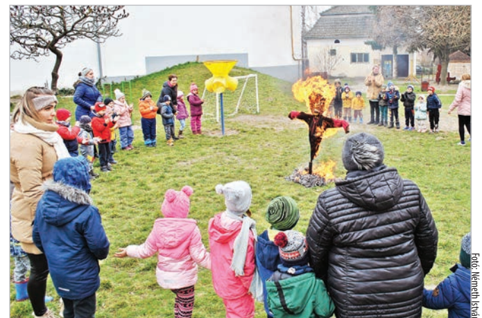
A tél utolsó napján égették el a kiszébábot a Selyem oviban