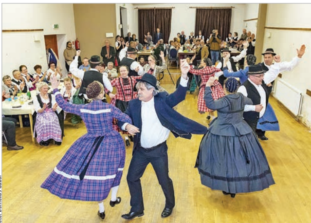
A mórágyi táncosok látványos műsort adtak