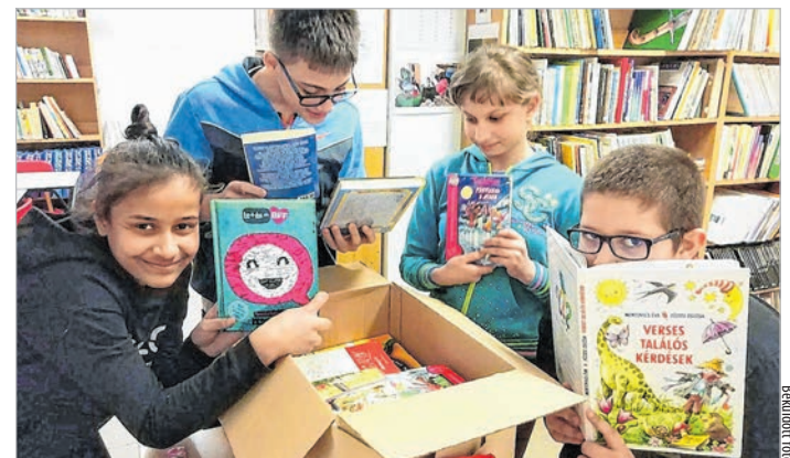
A tolnai gyerekek nézegetik a Szekszárdról kapott könyveket

ez a könyvajándékozó akció arra is sarkallja a fiatalokat, hogy felnőve majd ők is ajándékozzanak könyveket a szeretteiknek. -Wy-