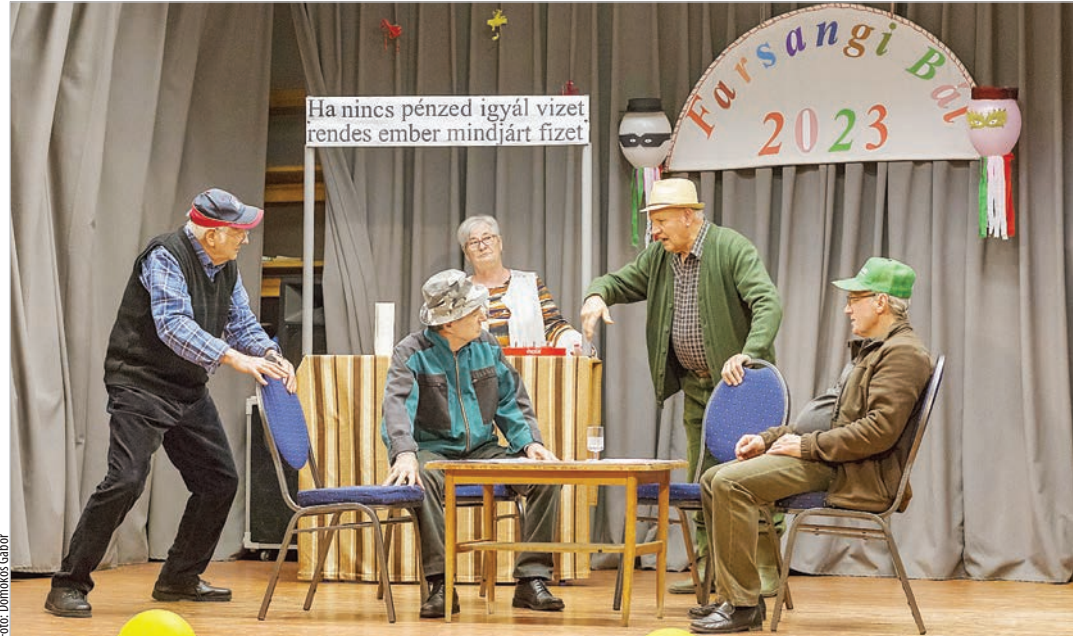
Kocsmajelenet az idei farsangi műsorban

Sok helyen rendeztek gond- és télűző, vidám programot