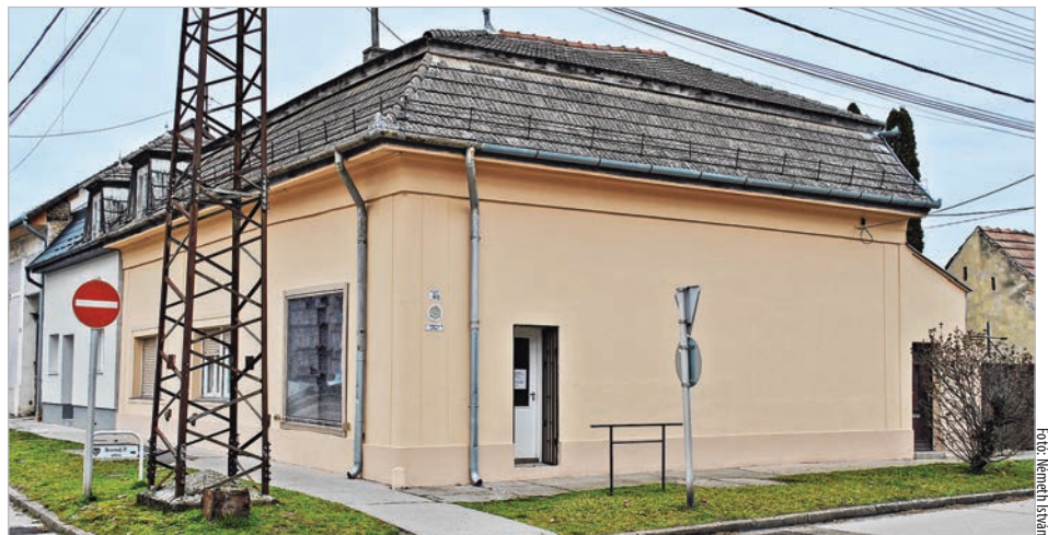
Több híres lakója is volt a Bezerédj és a Bajcsy-Zsilinszky utca sarkán álló háznak