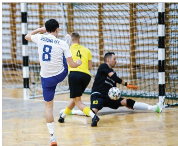
Ötöt lőtt a Tolna-Mözsi a Szigetszentmiklósra