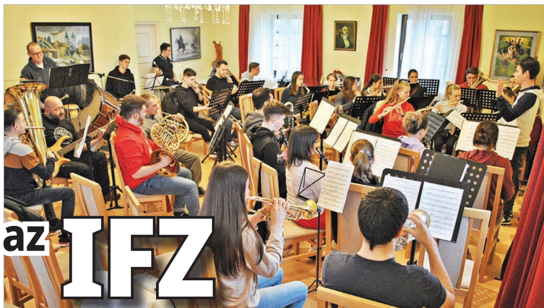
A zeneiskola dísztermében is csak szűkösen fér el a zenekar

Spanyol zeneszerző is lesz a vendégek között