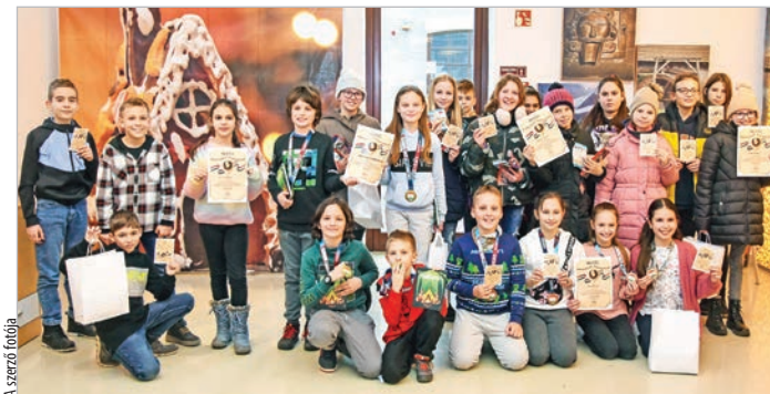
Huszonnégy csapat közül ők lettek a legjobbak