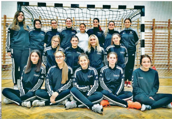
A Tolna KC U19-es csapatának tagjai

„Gyere, nézd meg az edzéseinket, állj be közénk, próbáld ki magad, és ha tetszik, legyél egy vidám, jó csapat tagja!”