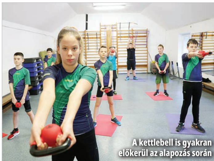
A kettlebell is gyakran előkerül az alapozás során

közülük sokan inkább csak kedvtelésből járnak. Nagyjából 35 fős a keménymag, azok a versenyzők, akik teljes erőbedobással, komolyan készülnek. Jelenleg egy válogatott sportolójuk van, de több tehetséges kajakosuk is az országos korosztályos élmezőnyhöz tartozik.