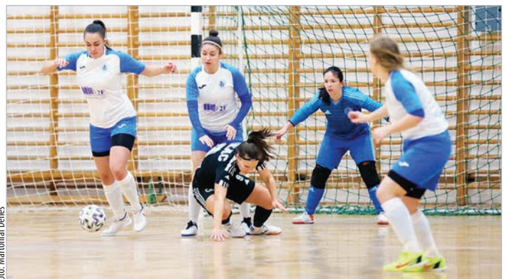
Wiesner Dalmáék nem engedték, hogy a DEAC gólt lőjön Tolnán

15 forduló után a 2F-Bau Tolna-Mözs a 3. helyre csúszott vissza, 8 pontos hátránnyal a DEAC, 1 ponttal lemaradva a TFSE mögött.