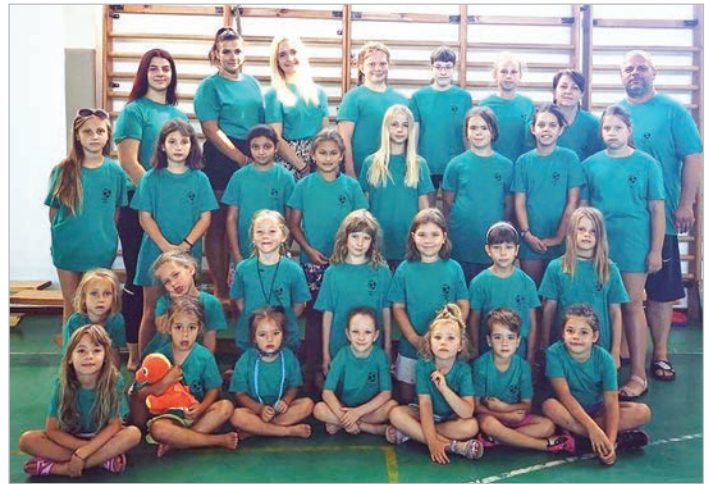
Augusztusban edzőtáborot rendeztek a gyermek- és kisiskolás korosztályoknak