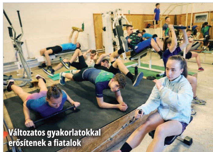
Változatos gyakorlatokkal erősítene a fiatalok

Jelenleg mintegy hetvenen látogatják az edzéseket, de