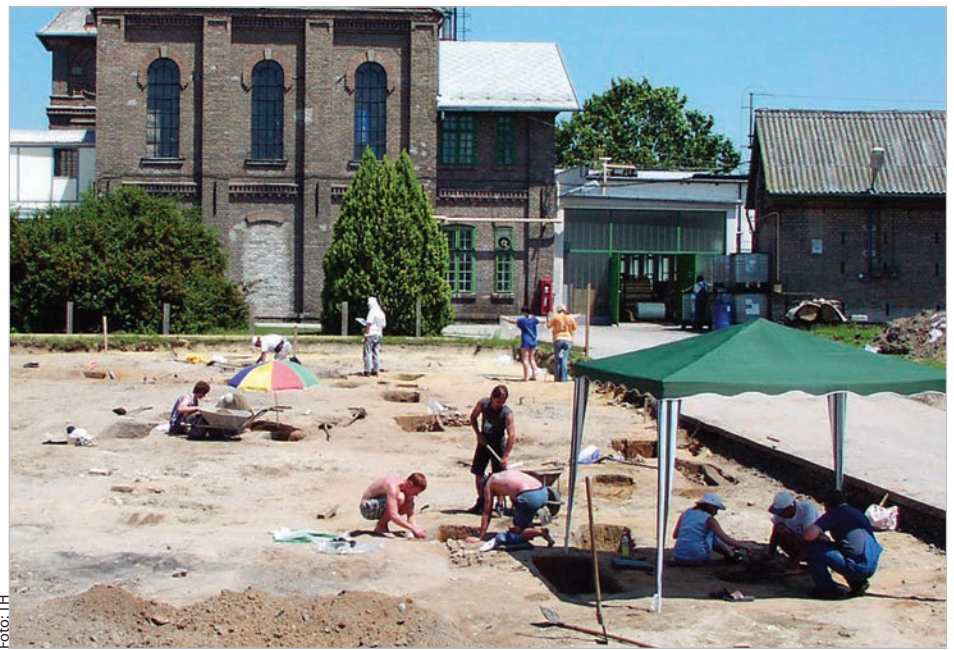
A régészeti ásatás az egykori kápolna és temető helyén, 2005 nyarán

köthető, ami a temetők városon kívülre való telepítését rendelte el. A Szent Bertalan kápolna körül elterülő temetőben 149 sírt találtak a régészek, de a teljes területet beépítés és korábbi bolygatás miatt nem tudták feltárni. Ugyan nem végeztek genetikai kutatásokat, de a temetkezések alapján családi kötődéseket fel lehetett fedezni. A temetőnek három sírcsoportját lehetett megkülönböztetni, teljesen jól elkülöníthetőek a német nyelvterületről jött betelepülők. Nem tudjuk, hogy végül is mikor és miért bontották le magát a kápolnát, talán egy tolnai tűzvésznek is szerepe lehetett benne. Mindenesetre gyorsan köré, majd ráépítkeztek, ezzel eltüntetve a látható nyo-