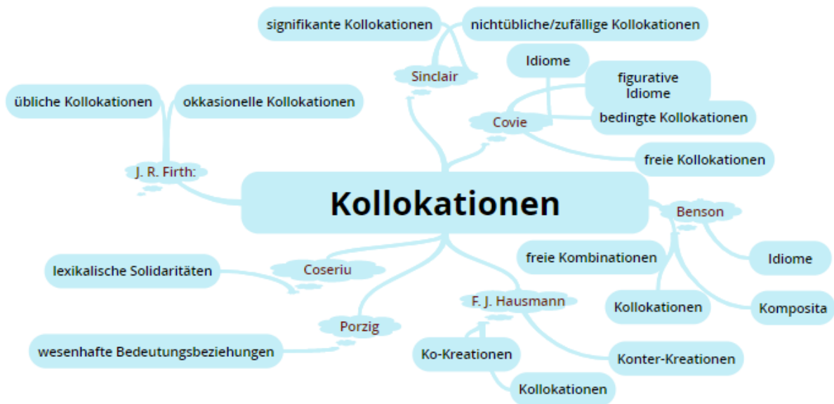
Abb. 2. Kollokationsauffassungen

Zusammenfassend wird der Versuch unternommen, die einzelnen Kollokationsauffassungen der erwähnten Autoren graphisch darzustellen (siehe. Abb. 2.).