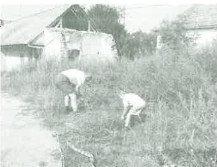
A nagy betakarítás