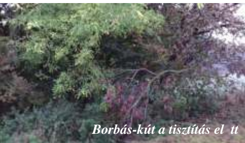
Borbás-kút a tisztítás előtt

Említettél a gazdálkodást. Milyen saját bevételi forrásokra támaszkodhattok?