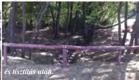
és tisztítás után.

Örülök, hogy felvetted. Kozármislenyi születésűként szívügyemnek tekintem a régi idők óta a lakosságot szolgáló zöldterületek felújítását, megújítását. Ilyen a Borbás-kút is. A felújítás után igazi kiránduló oázis jött létre forrással, fákkal, paddal, szeméttel. Az egykori öt gémeskútból jó lenne helyreállítani legalább azt a még meglévő egyet.