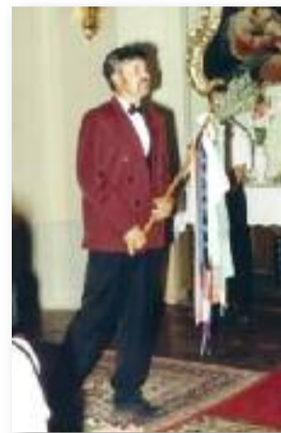
A vőfély felkéri a papot az esketésre

majd kivezet egy kislányt vagy egy idősebb hölgyet. Végül a vőfély újra bemegy a lakásba, de most már a menyasszonyt vezeti a vőlegény elé. A menyasszony selyemszalagot köt a vőfély botjára, amelyre a fiatal pár felírja a nevét és a dátumot.