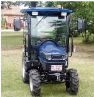
A pályázaton megvásárolt traktor

Jászágó Község Önkormányzata sikeresen pályázott a Járási Start Munkaprogram keretében, melynek köszönhetően egy Farmatrac 30 4WD típusú kistraktor megvásárlására nyílt lehetősége. Az eszköz a programban végzett állattartási és növénytermesztési munkálatokban fog segítséget nyújtani a településen.