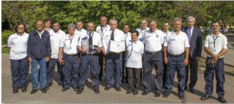
Az egyesület 2019-ben Jászárokszállás Városért kitüntetésben részesült

Fennállásának 25. évfordulóját ünneplik ebben az évben, a kialakult járványügyi helyzet miatt azonban ennek méltó megünneplésére feltehetően nem lesz lehetőség.