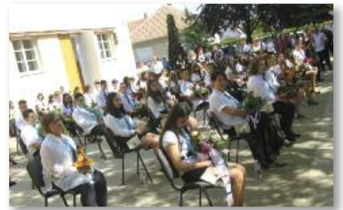
Ballagó diákjaink és osztályfőnökeik

zött őrzik meg a ballagási ünnepeket. Az eltelt három hónap sok változást hozott a hétköznapi életükben, de a mai ünnepség alkalmat adott