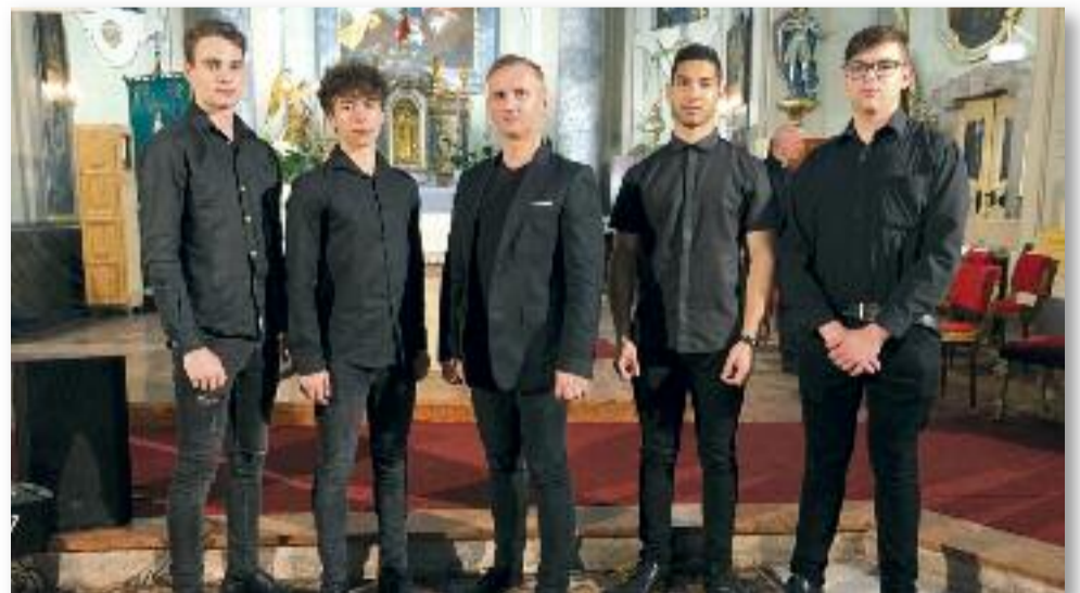
A négy szólista és a tanár úr

Szeptembertől pedig új lendülettel készülhetünk az újabb élvezetes koncertekre és remek dalokra.