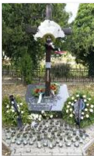
72 mécses az egykori 72 vármegye emlékére

Az, hogy jogilag is lehetséges lehetett a megemlékezés megvalósítása, csak az előző hét közepén derült ki számomra. Rögtönzés gyanánt egy helyi fiatalokból álló dalkosorú jött számításba. Kiss Kata: Magyar