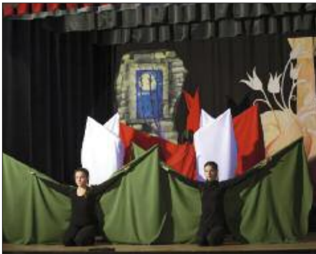
Jelenet az ünnepi műsorból