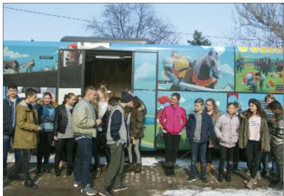
Az Arany-busz és a kipróbáló diákok