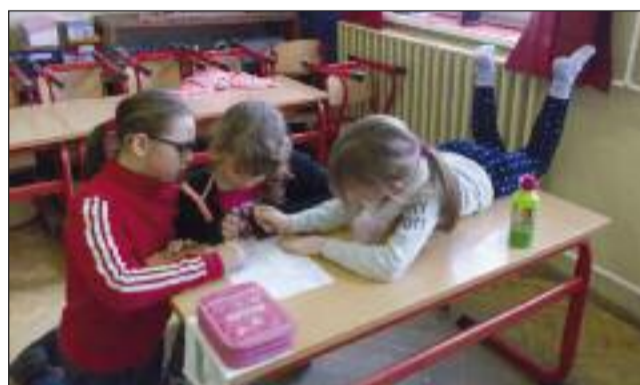
Ettől a feladattól teljesen kifeküdtem

Február 9-én volt a nyelvész Országos Anyanyelvi Tanulmányi Verseny iskolai fordulója. E versenynek a célja