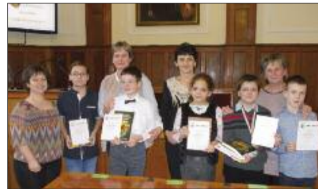
A legjobb matematikusaink és felkészítőik

közül a legösszetettebb, legtöbb időt, összeszokott csapatunkat igénylő verseny a mesevetélkedő, ahol nem elég jól ismerni a meséket, de gyorsnak és nagyon pontosnak is kell lenni. A 4. fordulóra, ahol már tíz meséből kel-