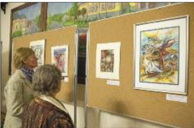
A kiállított képek megtekintése