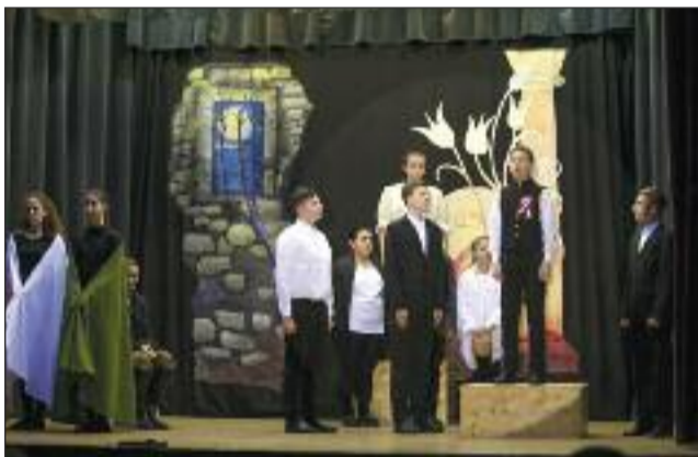
Jelenet az ünnepi műsorból

Tudjuk, a szabadságot nem adják ingyen, nehéz küzdelem, súlyos szenvedések árán lett jobbá a világ, amelyben élünk. Sohasem felejthetjük el a márciusi ifjakat, akik 170