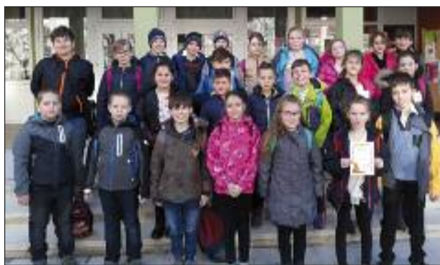
A mesevetélkedő megyei döntőjének résztvevői

Most ír, skót népzene, balladákat, kocsmadalokat hallhatunk a M.É.Z. (a Meg nem értett Zenekar) előadásában március 19-én, a Művelődési Házban. A M.É.Z. 1988-ban alakult, ír és skót folkenét