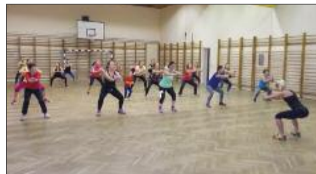
Az Iron Box kondióra résztvevői egy nemes célért