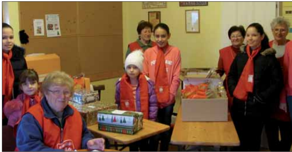
Tartós élelmiszer és cipődoboz osztás a Junior Karitászosokkal