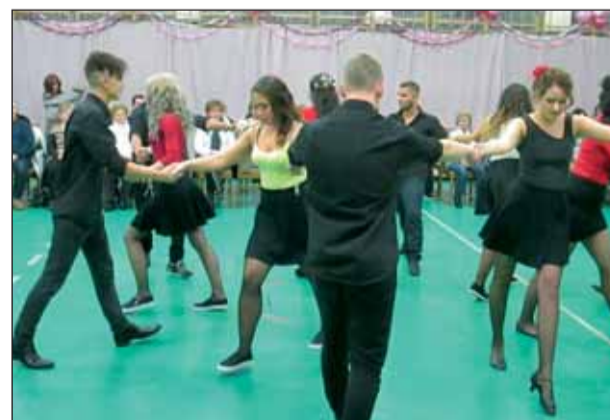
A 12. B osztály

tán polgármester köszöntötte a megjelenteket. Ezután felcsendült az első dal, a 12. A kezdő táncpárja a helyére indult, majd őket követve egész osztályunk