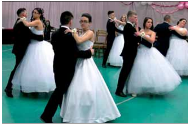
A 12. B osztály