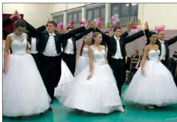
A 12. A osztály

energiát és a szabadidőnk nagy részét fektettük a próbákba. Többször előfordult, hogy a táncpróba az esti órákig elhúzódott, de mindez megérte az erőfeszítést, hiszen a Tablóbálon a 12. A és