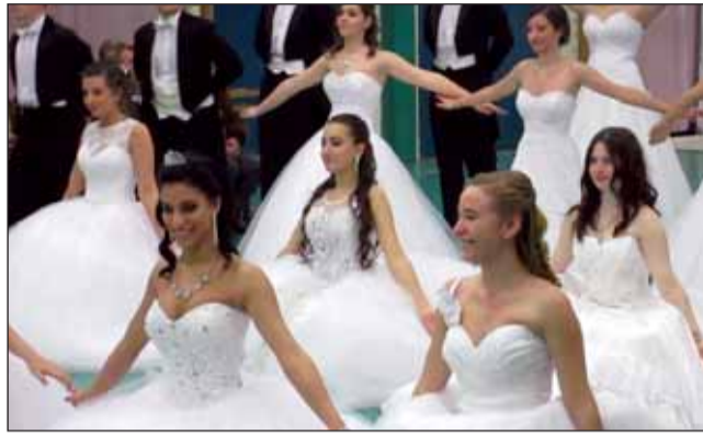
A 12. A osztály

keringője zárta. Koreográfiájuk energikus, elegáns és szemet gyönyörködtető volt. Előadásuk és a taps lecsendesedése a bál hivatalos részével,