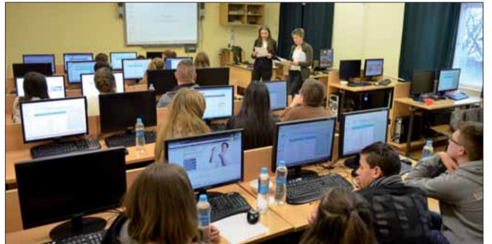
A kft. alapításához szükséges feladatok kutatása

Miután megismerkedtek a vállalkozások alapításával és működtetésével, a vállalkozási formákkal kapcsolatos ismereteiket foglalták össze egy táblázat hiányzó elemeinek a kitöltésével. Az