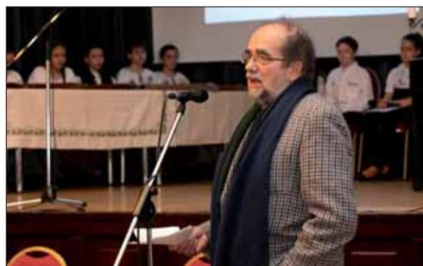
Az ünnepi szónokunk

Jászárokszállás szívében viseli a köz érdekét, és támogatja a generációkat. Ünnepségünk keretein belül fiatal tehetsé-