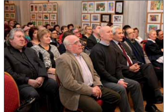
A közönség, háttérben a pályaművek

mertették velünk Oszétiát és az ott élő oszétokat, az ott élt élményekbe is betekintést nyerhettünk. Kovács