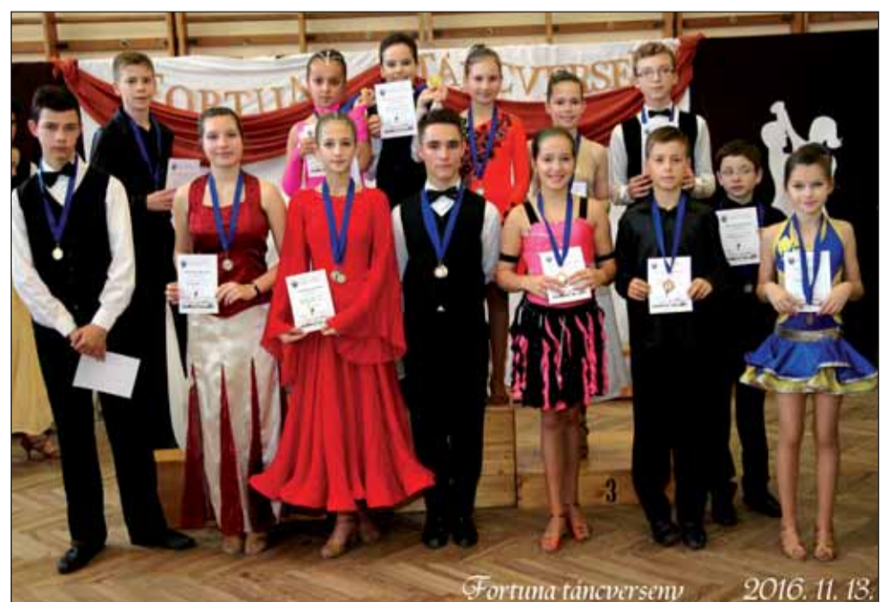
A Fortuna TSE díjazottjainak egy csoportja