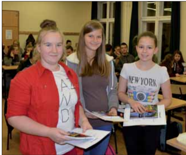
Az első helyezett angolos csapat

meihez, folyosóikhoz kötődtek: az angol, illetve német nyelven megfogalmazott kérdésekre kellett válaszolniuk a háromfős csapatoknak. Ehhez körbe kellett járniuk az iskolát és meg kellett érteniük a néha nem is olyan egy-