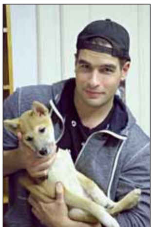
Tomo kutyus is elkísérte

Október 5-én Lakatos Levente a jászárokszállási Városi Könyvtárba látogatott az Országos Könyvtári Napok keretein belül. A rendezvényen nagy számban jelentek meg azok, akik érdeklődtek a szerző iránt, ismerték a műveit vagy szívesen megismerkedtek volna velük. A programon részt vevők sokat megtudhattak az író könyveiről, karrierjéről és magánéletéről a vele folytatott beszélgetés során.