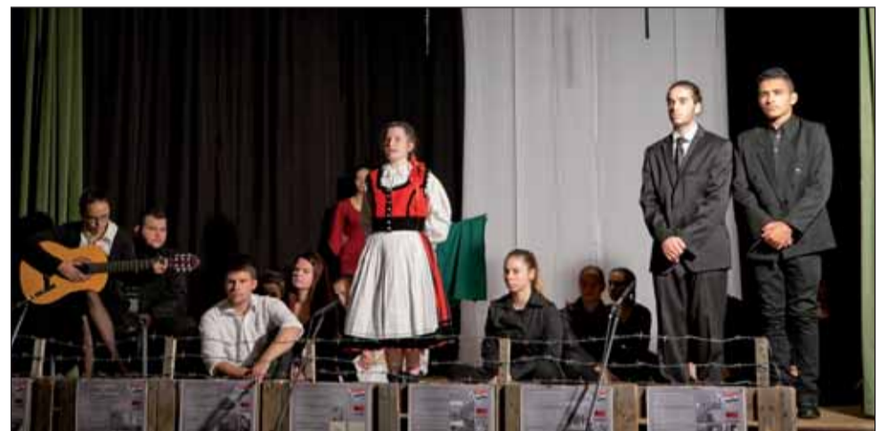
Jelenet az ünnepi műsorból

fe fekete-fehérben maradtak ránk. A mögöttük megjelenő verő és vert árnyékalakok