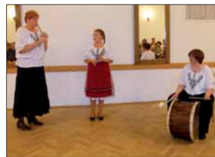
Az új hangszer és megszólaltatói

rajtátékát, aki a Váci Nemzetközi Zongoraversenyen korcsoportjában első helyezést ért el. A kislány teljes átéléssel zongorázott, ő értette, tudta, mit üzent a zeneszerző és át is tudta adni nekünk, hallgatóknak. Különös érzés, mikor a diák a tanárával együtt játszik. Jó volt látni a sokéves együttes munka eredményét. Minden szakavatott kézben egy hangszer másként szólalt meg. Egyszer sírni, máskor táncolni láttuk a kis mesterek kezében a húrt, a vonót.