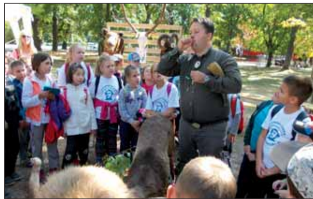
Szarvasbőgést hallgattak a gyerekek

Hiszen ahány évszak, annyi arculatát mutatja ugyanaz a hely, fa, virág, bokor: