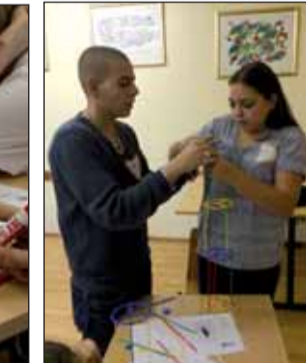
Épül a torony

„Bemutatták, hogy milyen nehéz a pénzzel bánni és hogy mennyire felelősségteljesen kell ezt tenni. A trénerünk elmondta és érvekkel alátámasztotta, hogy a pénz mellett vannak