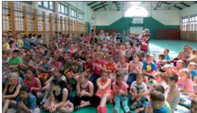
A helyes kézműs gyakorlása

örömmel sorakoztak a Szent Vince tornatermében tanítványaink, ugyanis itt vehették át a gyerekek az Eleven Ház által adományozott sportszereket. Köszönjük ezt a felajánlást,