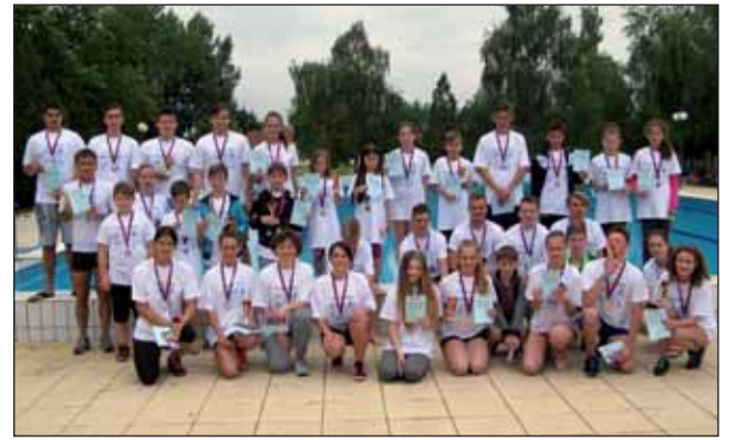
A TRIATLON győztesei

A nyár a pihenés, a feltöltődés időszaka. Iskolánk nyári