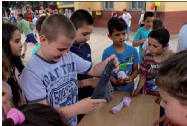
Melyik zokninak melyik a párja

rekek feladata. Egy egérfogó játékot is készítettek a gyerekek, mellyel versenyeztek, ki a legügyesebb egérfogó. Ajándékként kis labdát kaptak a szülői munkaközösségtől, me-