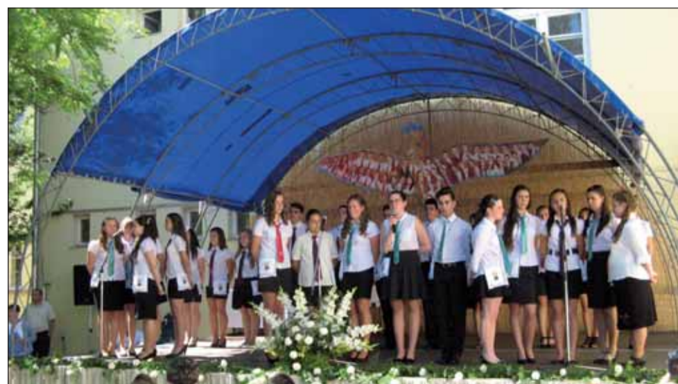
A madár szárnyát kitérte, repülésre készenállt a búcsúzó társaság

ennek az 59 kismadárnak és három anyukájának voltunk a szemtanúi, ahogy június 18-án iskolánk ballagási ünnepségén végigvették