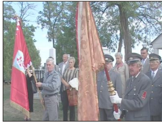
Tiszteletadás a sírnál

gyelve mennydörgések zaja ébreszti fel a szunnyadó Tápiót. Dörgés-villámlás egymást éri. Aki nem hitte, az is hiszi, hogy eljött a végítélet.