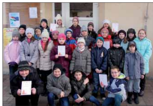
A mi mesés csapatunk

Február 7-én hét 4. osztályos tanuló vett részt Szolnokon, a Tiszán innen Dunántúl Országos Népdaléneklési Versenyen. A sok gyakorlás, a jó dalválasztás meghozta a sikert. Csalogányaink éneke elnyerte a zsűri tetszését. Csatokban az I. helyezést, az