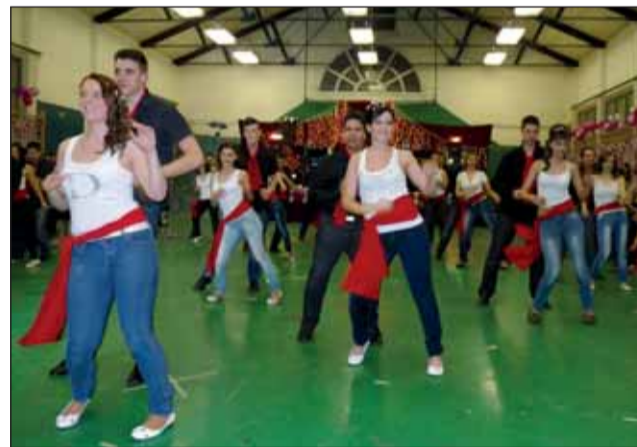
A 12. a vidám hangulatban