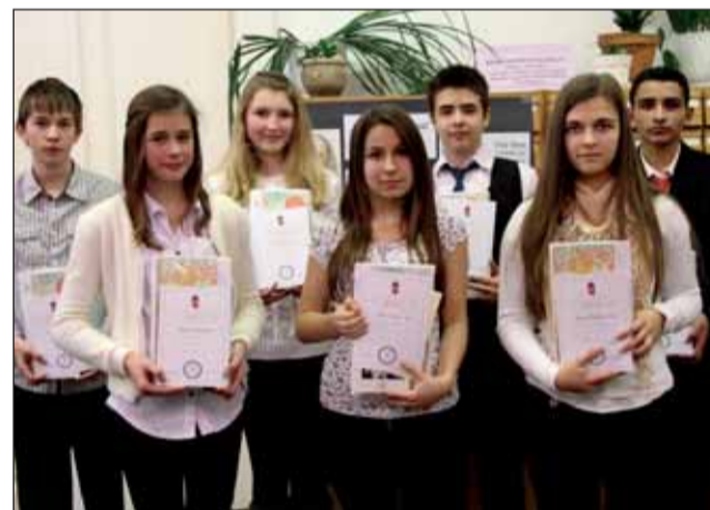
A 7-8. évfolyam dobogójai