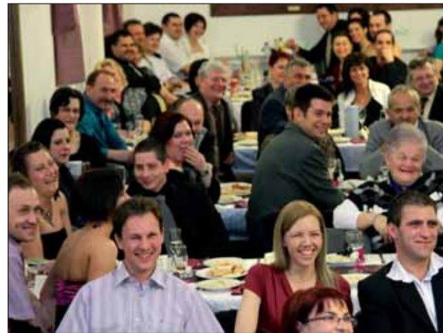
Poénélvezők és az elkövető...

meglévő udvari játékok környékét szeretnék gu-