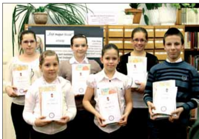
Az 5-6. évfolyam helyezettei

szempontjainak megfelelően értékelték a tanulók teljesítményét.