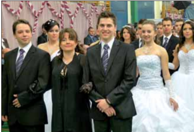
A 12. a

XXV. (XLIX.) évfolyam • 2. szám • ára: 115 Ft • www.jaszarokszallas.hu