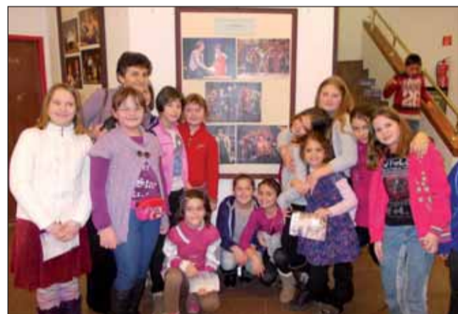
A padlás lakói és lelkes nézői

rekek tetszését e darab is elnyerte, hiszen ismert mesék régi szereplői jöttek vissza hozzánk egy délutánra, kik közül a Lámpás már 670 éves volt. Korát meghazudtolóan jól mozgott, és igyekezett elérni a célját. A legnagyobb tetszést Robinson robot aratta, aki mindent megfejtett, de néha lemerült, mikor oly nagy segítségre lett volna szüksége a megalkotójának. Mikor már úgy éreztük minden probléma megoldódott, újabb megoldásra váró bonyodalommal kellett megbirkóznunk a mesék hőseinek. A jól ismert betétdalokat a szünetekben, illetve hazafelé a buszon is énekeltek a gyerekek. Az előadás végén szomorúan búcsúztunk a régi mesék hőseitől, de együtt örültünk a padlás lakóinak a szerelméhez.