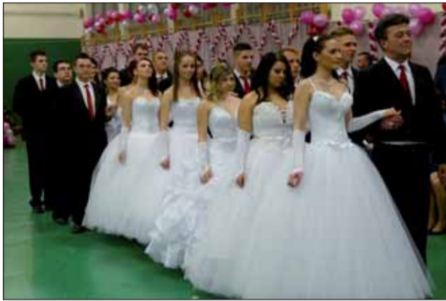
A 13. b

A Deák Ferenc Gimnázium, Közgazdasági és Informatikai Szakközépiskola végzős diákjai 2014. február 8-án tartották tablóbálijukat a bálteremmé vált Szent Vince úti tornacsarnokban.