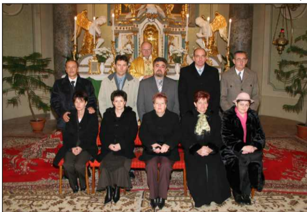
50 éves jubilánsok