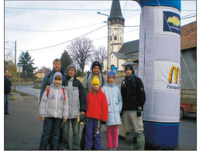
Ideális háttér az induláshoz: a patai Templom

azonban mégis az, hogy Jászárokszállásról kevesen voltunk, pedig nem is olyan messzire mentünk, kitűnő szervezésben volt részünk, és persze a táj sem volt utolsó! Hogy mi következik? Persze, hogy a Téli Mátra januárban, bár addig még ügyis találkozunk. Ha itthon nem, majd fenn a Hegyen!