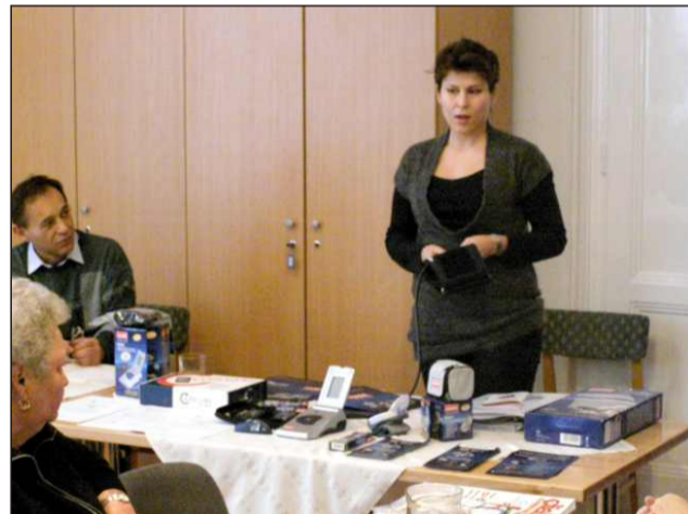
A fotók Cukorbeteg Világnapjának helyi ünnepségén készültek

Programjaink az egészségtudatos embereknek is szólnak. Nyilvánvaló, hogy az érszűkület, a csontritkulás és még ezerféle „nyavalya” nemcsak a cukorbetegeket sújtja. Időről-időre szűrő-