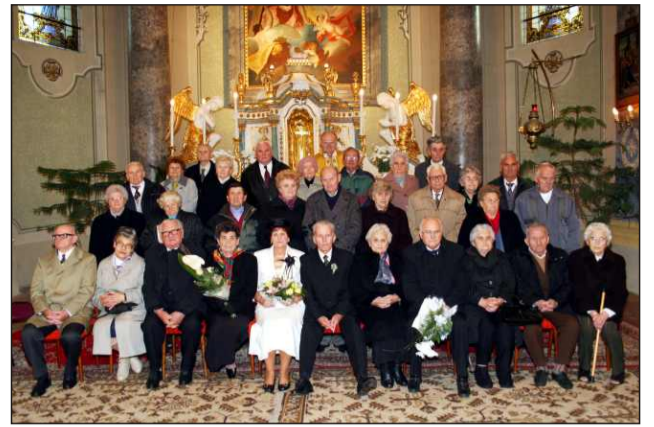
50 éves jubilánsok

Az egyházközség a jubiláló házaspárokat ebédre látta vendégül a Búzavirág Étteremben, ahol Gergely Zol-